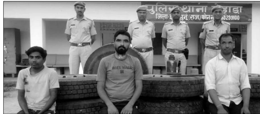
मेहाड़ा पुलिस ने चोरी के मामले में तीन जनों को पकड़ा।

खेतड़ी, (नि.सं.)। मेहाड़ा पुलिस ने डंपर के टायर सहित अन्य सामान चोरी का शुकुवार को खुलासा किया है। पुलिस ने चोरी के आरोप में तीन आरोपियों को गिरफ्तार कर चुराया गया सामान बरामद किया है।