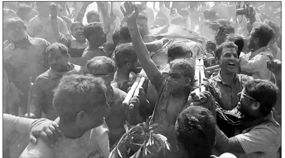
भीलवाड़ा में मुर्दे की सवारी (ईलाजी की डोल) निकली गई, इसमें युवक गुलाल उड़ाते हुए चलते रहे।

चिंतौड़वाले की हवेली के पास से मुर्दे की सवारी (ईलाजी की डोल) निकली गई। इसमें जिंदा युवक की अर्था सजाकर बाजार में घुमाया गया और युवक गुलाल उड़ाते हुए चलते रहे। कुछ युवक अर्था पर लेते युवक पर वार करते रहे। इसके चलते वह अर्था से कूदकर भागने का प्रयास करता तो फिर से उसे