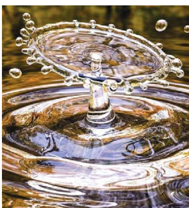
alarming pace, threatening water security, ecosystems, and climate stability.

Every year on March 22, World Water Day highlights water-related challenges and advocates for sustainable water management. The theme for 2025, 'Glacier Preservation', underscores the urgent need to protect the world's glaciers, which are melting rapidly due to climate change. These frozen reservoirs hold 70% of the world's freshwater, playing a crucial role in maintaining river systems, sustaining agriculture, and supporting millions of lives. However, as global temperatures rise, glaciers are vanishing at an