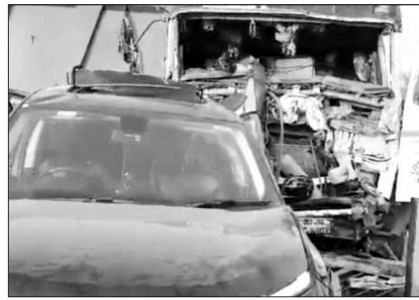
हादसे में दोनों वाहन क्षतिग्रस्त हो गये। वहीं मौके पर पहुंचे परिजनों ने घायलों को संभाला।

बताया जा रहा है कि यूपी के मेरठ निवासी श्रद्धालु कार में सवार होकर खाटूश्यामजी जा रहे थे। कार को ग्राम मोरदा पुलिया के पास पीछे से एक ट्रैले ने टक्कर मार दी। हादसा इतना भीषण था कि कार के परखच्चे उड़ गये, जबकि ट्रैला भी अनियंत्रित होकर डिवाइडर से टकरा गया। हादसे के बाद मौके पर चीख पुकार मच गई। साथ ही राजमार्ग पर यातायात भी बाधित हो गया। हादसे के बाद पीड़ित परिवार के कुछ और सदस्य भी पीछे आ रही कार में आ रहे थे। जैसे ही उन्हें घटना की खबर मिली तो उनका भी रो-रोकर बुरा हाल हो गया। हादसे की सूचना पर पहुंची पनियाला थाना पुलिस ने स्थानीय लोगों की मदद से घायलों को