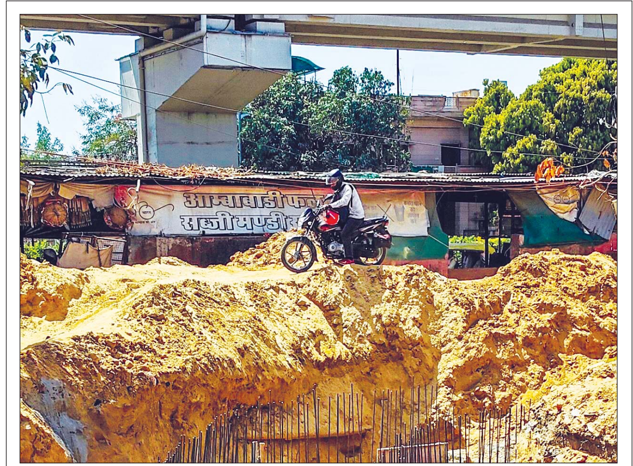
सीकर रोड पर डेहर के बालाजी पर बारिश के दौरान पानी भरवा से निजात के लिए नाला डाला जा रहा है। आंबाबाड़ी सब्जी मंडी के पीछे तक ये नाला पहुंचे काफी समय हो चुका है। तब से इस रोड को खोद कर छोड़ रखा है। लोग लंबा चक्कर बचाने के लिए जीवन जोखिम में डाल कर नाला क्रॉस कर रहे हैं।

के बाल स्वयंसेवक को पुलिस ने पकड़कर इतना पीटा कि उसके कान के पर्दे फट गए। इमरजेंसी में मनमाने तरीके से जेल में डाला गया। एक रोडवेज ड्राइवर का किस्सा है, बीच रोड बस बैठी थी, उसे लेकर रोडवेज ड्राइवर ने कमेंट कर दिया कि इंदिरा गांधी की तरह टूट बनकर बैठी है। इस कमेंट पर उस ड्राइवर को जेल में डाल दिया था। जैन ने कहा कि इंदिरा गांधी को भरोसा दिलाया गया था कि 400 सीट कांग्रेस की आएगी, तब इमरजेंसी हटाकर चुनाव करवाने का फैसला किया था। तब लोग कहते थे कि गाय और बछड़ा दोनों हारेंगे। उस समय गाय और बछड़ा कांग्रेस का चुनाव चिह्न था। इंदिरा गांधी और संजय गांधी दोनों चुनाव लड़े और हारे थे। इमरजेंसी को सिलेबस में शामिल करके पढ़ाया जाए ताकि नई पीढ़ी को पता लगे।