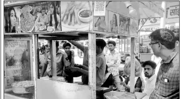
खाद्य सुरक्षा टीम ने मोमोज के टेले पर तेल की जांच की।

गंगापूर सिटी, (नि.सं) खाद्य सुरक्षा विभाग की टीम ने शुकवार को कई दुकानों का निरीक्षण किया। टीम ने 150 किलो इमरती को नष्ट करवाया और मिलावट की जांच के लिए नमूने लिए वहीं, टीम के आने की जानकारी मिलते ही कई दुकानदार अपनी दुकानें बंद कर फरार हो गए।