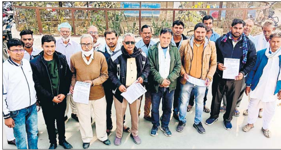
डीबर सागर बांध से पानी दिलाने के लिए ग्रामीणों ने अतिरिक्त जिला कलेक्टर को ज्ञापन दिया।

काबिलेगौर है कि विगत दिनों तालुका विधिक सेवा समिति प्रभारी द्वारा किए गए निरीक्षण में मिली खामियों पर एडीजे ने इस मामले में खासी नाराजगी जाहिर की थी क्योंकि निरीक्षण के दौरान रैन बसेरा पर ताले मिले थे तथा ताले खुलवा कर शिफ्ट कर चैक करने पर एक भी लाभार्थी की एंटी नहीं मिली थी साथ ही रिपोर्ट में रैन बसेरा अंबेडकर भवन में लगाया गया है। इसका भी कोई इंद्राज नहीं मिला था तथा वेसहारा लोगों इससे लाभाभिव्यक्त किए जाने के लिए पालिका पर शिफ्ट करने का आदेश प्रचार-प्रसार भी नहीं किया जा