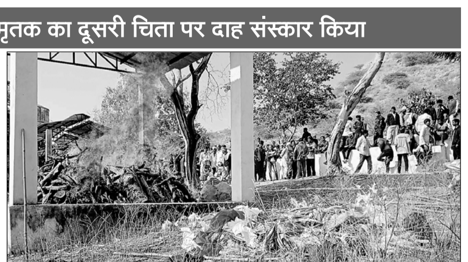
सामोद के एक ही परिवार के 8 मृतकों का एक ही चिता व दूसरे का दूसरी चिता पर दाह संस्कार किया।

चौमू/कालाडैरा, (निर्स)। रविवार को सौकर के पलसाना में हुए सड़क हादसे में सामोद गांव के 9 जनों की मौत से पूरे गांव में शोक की लहर है। एक ही परिवार के 8 व अन्य एक युवक के शव गांव में पहुंचे तो मृतकों