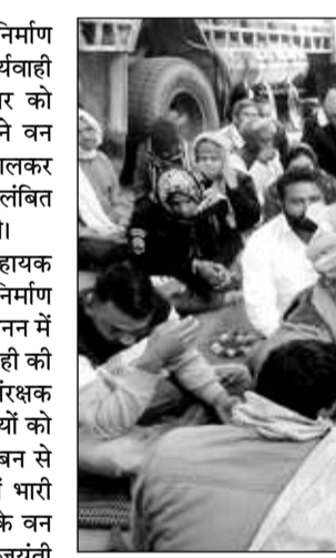
करौली उपवन संरक्षक कार्यालय में पड़ाव डालकर बैठे वनकर्मी।

करौली, (निर्स)। वन भूमि में सड़क निर्माण रोकने और अवैध खनन के खिलाफ कार्यवाही करने पर क्षेत्रीय वन अधिकारी व रेंजर को निलंबित करने के विरोध में कार्मिकों ने वन विभाग कार्यालय परिसर में पड़ाव डालकर प्रदर्शन किया। ज्ञापन सौंपा और निलंबित अधिकारियों को बहाल करने की मांग की।