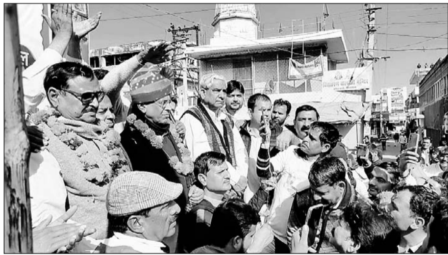
नीमकाथाना को जिला बनाने की मांग को लेकर लोग नाचते गाते जयपुर के लिए रवाना हुए।