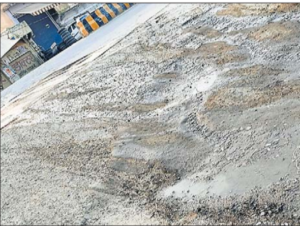
चाकसू में टूटी हुई पाइप लाइन से पानी व्यर्थ बह रहा है।

चाकसू, (निर्स)। कस्बे के नगर पालिका के सामने टोंक रोड के नीचे जलदाय विभाग की टूटी हुई लाइन से हजारों लीटर पानी लंबे समय से व्यर्थ बह रहा है। जैसे ही सप्लाइ शुरू की जाती है उसके बाद पानी बहना शुरू हो जाता है, जिससे थोड़ी देर में ही सडक पर पानी बहना नजर आता है। एक तरफ कस्बे स्थित उपखंड क्षेत्र के घरों के नलों तक सही समय पर पानी नहीं पहुंच रहा है, जिससे लोगों को पीने के पानी की समस्या बनी रहती है तो वहीं एक तरफ पेयजल की समस्या हर मौसम में बनी रहती है और यहां जिम्मेदारों को बार-बार अवगत करने के बावजूद भी लोकेज की समस्या बनी हुई है। लेकिन अधिकारी कर्मचारियों को लापरवाही के