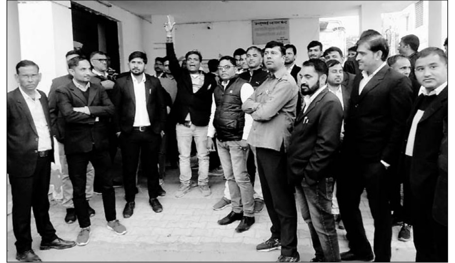
मांग को लेकर पुलिस अधीक्षक कार्यालय के बाहर प्रदर्शन करते अधिवक्ता।