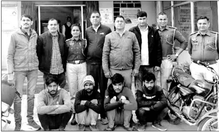
मुरलीपुरा थाना पुलिस ने ज्वैलरी की दुकानों से चोरी करने वाले गिरोह का पर्दाफाश करते हुए सोमवार को चार शांतिर बदमाशों को गिरफ्तार किया।