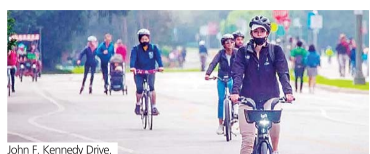
John F. Kennedy Drive.

these bike-and-pedestrian-friendly re-modelings feature parklet-style public seating, bike