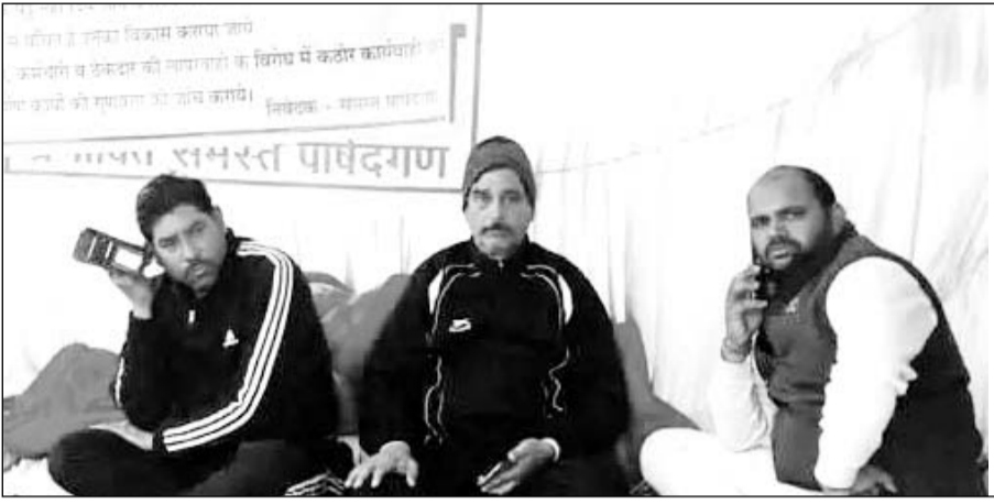
अलवर में नगर परिषद के अधिकारियों, कर्मचारियों और ठेकेदारों पर भ्रष्टाचार और लापरवाही का आरोप लगाते हुए 8 दिन से नगर परिषद परिसर में 3 पार्षद धरने पर बैठे हैं।