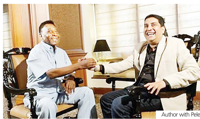
Author with Pele.