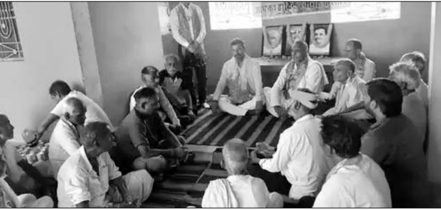
गंगापुर सिटी में भाजपा की ग्रामीण मण्डल की बैठक में सरकारी योजनाओं पर चर्चा की।

गंगापुर सिटी । समीपवर्ती उदई कला स्थित बालाजी महाराज मंदिर परिसर में भाजपा ग्रामीण मंडल की संगठनात्मक बैठक हुई।