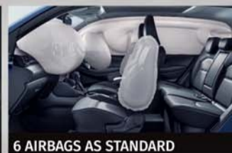
6 AIRBAGS AS STANDARD