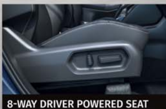
8-WAY DRIVER POWERED SEAT