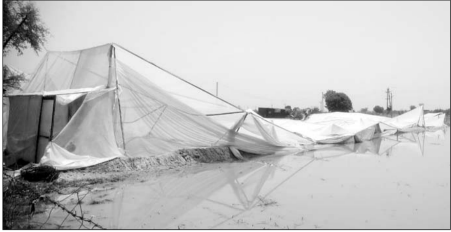
निवाड़ में आये तेज अंधड़ से नेट हाउस गिर गया।

निवाड़, (निस)। उपखण्ड मुख्यालय सहित क्षेत्र के अनेक गांवों में शनिवार की देर शाम आए भीषण अंधड़ से सैकड़ों पेड़ व विद्युत पोल धराशाही हो गए, जिससे पिछले दो दिन से ग्रामीण इलाकों में बिजली पूरी तरह गुल है और लोग अंधेरे में रहने को मजबूर हैं। बिजली संकट के कारण ग्रामीणों को भारी परेशानियों का सामना करना पड़ रहा है। तेज अंधड़ का सबसे ज्यादा असर ग्राम पंचायत सुनारा के दर्जनों गांवों में देखने को मिला, जहां पेड़ों व बिजली के खंभों के टूटने के साथ-साथ लोगों के घरों के चहर और छप्पर तक उड़ गए।