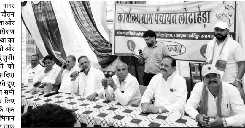
ऊर्जा मंत्री हीरालाल नागर ने कनवास क्षेत्र के लोढ़ादेड़ा में जनसुनवाई की।

ऊर्जा मंत्री हीरालाल नागर ने देश के प्रधानमंत्री का उदाहरण देते हुए कहा कि जब देश के प्रधानमंत्री नरेंद्र मोदी स्वच्छता अभियानों को सफल बनाने के लिए स्वयं हाथों में झाड़ू थाम सकते हैं, तो हमें अपने ही गांवों को साफ करने में कोई शर्म या हिश्रक नहीं होनी चाहिए। स्वच्छता हम सबकी पहली जिम्मेदारी है। निरीक्षण के दौरान नागरियों में फंसी पाँलियीन को देखकर मंत्री नागर ने गहरी चिंता व्यक्त की। उन्होंने ग्रामीणों को समझाते हुए कहा कि नाँलियों में पड़ी पाँलियीन को अक्सर बेसहारा गांवों छा लेती है, जिससे उनकी