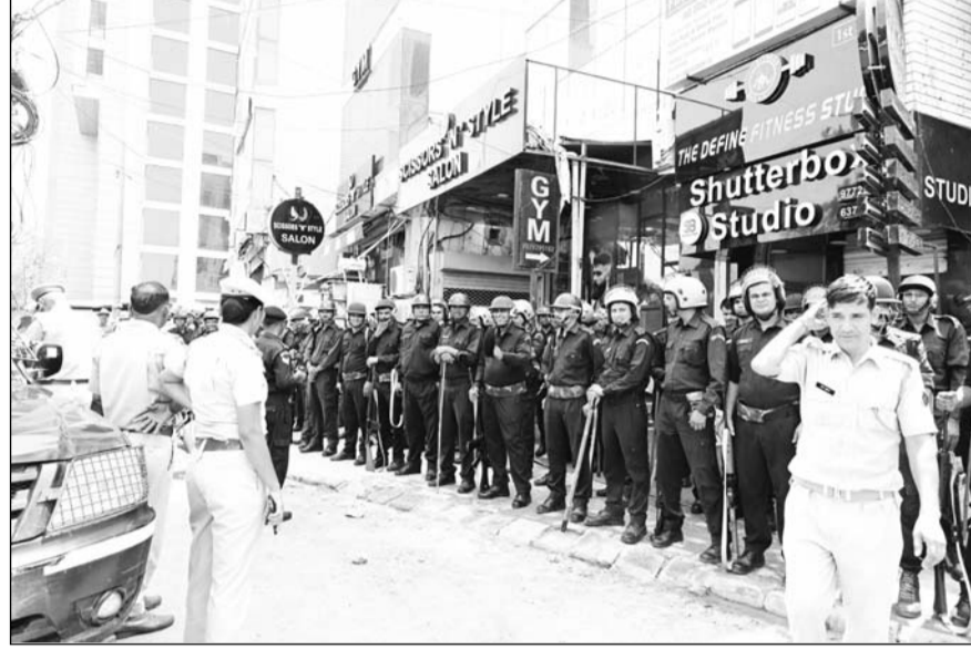
मालवीय नगर क्षेत्र में रविवार को पुलिस और आरएसी कंपनियों के जवानों ने फ्लैग मार्च निकाला। इसके साथ ही नंदपुरी क्षेत्र में बैरिकेड्स लगाकर रास्ते बंद कर दिए हैं।