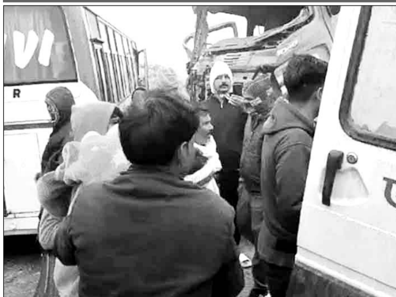
स्थानीय नागरिकों ने घायलों को बाहर निकालकर अस्पताल पहुंचाया।

पुलिस ने स्थानीय नागरिकों की सहायता से घायलों को नसीराबाद अस्पताल पहुंचाया