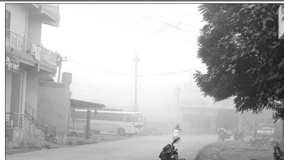
मसूदा में कोहरा छाये से वाहन चालक परेशान हुये।

मसूदा उपखंड में इस सीजन का अब तक का सबसे घना कोहरा क्षेत्र में देखा गया। इस दौरान दृश्यता मात्र 10 मीटर तक ही रही। सर्दी से बचाव के लिए लोग दिन में अलाव तापते नजर आए। क्षेत्र में पिछले दिनों हुई बारिश के बाद सर्द हवाओं के चलने के साथ ही हलल तेज हो गई है। कोहरे के आगोश में कस्बा रहा। सर्दी के चलते लोग घरों में दुबके रहे, सर्दी के तीखे तेवरों ने लोगों को घरों में