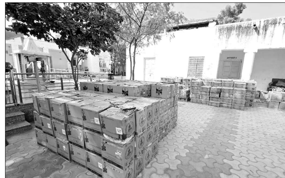
सायला पुलिस ने अवैध शराब सहित एक आरोपी को गिरफ्तार किया।

जालोर, (कास)। जालोर जिले के सायला थाना पुलिस व डीएसटी सांचौर ने रविवार को पंजाब निर्मित अवैध अंग्रेजी शराब की विभिन्न ब्रांड की 500 पेट्टी, अवैध शराब परिवहन में प्रयुक्त ट्रक जब्त किया। वहीं एक आरोपी को गिरफ्तार किया। पकड़ी गई अवैध शराब को बाजार कीमत करीब 40 लाख आंकी गई है।