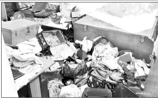
चोरी की वारदात के बाद घर में सामान बिखरा पड़ा है।

डूंगरपुर, (निर्स)। जिले के कोतवाली थानान्तर्गत डूंगरपुर शहर की पत्रकार कॉलोनी में चोरों ने एक डॉक्टर के सून मकान को अपना निशाना बनाया है। चोरों द्वारा घर के अन्दर का सारा सामान बिखेर कर नगदी सहित जेवरात चुराकर ले जाने की आशंका जताई जा रही है। पीड़ित परिवार जयपुर गया हुआ है। परिवार के आने के बाद चोरी हुए सामान की पूरी जानकारी का पता लग पायेगा। वारदात के बाद सूचना पर पहुंची कोतवाली पुलिस मामले की जांच में जुटी है।