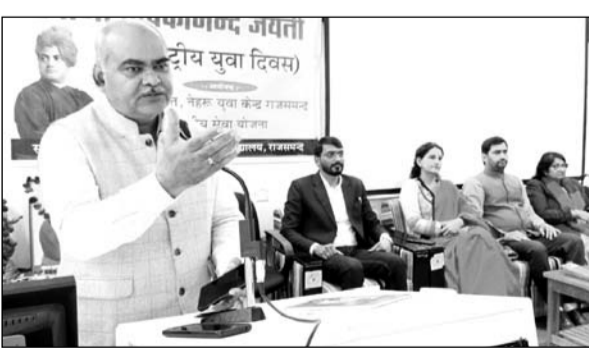
राजसमंद में स्वामी विवेकानन्द की जयंती एस आर के कॉलेज में आयोजित कार्यक्रम को सम्बोधित करते अतिथि।