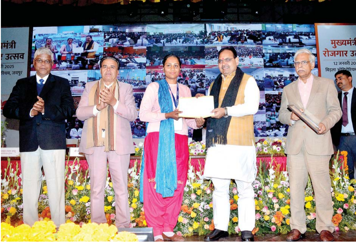
मुख्यमंत्री भजनलाल शर्मा ने बिड़ला ऑडिटोरियम में चतुर्थ मुख्यमंत्री रोजगार उत्सव एवं लोकार्पण, शिलान्यास कार्यक्रम को संबोधित किया। इस अवसर पर उन्होंने 13 हजार 500 युवाओं को नियुक्ति पत्र दिये।