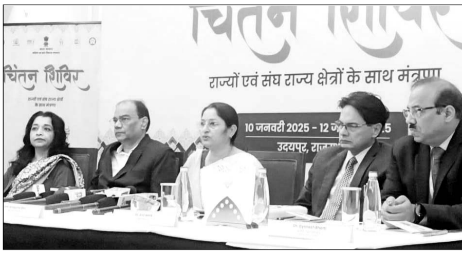
उदयपुर में प्रेसवार्ता को केंद्रीय महिला एवं बाल विकास मंत्री अन्नपूर्णा देवी ने संबोधित किया।।

■ '5 हजार करोड़ की लागत से बननेगी कामकाजी महिलाओं के हॉस्टल'