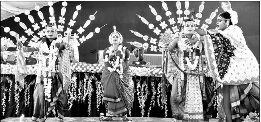
जालोर महोत्सव के तहत उड़ीसा के लोक कलाकारों ने नृत्य की प्रस्तुति दी।

जालोर, (कास)। जालोर महोत्सव 2025 के तहत मंगलवार रात्रि को नटराज मंच पर उड़ीसा के लोक कलाकारों ने जगन्नाथपुरी यात्रा सहित कई लोक संस्कृति से ओतप्रोत नृत्य की प्रस्तुति देकर श्रोताओं को मंत्रमुग्ध कर दिया।