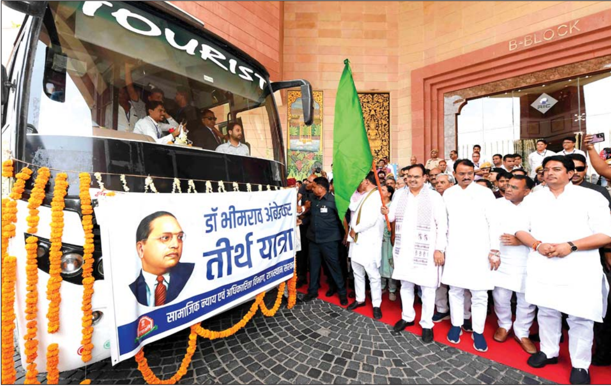
मुख्यमंत्री भजनलाल शर्मा ने डॉ. भीमराव अंबेडकर जयंती पर राजस्थान इंटरनेशनल सेंटर में आयोजित समारोह को संबोधित किया। इस अवसर पर उन्होंने कहा बाबा साहेब भीमराव अंबेडकर पंचतीर्थ भ्रमण योजना के तहत राज्य सरकार अनुसूचित जाति के लोगों को बाबा साहेब के जीवन से जुड़े पंचतीर्थों का भ्रमण करवा रही हैं। योजना के अंतर्गत आज उन्होंने बस को हरी झण्डी दिखाकर रवाना भी किया।