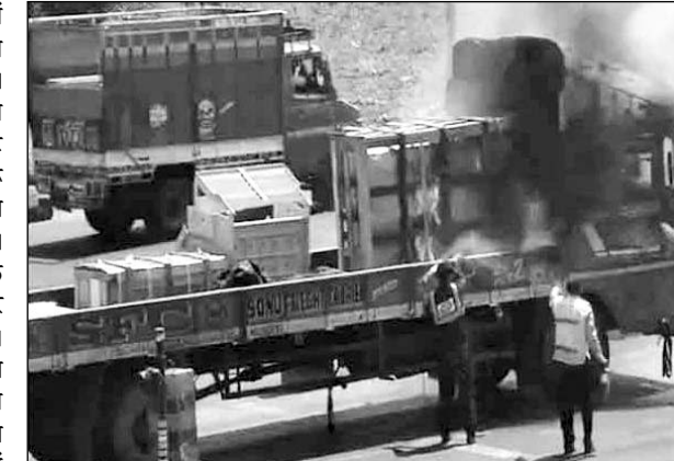
ट्रक में आग लगने से सामान जल गया।

लग गई। एलपीजी गैस के प्लास्टिक पाइप के कारण आग ने विकराल रूप धारण कर लिया। आग की लपटें देर तक बढ़ती गईं। स्थानीय लोगों ने अलवर गेट थाना पुलिस को सूचना दी। दोनों ही घटनाओं में अग्निशमन विभाग के दमकल कर्मियों ने आग पर काबू पाया। पहली घटना:- नाका मदार क्षेत्र में देर रात खाली प्लांट में भीषण आग