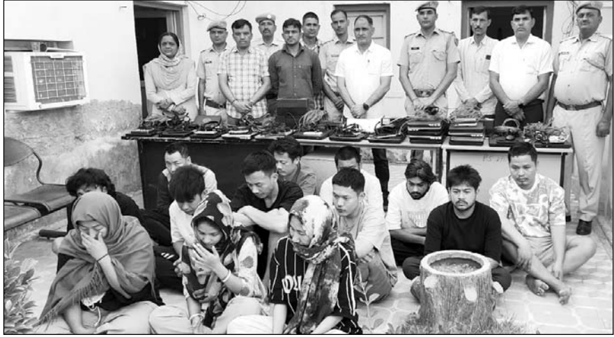
पुलिस ने होटल में दबिश देकर सायबर ठगी करने वाले 13 जनों को गिरफ्तार किया है, जिनमें तीन युवतियाँ भी शामिल हैं।

जिस पर पुलिस ने रविवार शाम को दबिश दी। पुलिस जब होटल पर कार्रवाई करने के लिए पहुंची तो होटल बंद था जिसके चलते पुलिस ने दीवार फाटकर होटल में घंटी की तो होटल के अलग-अलग कमरों में अलग-अलग युवक युवतियाँ लैपटॉप और मोबाइल पर कार्य कर रहे थे, जिनके लैपटॉप चैक किए और पृष्ठताछ की तो सामने आया कि आरोपी एक अंतर्राष्ट्रीय गैंग के सदस्य हैं, जो