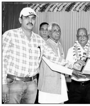
राजगढ़ सादुलपुर नागरिक परिषद कोलकाता के आर्थिक सौजन्य से निर्मित का लोकार्पण किया।