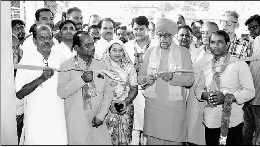
लोकसभा चुनाव में भाजपा प्रत्याशी सांसद स्वामी सुमेधानंद सरस्वती ने चौमू विधानसभा क्षेत्र में जनसंपर्क किया।

ग्राम पंचायतों में किया जनसंपर्क, भाजपा के पक्ष में मतदान की अपील की