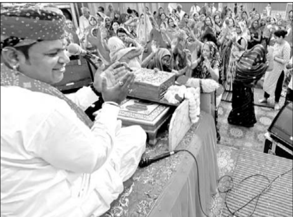
श्याम मंदिर के 58वें वार्षिकोत्सव पर कथा का आयोजन किया।