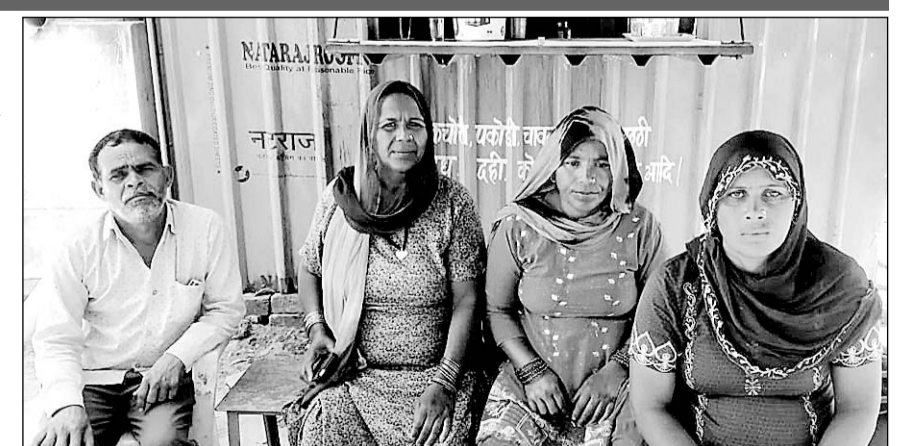
पंजियन कार्यालय बंद होने से अपने कार्य कराने आने वाले लोगों को परेशानी हो रही है।