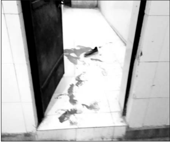
घटना के बाद जिला अस्पताल परिसर में फैला खून।