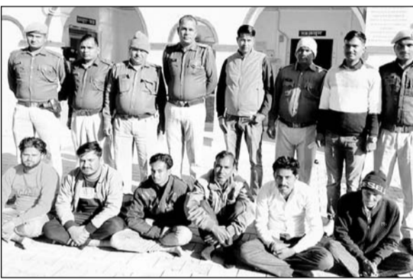
रामगंजमंडी पुलिस ने जुआ खेलते 6जनों को गिरफ्तार किया।