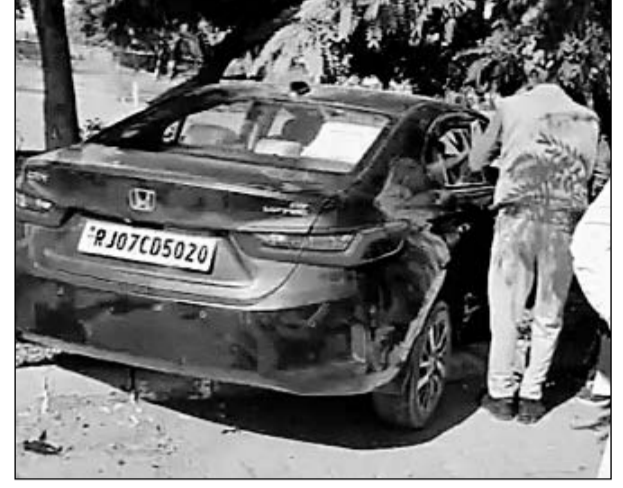
घटना के बाद पुलिस ने मौका मुआयना किया।