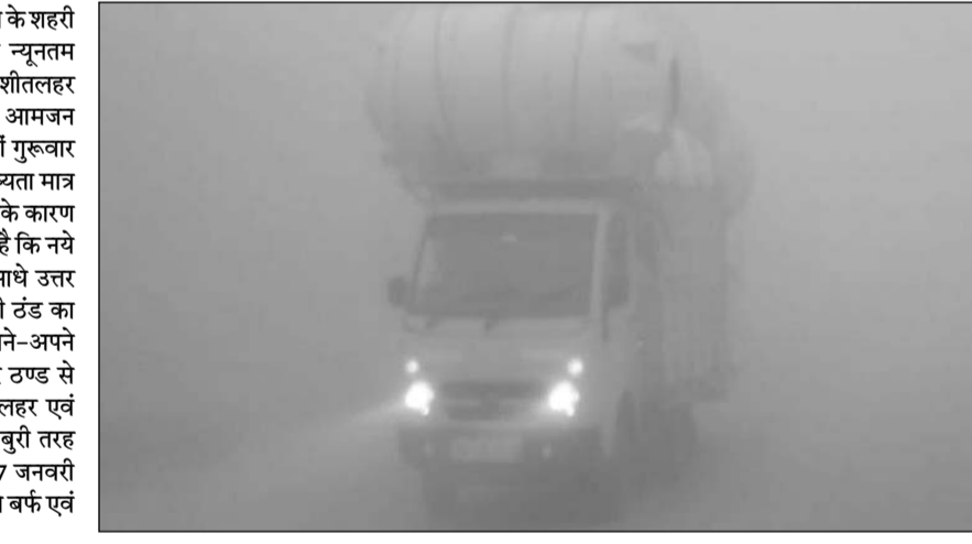
चालक लाइट जलाकर वाहन चलाने नजर आए।

सादुलपुर, (निसं)। शेखावाटी के चूरू जिले के शहरी एवं ग्रामीण क्षेत्र में लगातार तीन दिनों से न्यूनतम तापमान माइनस में चले जाने से कोहरे एवं शीतलहर से कड़ाके की ठंड जारी है, जिसके कारण आमजन का जन जीवन अस्त-व्यस्त हो गया है। वहीं गुरुवार अल सुबह से ही घना तेज कोहरा होने से दृष्यता मात्र 10 मीटर से भी कम दिखाई दे रही थी। जिसके कारण वाहन चालक रंगते हुए नजर आये। ज्ञातव्य है कि नये साल के आगाज से ही शेखावाटी सहित आधे उत्तर भारत में कड़ाके की एवं हाड कम्पाने वाली ठंड का कहर जारी है। इसी दौरान व्यपारियों ने अपने-अपने प्रतिष्ठानों के आगे दिनभर अलावा जलाकर ठण्ड से राहत पाने का प्रयास किया। वहकी शीत लहर एवं कोहरे के कारण आम जनजीवन यातायात बुरी तरह प्रभावित हुआ। मौसम विभाग के अनुसार ने 7 जनवरी 2023 तक शीतलहर की चेतावनी के चलते बर्फ एवं पाला पडने से किसान चिंतित हैं।