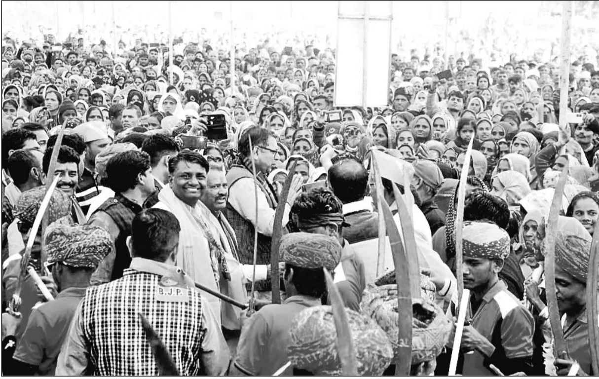
वागड़ क्षेत्र के प्रवास पर भाजपा प्रदेश अध्यक्ष डॉ. सतीश पूनियां ने डूंगरपुर जिले के चौरासी विधानसभा क्षेत्र में जन आक्रोश सभा को संबोधित किया।

सतीश पूनियां ने जन आक्रोश सभा को संबोधित करते हुए कहा कि, हिंदुस्तान के हर व्यक्ति ने, हर कबीले ने, हर कुटुंब ने, हर जाति ने खूब संघर्ष किया, पसोना बहाया और अपने खून का बलिदान भी दिया, लेकिन दुर्भाग्य है कि 55 सालों तक कांग्रेस पार्टी के पंजे ने राज किया और उस पंजे ने ऐसा इतिहास लिखा, जिसमें यह कहा कि आजादी के योगदान में जनजाति का कोई योगदान नहीं था, कांग्रेस का यह पडवंत्र दुर्भाग्यपूर्ण है। काली बाई भील की शहादत तो पढ़ते, नानाभाई खट्ट के बलिदान को शहादत का सम्मान करने