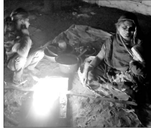
उदयपुर शहर में लोगों ने अलाव का सहारा लिया।

उदयपुर, (कासं)। शीत लहर के साथ पड़ रही कड़ाके की ठंड ने लेकसिटी में जनजीवन को अस्त-व्यस्त कर दिया है। तेज ठंड के प्रकोप के चलते गुरुवार को जिला कलेक्टर ने आदेश जारी कर स्कूलों में 6 व 7 जनवरी