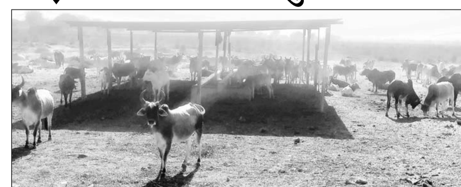
पावटा में कड़ाके की ठंड की बीच खुले आसमान के नीचे ठिठुरता गौवंश।

पावटा, (निसं)। कड़ाके की ठंड में गौवंश ठिठुर रहे हैं। सर्दी के सितम के बीच उनकी लाचारी फलक पर है। अन्य मौसम में तो ऐसे गौवंश खुले आसमान के नीचे अपना दिन किसी तरह काट लेते हैं पर कड़ाके की ठंड में उन पर एक-एक पल भारी पड़ रहा है। ठंड बढ़ने के साथ ही बेसहारा गौवंश के मरने की की गति भी बढ़ गई है। पावटा, प्रागपुरा, जयसिंहपुरा बागावास नदी सहित कई