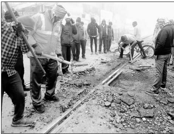
नदबई कस्बे के बाजार में रेल पटरी को दुरुस्त करती टीम।

नदबई, (निर्स)। आगरा-बांदीकुई रेलमार्ग पर रेलकर्मियों की सतर्कता से बड़ा हादसा होने से टल गया। जब, सर्दी के चलते नदबई कस्बे के मुख्य बाजार में स्थित गेट नं 57 पर रेल पटरी में दरार आने से ट्रेनों का संचालन रोक दिया गया। रेल पटरी में दरार आने पर उदयपुर-खुजराहो इंटरसिटी एक्सप्रेस को खेडली स्टेशन व मरुधर एक्सप्रेस को नदबई स्टेशन पर रोक दिया गया। सूचना पर रेलकर्मियों की टीम ने मौके पर पहुंच कर रेल पटरी को दुरुस्त कर करीब डेढ़ घण्टे बाद आगरा-बांदीकुई रेलमार्ग पर ट्रेनों का