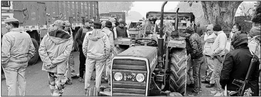
पथराव की घटना के बाद पुलिस टीम ने जंक्ट वाहनों को कब्जे में लिया।

धौलपुर, (निर्स)। अवैध खनन के खिलाफ कार्रवाई करने गई एस.आई.टी की टीम पर खनन माफियाओं ने गुरुवार को पथराव कर दिया। पथराव में सरकारी गाड़ी के शीशे टूट गए। पथराव होने पर एसआईटी के अधिकारी गाड़ी छोड़कर मौके से भाग निकले। सूचना