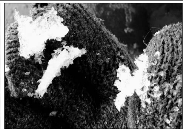
बीदासर में गुरुवार की सुबह कपड़ों पर बर्फ जम गई।