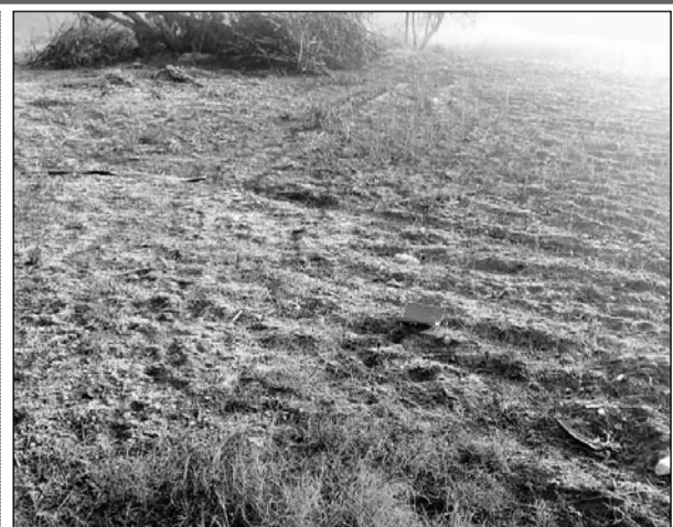
बोराज के खेतों में फसल पर जमी बर्फ।

बुधवार को अल सुबह से ही ठंडी हवाओं के चलने के साथ ही सर्दी का आलम यह रहा की गुरुवार सुबह 10 बजे तक चटक धूप खिलने के बावजूद भी सर्द हवाओं से हाथ पैरों में ठिठुरन बरकरार रही। बुधवार तड़के न्यूनतम पारा दो डिग्री पर पहुंच गया। ठंड के कहर से बचने के लिए लोगों ने दिन में भी अलाव जलाया। बुधवार रात्रि को ठंडी हवाएं चलने के साथ ही रात को तापमान में गिरावट आई। जिसका असर गुरुवार को सुबह देखने को मिला। तहसील के ग्रामीण इलाकों के खेतों में पेड़ पौधों के पत्तों व टहनियों पर बर्फ जमी हुई नजर आई।