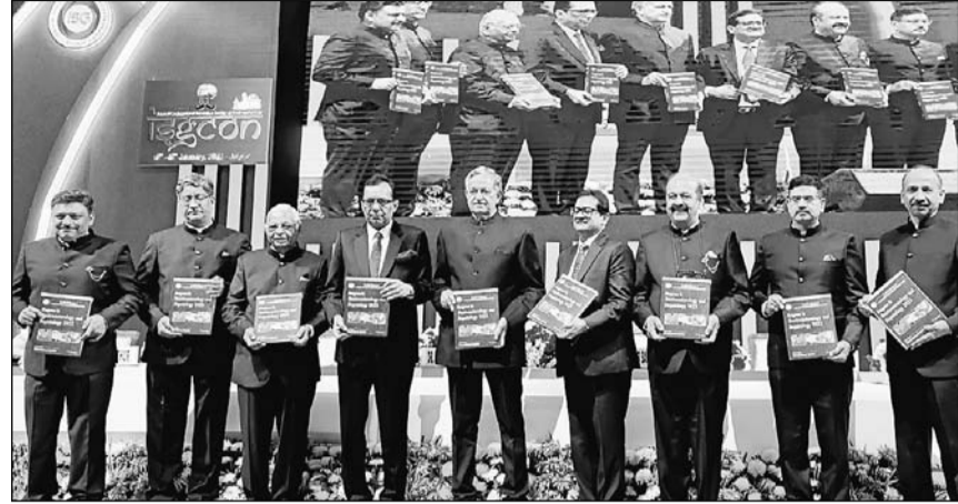
जयपुर के सीतापुरा स्थित जेईसीसी में इंडियन सोसायटी ऑफ गैस्ट्रोएंटरॉलजिस्ट इंटरनेशनल कॉन्फ्रेंस में ‘‘प्रोग्रेस इन गैस्ट्रोएंटरॉलजिस्ट एंड हेपेटोलॉजी’’ किताब का विमोचन किया गया।

जयपुर (कांसं)। मोटापे से जुड़े रहे लोगों को अब तक दर्द भरी जटिल सर्जरी करानी पड़ती थी। सर्जरी के बाद भी कुछ दवाइयों और सावधानियां जीवनभर चलती थीं, लेकिन अब नई तकनीकों से बिना कोई चीरफाड़ के वजन कम हो जाता है। मरीज इस प्रक्रिया के एक दिन बाद ही अस्पताल से डिस्चार्ज होकर अपना सामान्य जीवन जी सकता है। सीतापुरा स्थित जेईसीसी में इंडियन सोसायटी ऑफ गैस्ट्रोएंटरॉलजी की ओर से इंटरनेशनल कॉन्फ्रेंस आईएसजीकोन-2023 में देश-विदेश से आए एक्सपर्ट्स ने यह जानकारी दी।