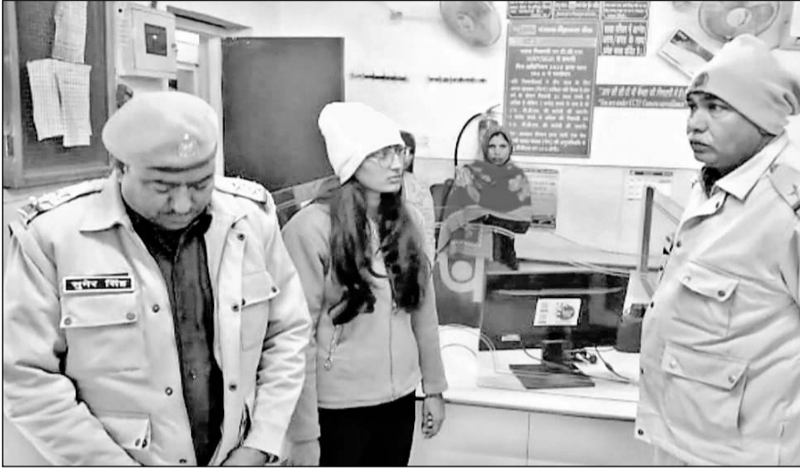
बैंक लूट के फुटेज देखते पुलिस अधिकारी।

मिली जानकारी के अनुसार कस्बा वैर की पंजाब नेशनल बैंक में बदमाशों ने दिनदहाड़े हथियार लहराते हुए कैशियर पर हथियार तान दिये।