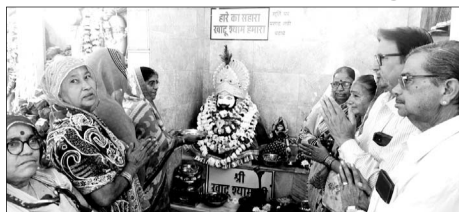
जोधपुर में सदर थाना प्रताप नगर के सामने स्थित हनुमान शनिधाम में खादू श्याम मंदिर में एकादशी के अवसर पर विशेष कार्यक्रम का आयोजन किया।