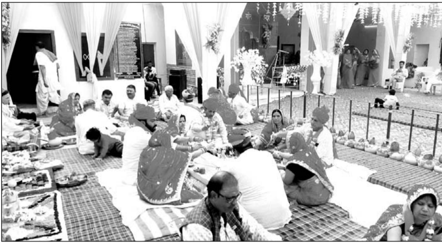
पाली में महर्षि गौतम व माता अहिल्या की मूर्ति स्थापना को लेकर हवन हुआ।