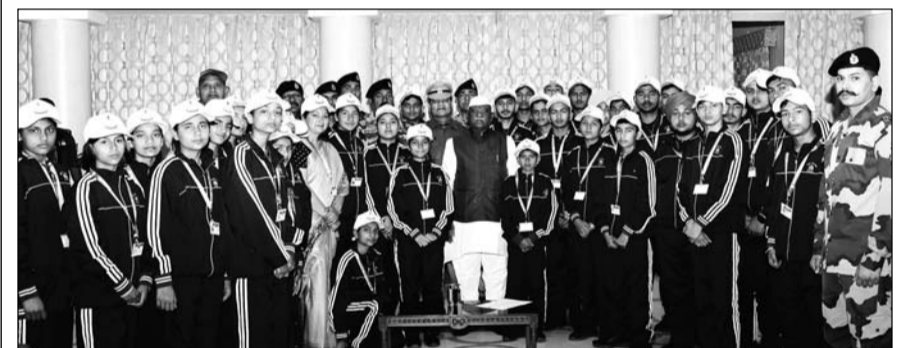
राज्यपाल हरिभाऊ बागडे से शनिवार को राजभवन में भारत दर्शन यात्रा पर आए 35 विद्यार्थियों के दल ने मुलाकात की। सीमा सुरक्षा बल द्वारा आयोजित यह दल जम्मू तवी से जयपुर यात्रा पर आया हुआ है। इस दौरान राज्यपाल से संवाद में उन्होंने भारत दर्शन यात्रा के अपने अनुभव साझा किए। राज्यपाल बागडे ने एक भारत श्रेष्ठ भारत की संकल्पना के अंतर्गत इस तरह की यात्राओं को महत्वपूर्ण बताया। उन्होंने राजस्थान की संस्कृति, वीरता और शौर्य की चर्चा करते हुए गौरवमय अतीत से जुड़े राजस्थान के शौर्य और वीरता के किस्से-कहानियों में यहां के किले-महल्लों और मंदिरों के स्थापत्य के साथ राष्ट्रीयता से जुड़े मूल्यों पर विद्यार्थियों से संवाद किया। भारत दर्शन पर आए 35 विद्यार्थियों के इस दल में 20 लड़कें और 15 लड़कियां सम्मिलित हैं।