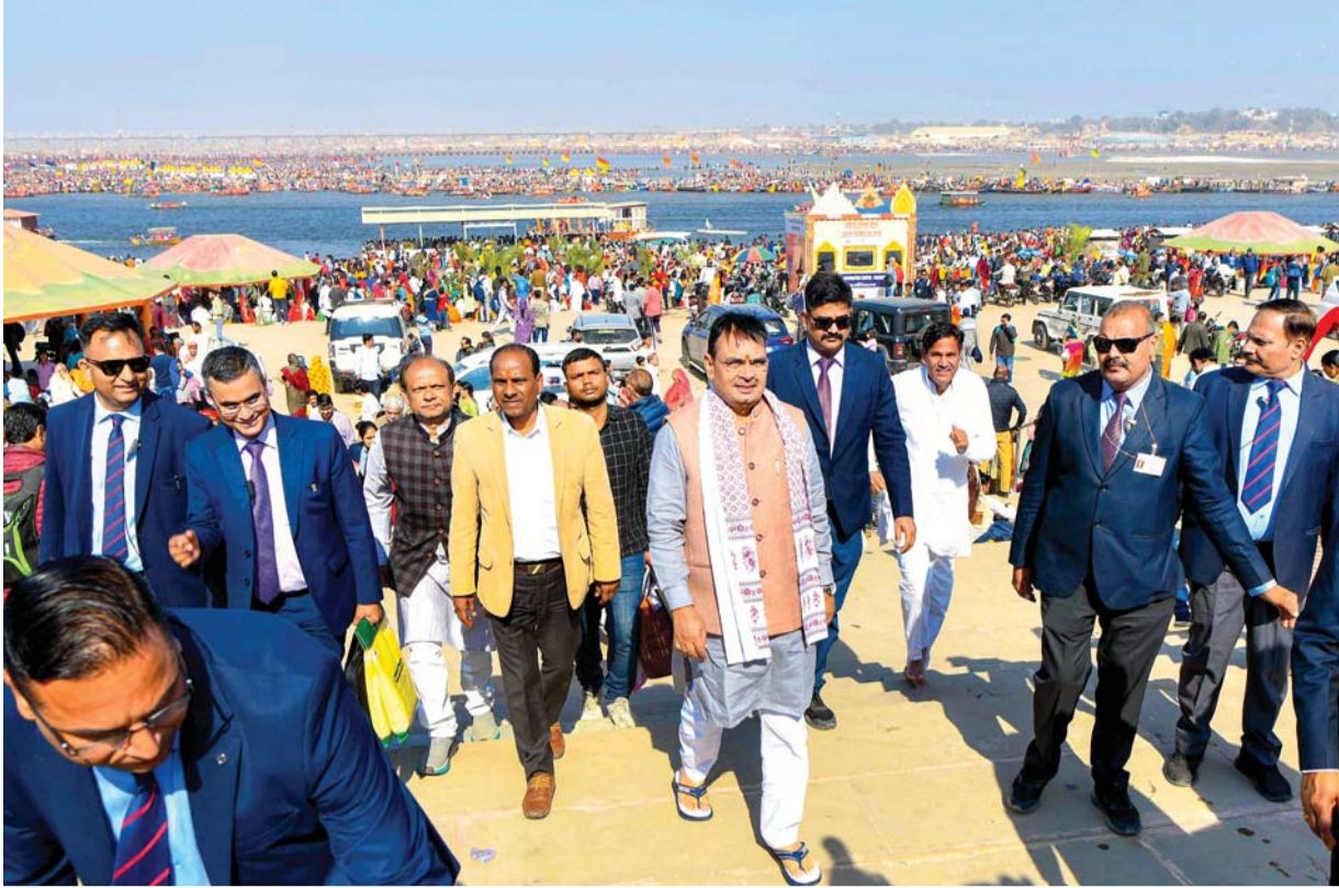
मुख्यमंत्री भजनलाल शर्मा व मंत्रिपरिषद् के सहयोगियों एवं विधायकों ने शनिवार (एकादशी) को प्रयागराज महाकुंभ में त्रिवेणी घाट संगम में स्नान किया।