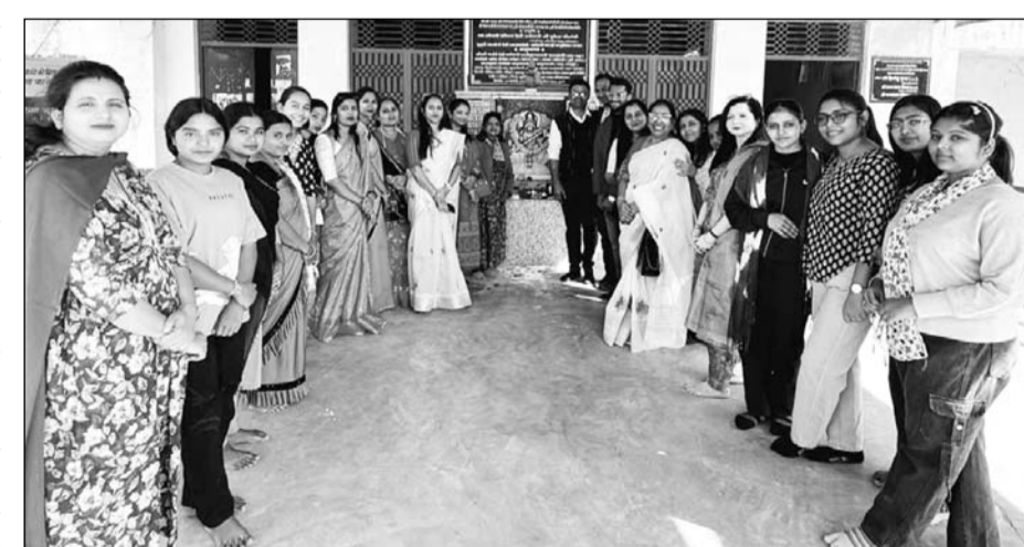
जालोर महोत्सव को लेकर सांस्कृतिक प्रतियोगिता के ऑडिशन सरस्वती वंदना करने के बाद हुए।