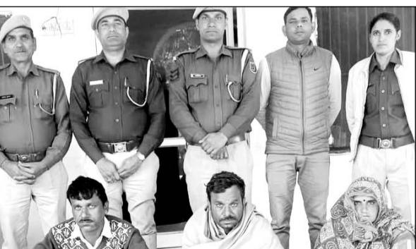
पुलिस ने मारपीट के वायरल वीडियो मामले में तीन जनों को पकड़ा।