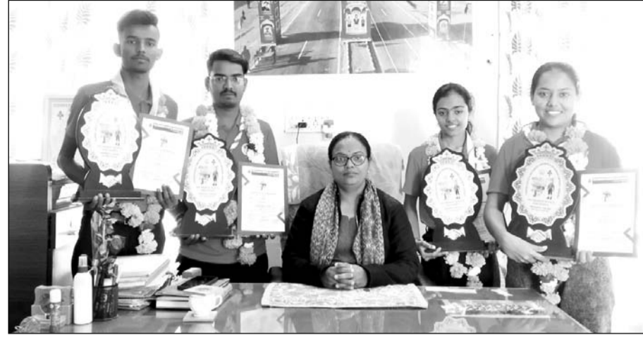
भारत स्काउट्स एवं गाइड्स के 75 वे वर्षगांठ पूर्ण होने पर डायमंड जुबली जंबूरी एवं मुथाभिज्ञ अग्निगर डॉ. कलईनगर शताब्दी जंबूरी से भाग लेकर पाली लौटे रोवर रेंजर का स्वागत किया।

पाली, (नि.सं.)। भारत स्काउट्स एवं गाइड्स के 75 वे वर्षगांठ पूर्ण होने पर डायमंड जुबली जंबूरी एवं मुथाभिज्ञ अग्निगर डॉ. कलईनगर शताब्दी जंबूरी का आयोजन सिकाट, मन्नापराई, तिरुचिरापल्ली तमिलनाडु में 28 जनवरी से 03 फरवरी 2025 तक किया, जिसमें नेशनल रोवर्स रेंजर्स सर्विस टीम में पूरे भारत के 17 राज्यों से 112 रोवर्स रेंजर्स ने सहभागिता की।