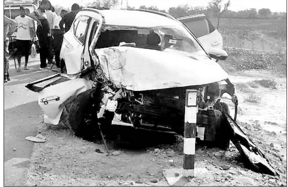
गुजरात से पंजाब जा रहे एनएचआई के क्वालिटी मैनेजर की कार ट्रक से टकराकर क्षतिग्रस्त हो गई।

हाइवे पर कसुम्बी फांटे के पास ट्रक से टकराई थी कार