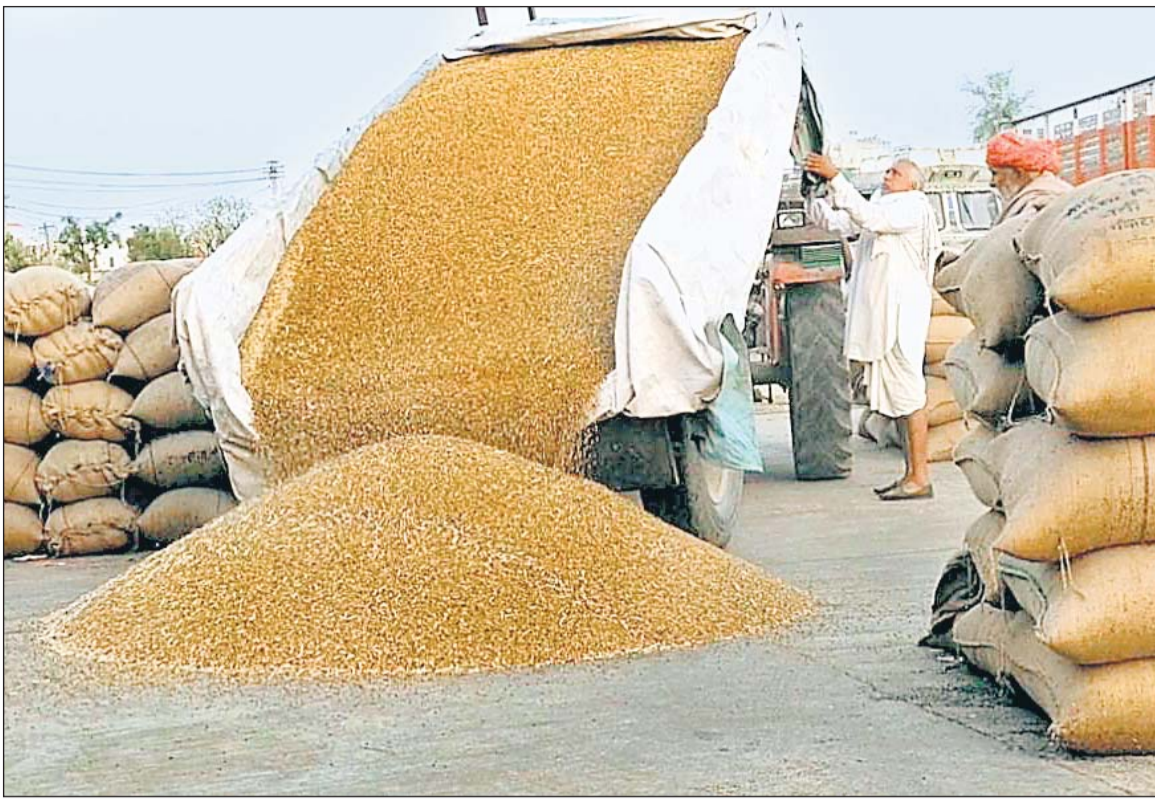
मालपुरा मंडी में चने की ट्रॉली खाली कर रहा किसान अपनी उपज सात रुपए प्रति किलो की दर से बेचने को मजबूर है।