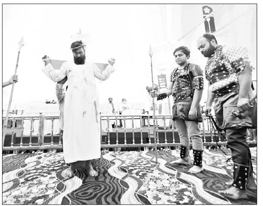
सेंट एंड्रयूज चर्च में शुक्रवार को गुड फ्राइडे मनाया गया। इस दिन प्रभु यीशु को क्रॉस पर चढ़ाया गया था जिससे उनकी मृत्यु हो गई थी। इस दौरान चर्च में विशेष प्रार्थना सभा हुई। सभा में जवानों द्वारा लघु नाट्यय से प्रभु यीशु के दुःख का चित्रण भी किया गया।