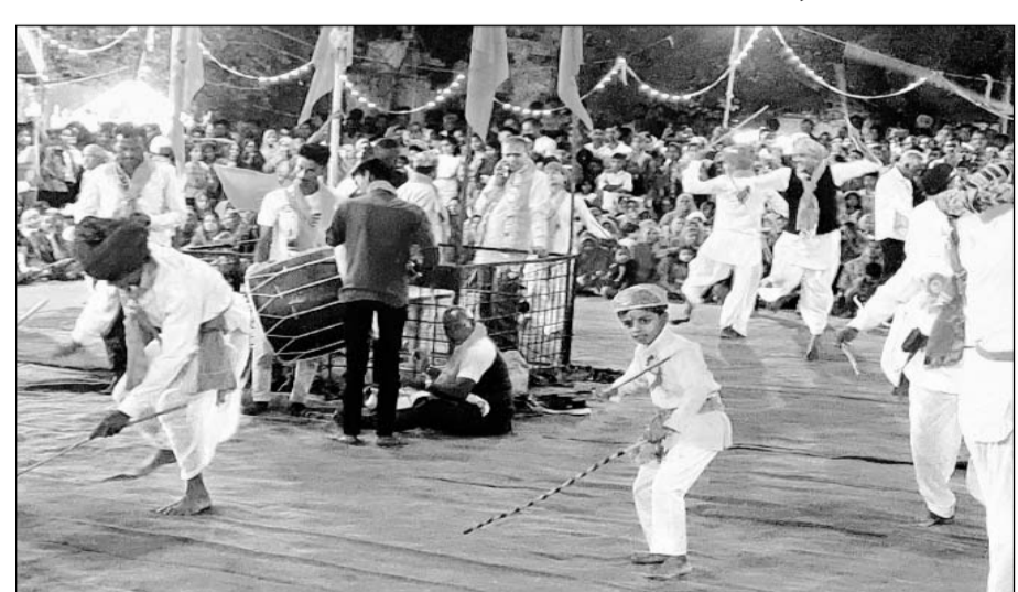
नगर के जोशिला हनुमान मंदिर प्रांगण में हनुमान जन्मोत्सव को लेकर आयोजित मेला व अन्य कार्यक्रम के तहत आयोजित गैर नृत्य देर रात तक जमा रहा।

कानोड़, (निंस्)। नगर के जोशिला हनुमान मंदिर प्रांगण में हनुमान जन्मोत्सव को लेकर आयोजित मेला व अन्य कार्यक्रम के तहत गुरुवार रात को मंदिर परिसर में आयोजित गैर नृत्य देर रात तक जमा। रूणडेडा गांव के मेनारिया समाज के लोग मेवाड की परंपरा व संस्कृति को जीवंत रूप देते हुए पारंपरिक मेवाड़ी पाड़ी सहित परिधानों में पहुंचे। यहाँ मंदिर मण्डल के पदाधिकारियों ने उनका स्वागत सम्मान किया। इसके बाद ढोल की थाप पर गैर नृत्य शुरू हुआ जो रात करीब 12 बजे तक चला। बुजुर्गों ने एक हाथ में तलवार तो दूसरे हाथ में लाठी लेकर मनमोहन