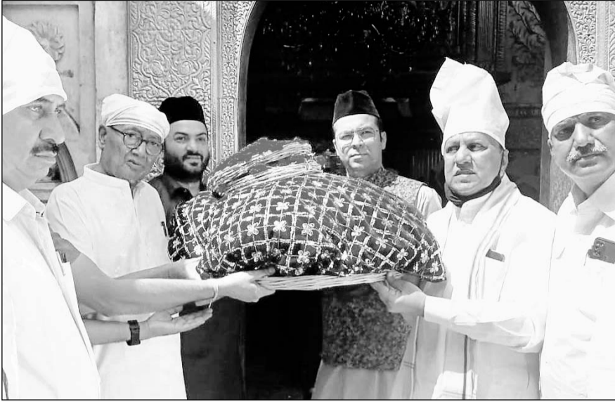
दरगाह में जियारत करने जाते हुये पूर्व सीएम दिग्विजय सिंह।

राज्यसभा सदस्य दिग्विजय सिंह एक दिवसीय अजमेर प्रवास के दौरान पत्रकारों से औपचारिक बातचीत कर रहे थे। उन्होंने कहा कि समाज में वैमनस्यता बढ़ ती जा रही है, चारों ओर धार्मिक उन्माद एवं नफरत फैलाकर सांप्रदायिक तनाव पैदा किया जा रहा है। उन्होंने केंद्र सरकार पर तंज करते हुए कहा कि बुलडोजर चलाना है तो महंगाई पर चलाओ, सामाजिक बुराई पर चलाओ बेरोजगारी पर चलाओ, राजनीतिक प्रतिद्वंद्वियों पर नहीं। उन्होंने कहा कि केंद्र की मोदी सरकार देश के विकास की बात नहीं करके धर्म राष्ट्रवाद एवं हिंदुत्व की बात कर देश की जनता को गुमराह कर रही है। उन्होंने कहा