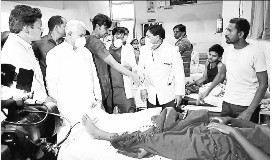
चिकित्सा मंत्री परसादीलाल मीणा ने शुकवार को एसएमएस अस्पताल का दौरा किया और व्यवस्थाओं में सुधार के निर्देश दिए।

जयपुर, (कासं)। प्रदेश के सबसे बड़े अस्पताल सवाई मानसिंह चिकित्सालय में अव्यवस्थाओं की शिकायत मुख्यमंत्री अशोक गहलोत को मिलने के बाद शुकवार को चिकित्सा मंत्री परसादीलाल मीणा ने अस्पताल का दौरा किया और व्यवस्थाओं में सुधार के निर्देश दिए। इसके साथ ही उन्होंने अस्पताल में भर्ती मरीजों को बैड पर दवा पहुंचाने की व्यवस्था लागू करने के लिए कहा। इस दौरान मरीजों की शिकायत पर चिकित्सा मंत्री ने दो वाई बॉय को मरीजों से वसूली करने पर गिरफ्तार भी करवाया।