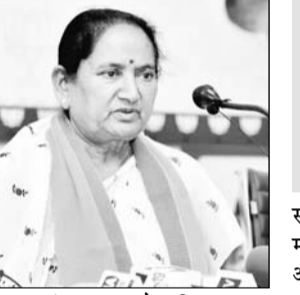
सांसद जसकौर मीणा

जयपुर। भाजपा प्रदेश मुख्यालय पर दौरा सांसद जसकौर मीणा ने प्रेस वार्ता को संबोधित करते हुए मोदी सरकार की जनजाति वर्ग के लिए चलाई जा रही योजना का लाभ एवं उपलब्धियों के बारे में बताया। मोदी सरकार दुनिया भर में कीर्तिमान स्थापित करने के साथ ही पिछले 8 वर्षों से देश के गरीब तबके विशेषकर अनुसूचित जाति, जनजाति, अन्य दलित समाज के उत्थान के लिए काम कर रही है। देश में एससी/एसटी परिवारों के लिए 3 करोड़ गैस कनेक्शन, 1 करोड़ 60 लाख पक्के घर, जल व बिजली के कनेक्शन मोदी सरकार द्वारा दिये गए साथ ही जनघन कार्यक्रमों व किसान कल्याण खाते या अन्य सभी योजनाओं का शत प्रतिशत पैसा दलित व आदिवासी लोगों के खातों में सीधा पहुंच रहा है।