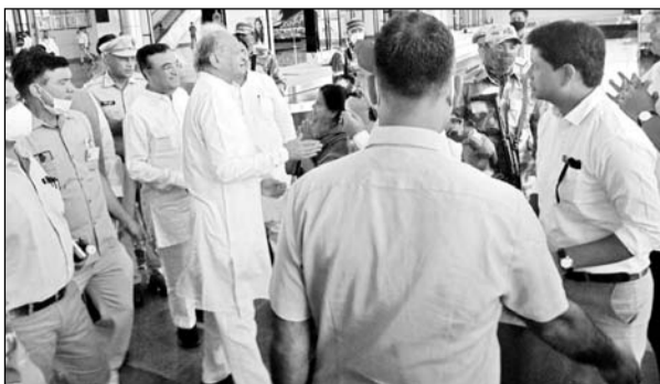
उदयपुर एयरपोर्ट पर मुख्यमंत्री अशोक गहलोत का जनप्रतिनिधियों व प्रशासनिक अधिकारियों ने स्वागत किया।

उदयपुर, (निर्स)। मुख्यमंत्री अशोक गहलोत शुक्रवार को विशेष विमान से उदयपुर के डबोक एयरपोर्ट पहुंचे। इस दौरान पूर्व केंद्रीय मंत्री अजय माकन व पूर्व कैबिनेट मंत्री गोविन्द सिंह डोटासरा भी उनके साथ थे। विमानतल पर प्रशासनिक व पुलिस अधिकारियों ने मुख्यमंत्री व अन्य अतिथियों की अगवानी की। सभागीय आयुक्त राजेन्द्र भट्ट, आईजी हिंगलाज दान, जिला कलेक्टर ताराचंद मीणा व एसपी मनोज चौधरी ने मुख्यमंत्री का स्वागत किया। यहां एयरपोर्ट परिसर में जनप्रतिनिधियों व प्रबुद्धजनों ने भी मुख्यमंत्री का उपराना, पगडी व माला इत्यादि से स्वागत किया।