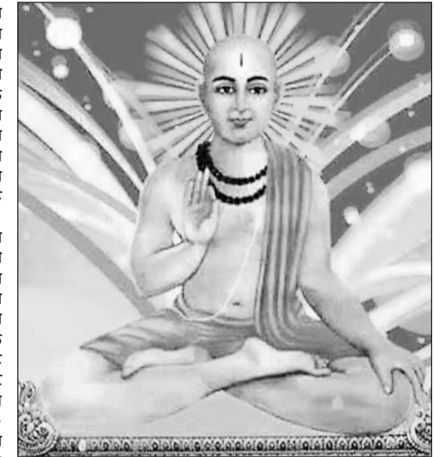
संत पीपा जी

पीपाजी महाराज का संपूर्ण जीवन चमत्कारों से भरा हुआ रहा। राजकाल में देवीय साक्षात्कार करने का चमत्कार प्रमुख है। उसके बाद संन्यास नाम में स्वर्ण द्वारिका में सात दिनों का प्रवास, पीपावाव में रणछोडराय जी की प्रतिमाओं की निकालना व अकालप्रसन्न इस में अंत क्षेत्र चलाना, सिंह को अहिंसा का उपदेश देना, लाठियों को हरे बांस में बदलना, एक ही समय में पांच विभिन्न स्थानों पर उपस्थित होना, मृत तेली की जीवन्तदा देना, सीता जी का सिंहनी के रूप में आना आदि कई चमत्कार