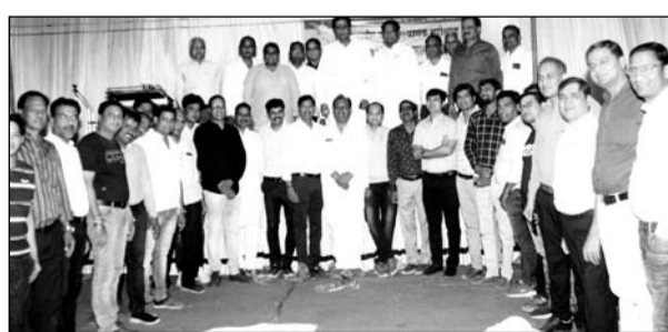
निम्बाहेड़ा में जन्म कल्याणक महोत्सव में प्रतिभाओं का सम्मान किया।