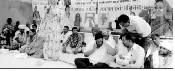
तीन दिवसीय प्रवास पर पहुंची सांसद दीया कुमारी ने लोकार्पण कार्यक्रम को संबोधित किया।

जयपुर। सांसद दीयाकुमारी ने कहा कि वो दिन गए जब गांव गरीब और किसान के नाम पर कांग्रेस द्वारा वोट मांगे जाते थे लेकिन होता कुछ नहीं था। आज पीएम मोदी ने जो कहा वो करके दिखाया है।