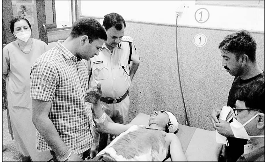
जोधपुर के मथुरादास माथुर अस्पताल में जिला कलेक्टर व एसपी ने घायलों की कुशलक्षेम पूछी।