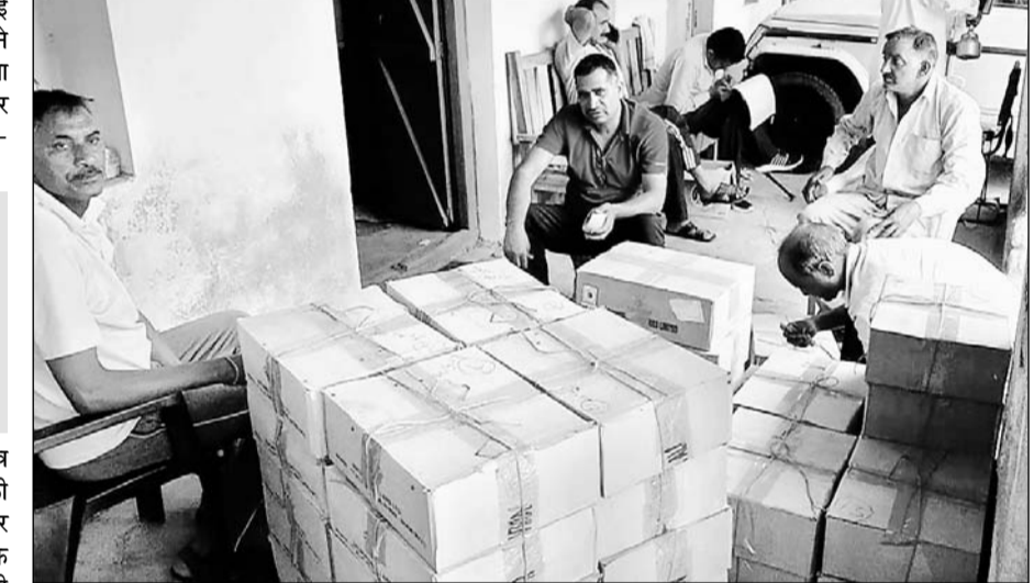
बयाना में जयपुर से आई आबकारी विभाग की स्पेशल टीम ने गेस्ट हाउस से अंग्रेजी-देशी शराब जब्त की।

यह गेस्ट हाउस पुलिस चौकी व आबकारी थाने से मात्र तीस कदम की दूरी पर है। इस कार्रवाई को लेकर और सामने बैठे संबंधित विभाग के अधिकारी- कर्मचारियों की कार्यशैली को लेकर लगे-तरेह की चर्चाएं रहें। यह शराब इस टीम ने बजरिया मार्केट स्थित गेस्ट हाउस पर उसके बगल में स्थित दो अन्य बिल्डिंग से बरामद की। कार्रवाई के समय अवैध शराब के कारोबार में लिप्त शराब माफिया मौके का लाभ उठाकर भागने में सफल रहे। आबकारी विभाग की इस छापामार