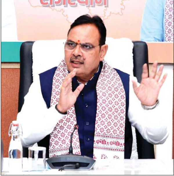
मुख्यमंत्री भजनलाल शर्मा

उन्होंने बताया कि राजस्थान में जनगणना 2027 का प्रथम चरण मई से शुरू हो रहा है। इसके तहत मकानों की सूची और गणना का कार्य 16 मई से 14 जून तक किया जाएगा। इस दौरान प्रगणक घर-घर जाकर जानकारी एकत्रित करेंगे। प्रदेशवासी आवश्यक सहयोग करते हुए मकानों की गणना से