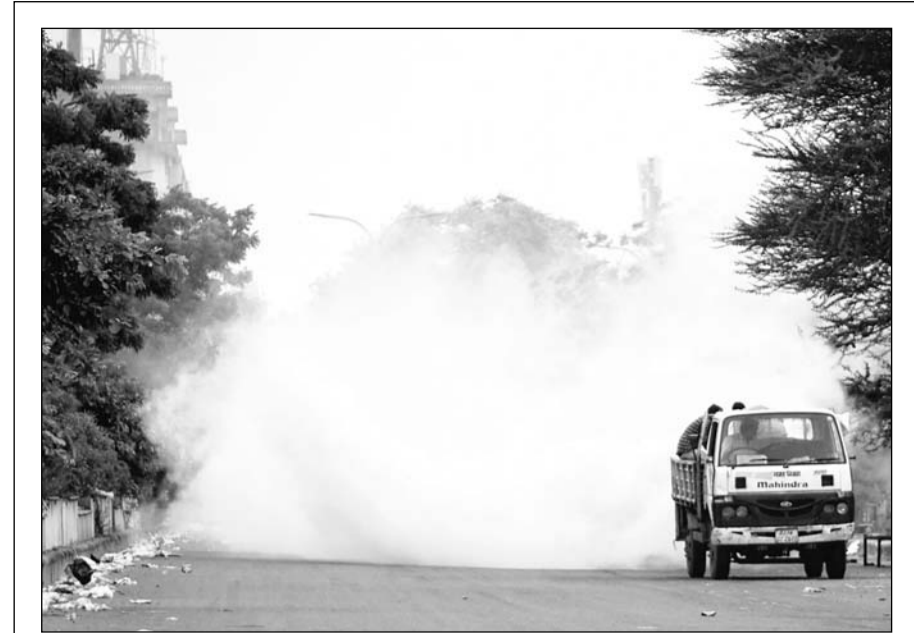
शहर में बरसात के कारण पनपे मच्छरों की वजह से मलेरिया व डेंगू की बीमारी इस समय घर-घर में पांव पसार रही है। इससे बचाव के लिये नगर निगम जगह-जगह फोगिंग करवा रहा है। शनिवार को निगम कर्मचारियों ने शहर के बाहरी इलाकों में फोगिंग की।

पहले पीएम मोदी आरोप लगाते थे कि सीबीआई कांग्रेस इन्वेस्टिगेशन ब्यूरो है। अब जितनी भी जांच एजेंसियां हैं वह मोदी इन्वेस्टिगेशन ब्यूरो हो गई हैं। विपक्षी दलों और कांग्रेस के लोगों को प्रताड़ित किया जा रहा है। उन्होंने सवाल उठाया है कि क्या भारतीय जनता पार्टी में सब दूध के घुले हुए लोग हैं। उनके यहां पर छापे क्यों नहीं डाल रहे हैं।