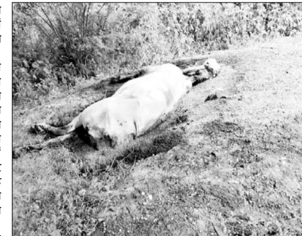
पाटन क्षेत्र में लम्पी बीमारी से मृत गायों को खुले में डाला जा रहा है।

संक्रमण से मरने वाली गायों को दफनाने के लिए सरकार द्वारा निकाली गई योजना से जो राशि मिल रही है उसका गलत तरीके से उपयोग किया जा रहा है। मृत पड़ों गायों को दफनाने की बजाय खुले में इधर-उधर फेंककर संक्रमण को खुला न्यौता दिया जा रहा है। सूत्रों से यह भी पता चला है कि पंचायत समिति के सदस्य झूठी रिपोर्ट