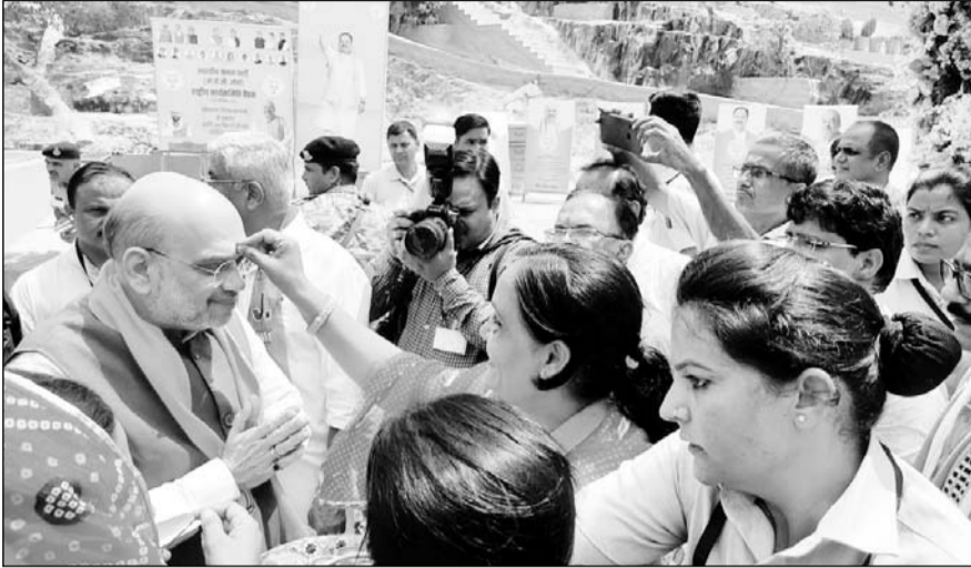
जोधपुर पहुंचने पर केन्द्रीय गृहमंत्री का तिलक लगाकर स्वागत किया गया।

शाह बोले कि सतीश पुनिया पर नाराज था कि इतनी धूप में कार्यकर्ता सम्मेलन बुलाने की क्या जरूरत थी। शाम को या सुबह बुलाते। सम्मेलन में आए मारवाड़ के सभी कार्यकर्ताओं को प्रणाम करता हूँ। जो इतनी भीषण गर्मी में भी डटे हुए हैं। वसुंधरा ने सबसे बड़ा काम 3 लाख तक मुफ्त इलाज का किया। भामाशाह योजना लागू कर हर व्यक्ति को इलाज की सुविधा