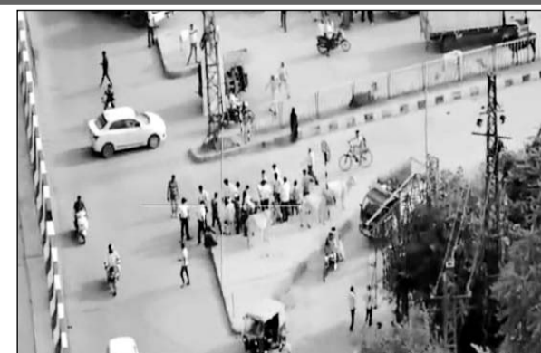
धौलपुर जिले में ड्रॉन कैमरे की मदद से लिया गया फोटो।