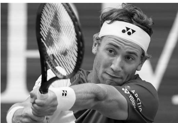
यह अद्भुत है।" तृतीय सीड अल्काराज का सामना फाइनल में नॉर्वे के पांचवीं सीड कैम्पर रूड से होगा जो कारेन खचानोव को 7-6(5), 6-2, 5-7, 6-2 से हराकर आ

न्यूयॉर्क, 10 सितंबर। स्पेन के युवा समसनी टेनिस खिलाड़ी कार्लोस अल्काराज ने सेमीफाइनल में अमेरिका के फ्रांसेस टियाफो को हराकर यूएस ओपन फाइनल में कैम्पर रूड के साथ मुकाबला सुनिश्चित किया। 19 वर्षीय अल्काराज ने शुक्रवार को चार घंटे 19 मिनट चले मैच में टियाफो को 6-7(6), 6-3, 6-1, 6-7(5), 6-3 से मात देकर अपने पहले ग्रैंड स्लैम फाइनल में जगह बनायीं। अल्काराज ओपन युग में अमेरिकी दिग्गज पीट सेम्प्रास के बाद यूएस ओपन फाइनल में पहुंचने वाले दूसरे किशोर हैं। अल्काराज ने जीत के बाद कहा, "एक ग्रैंड स्लैम के सेमीफाइनल में आपको सब कुछ झोंक देना होता है। हमें आखिरी बॉल तक लड़ना होता है। इससे फर्क नहीं पड़ता कि हम पांच घंटे लड़ रहे हैं या छह घंटे। फ्रांसेस ने कोर्ट पर अपना सब कुछ दिया।