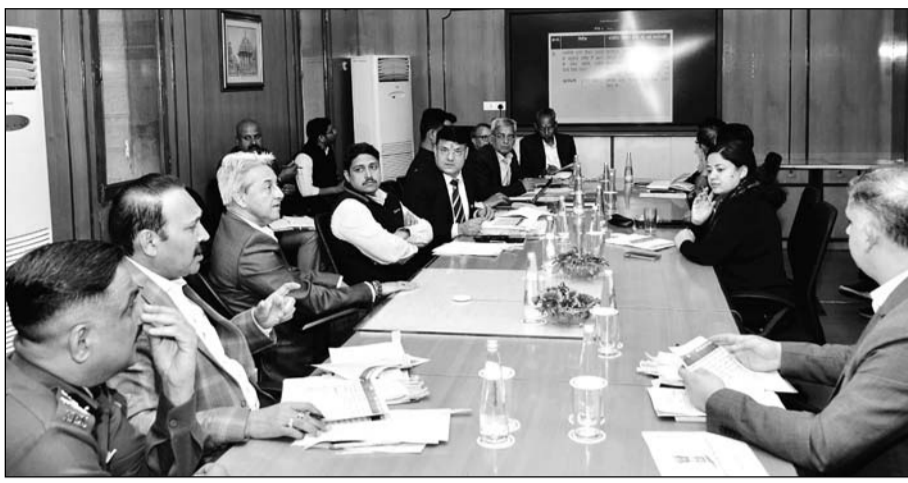
मुख्य सचिव सुधांशु पंत ने मंगलवार को शासन सचिवालय में आयोजित नार्को काॅर्डिनेशन सेन्टर तंत्र की राज्य स्तरीय कमेटी की बैठक की अध्यक्षता की।

पंत मंगलवार को शासन सचिवालय में आयोजित नार्को