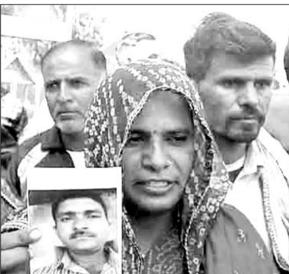
कलेक्ट्रेट पर प्रदर्शन के दौरान गुमशुदा की फोटो दिखाते हुए परिजन।

प्रशासन से न्याय की गुहार लगाने मंगलवार सुबह एसपी ऑफिस पहुंचे। परिवार के साथ आए ग्रामीणों ने कलेक्ट्रेट पर प्रदर्शन किया और पुलिस पर गंभीर आरोप लगाते हुए मांग की कि लापता युवक का पता लगाया जाए। परिवार के सदस्यों का रो-रोकर बुरा हाल है। कलेक्ट्रेट पर प्रदर्शन के दौरान युवक की मां बेहोश हो गई। परिजन व ग्रामीणों ने कहा कि युवक का खोजबीन की जाए। जिला प्रशासन के समक्ष न्याय की