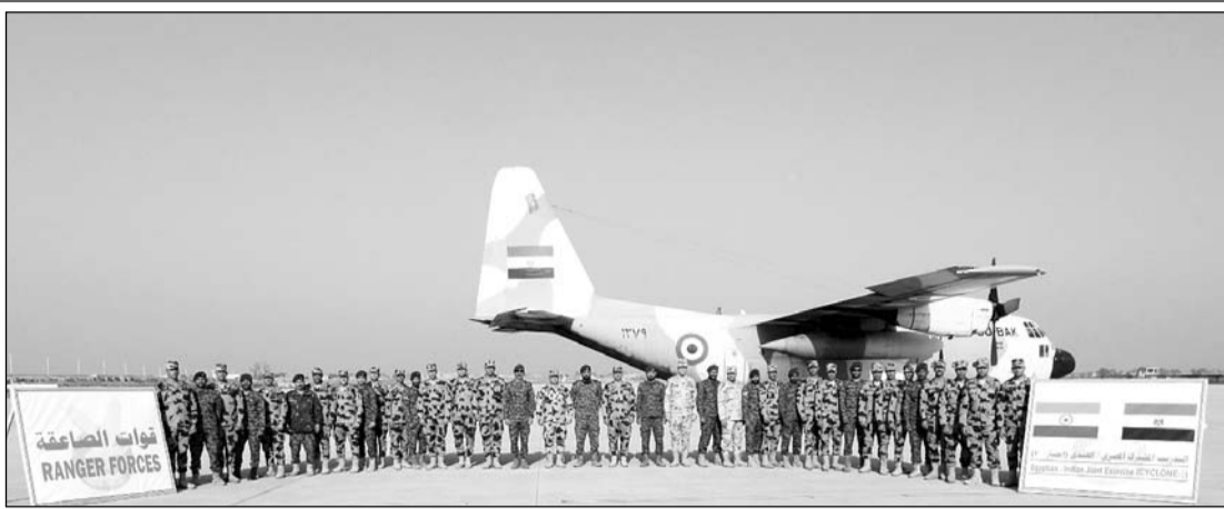
महाजन फील्ड फायरिंग रेंज में भारत और मिस्र के बीच संयुक्त युद्धाभ्यास "साइक्लोन-2025" शुरू हुआ।

"साइक्लोन-2025" का प्राथमिक उद्देश्य भारत और मिस्र के बीच रक्षा सहयोग को मजबूत करना है