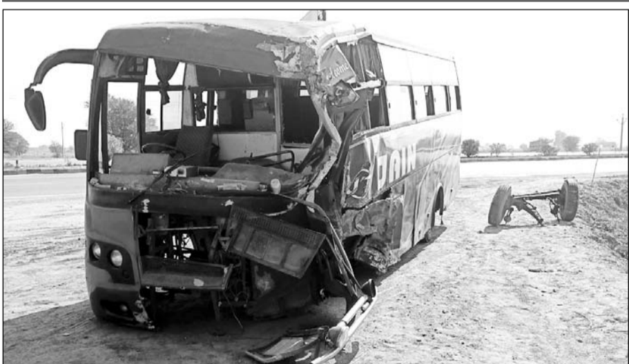
निवाई के मूंडिया बाइपास पर सोमवार देर रात को वाहनों में भिड़ंत होने के बाद क्षतिग्रस्त बस व क्षतिग्रस्त ट्रोलो।

ट्रोलो अनियंत्रित होकर निजी बस से भिड़ा, ट्रोलो बस को करीब 150 मीटर तक धकेलता ले गया