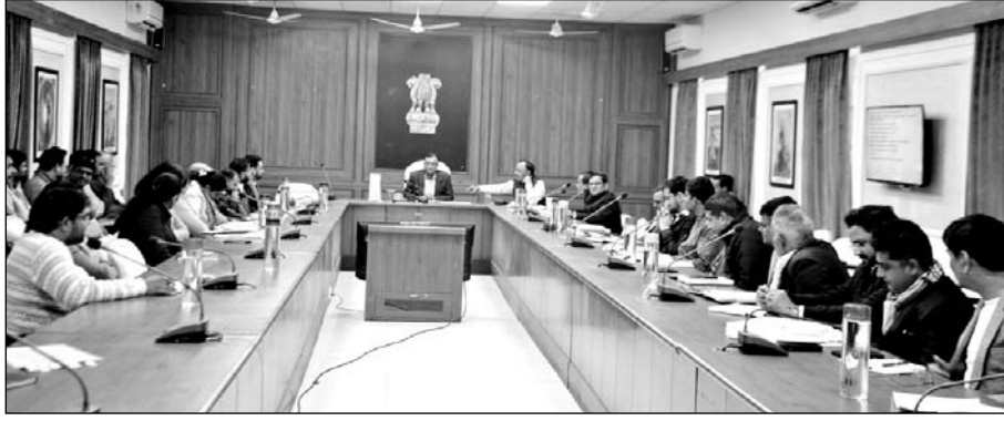
कलेक्टर मुकुल शर्मा की अध्यक्षता में राजस्व अधिकारियों की बैठक कलेक्टर सभागार में आयोजित हुई।

सीकर, (निर्स)। जिला कलेक्टर मुकुल शर्मा की अध्यक्षता में शुक्रवार को राजस्व अधिकारियों की बैठक कलेक्टर सभागार में आयोजित हुई। बैठक में जिला कलेक्टर शर्मा ने सभी अधिकारियों से राजस्व मामलों की प्रगति रिपोर्ट ली तथा संबंधित अधिकारियों को उनसे संबंधित राजस्व कार्यों को मिशन मोड पर लेकर उनका त्वरित निस्तारण करने के निर्देश दिए। इस दौरान जिला कलेक्टर शर्मा ने निर्देशित किया कि उपखंड अधिकारी एवं तहसीलदार बंटवारा एवं विभाजन करते समय रास्ते के प्रावधान का विशेष ध्यान रखें।जिला कलेक्टर शर्मा ने जिले में खुले बोरेवेल एवं ट्यूबवेल से होने वाले हादसों की रोकथाम के लिए आवश्यक कार्ययोजना बनाकर कार्य करने के निर्देश दिए। प्रधानमंत्री फसल बीमा योजना के तहत क्रांप कंटिंग की