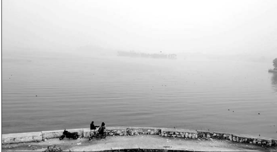
उदयपुर के फतहसागर झील के बीच स्थित नेहरू गार्डन कोहरे के बीच पूरी तरह से छुप गया।

उदयपुर, (कांस)। राजस्थान में वेस्टर्न डिस्टर्बेंस के एकित्व होने से बारिश हो रही है। प्रदेश के कई जिलों में हुई बारिश के बाद तापमान में गिरावट दर्ज की गई है। इधर लेकसिटी में भी शुक्रवार अलसुबह शुरू हुई बारिश दोपहर तक रुक-रुक कर जारी रही। सुबह सर्द मौसम की पहली बारिश (मावठ) हुई जिससे मौसम ठंडा हो गया। रात दो बजे हल्की बूंदाबांदी हुई थी। इसके बाद अल