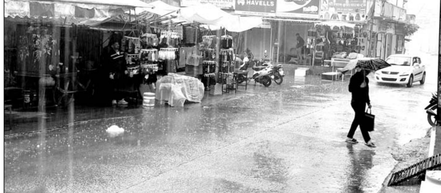
फुलेरा में दिनभर रुक-रुक कर होती बारिश के दौरान घूमते लोग।

फुलेरा, (निसं)। क्षेत्र में पिछले कुछ दिनों से नया पश्चिमी विक्षोभ के सक्रिय होने व पूर्वी हवाओं के चलने से रात के पारे में चढ़ाव व दिन के पारे गिरावट से सीजन की पहली मावठ से दिनभर सन्धी की अन्य फसलों में नुकसान की सम्भावना है। मौसम विभाग ने जिले के लिए अलर्ट जारी करते हुए ओलावृष्टि, मेघगर्जन और वज्रपात की चेतावनी जारी की थी। झुंझुनू जिले की 12 तहसीलों में 9.3 एमएम बारिश दर्ज की गई है। सर्वाधिक 13 एमएम बारिश पिलानी, बिसाऊ तथा चिड़ावा तहसील में दर्ज की गई। जबकि खेतड़ी तहसील में 10.5 एमएम बारिश दर्ज की गई है। इसके अलावा मलसीसर में तीन एमएम, उदयपुरवाटी में सात, गुड्डा में छह, बुहाना में चार, गुरुवाड़ में 11, नवलगढ़ में आठ, मंडावा में छह, झुंझुनू में नौ एमएम बारिश दर्ज की गई है।