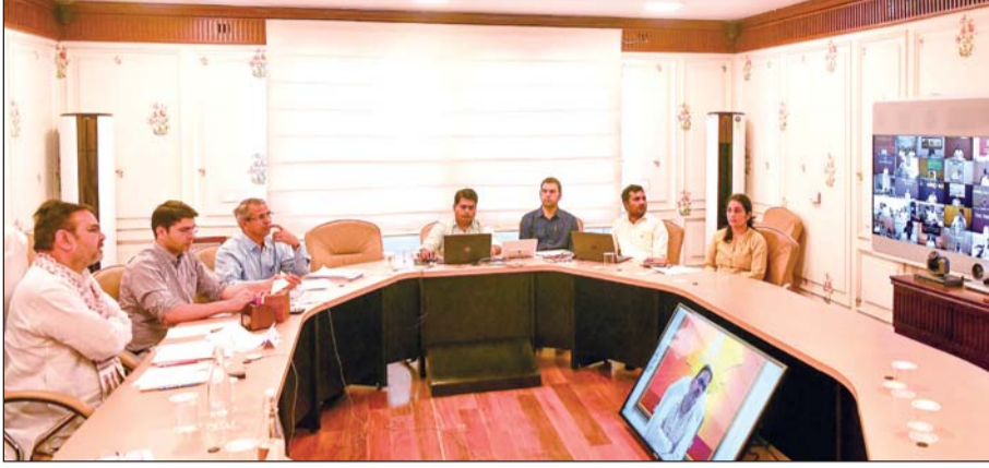
मुख्यमंत्री भजनलाल शर्मा ने शनिवार को मुख्यमंत्री कार्यालय में वीडियो कॉन्फ्रेंसिंग के माध्यम से आयोजित बैठक में एलपीजी आपूर्ति के संबंध में आवश्यक दिशा-निर्देश दिए।

■ मुख्यमंत्री भजनलाल शर्मा ने निर्देश दिए कि शिकायतों का 24 घंटे में त्वरित समाधान किया जाए तथा इसकी नियमित मॉनिटरिंग कर मुख्य सचिव स्तर पर रिपोर्ट की जाए।