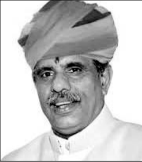
चिकित्सा मंत्री गजेन्द्र सिंह खीवसर

जयपुर। मुख्यमंत्री भजन लाल शर्मा की पहल पर राज्य सरकार ने राजस्थान गवर्नमेंट हेल्थ स्कीम (आरजीएचएस) को न केवल अधिक प्रभावी और पारदर्शी बनाया है, बल्कि इसके दायरे को काफी विस्तृत किया और भुगतान भी पहले से अधिक किया है। वर्तमान सरकार के कार्यकाल में योजना का दायरा बढ़ाने, भुगतान प्रक्रिया को नियमित करने तथा स्वास्थ्य सेवाओं की उपलब्धता को सुदृढ़ करने की दिशा में दोस कदम उठाए गए हैं। योजना के तहत पिछले दो वर्ष में 7200 करोड़ रुपए से अधिक का भुगतान अस्पताल एवं फार्मसी को किया गया है।