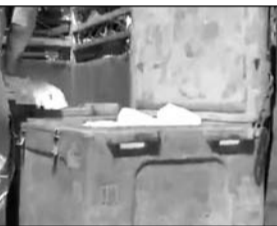
दौरान सीएमएचओ प्रथम की टीम को बुलाकर नमूने लिए गए हैं। जांच रिपोर्ट आने के बाद आरोपियों के खिलाफ सख्त कानूनी कार्रवाई की जाएगी।

जयपुर। जवाहर नगर पुलिस ने मिलावटी खाद्य पदार्थों के खिलाफ कार्रवाई करते हुए शनिवार को 700 किलो से अधिक नकली पनीर (मावा) बरामद किया। जिससे मिलावटखोरों में हड़कंप मच गया है। इस मामले में खाद्य विभाग की टीम को मौके पर बुलाकर जांच शुरू कर दी गई है।