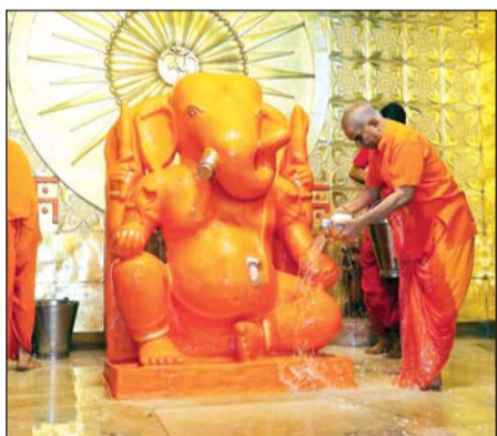
मोती डूंगरी स्थित गणेशजी मंदिर में शनिवार को पुष्य नक्षत्र में भगवान का विशेष अभिषेक और पूजा-अर्चना की गई।