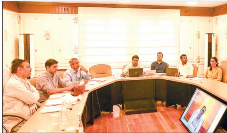
मुख्यमंत्री भजनलाल शर्मा की अध्यक्षता में शनिवार को मुख्यमंत्री कार्यालय में 'राज उन्नति' की तीसरी बैठक हुई।

बैठक में ब्रह्मगुप्त सेंटर ऑफ फ्रंटियर टेक्नोलॉजीज के तहत ब्लॉकचेन, साइबर