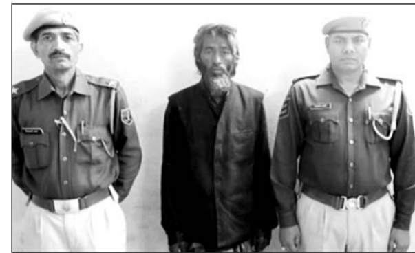
पुलिस गिरफ्त में बांग्लादेशी नागरिक।

अजमेर, (कासं)। अजमेर पुलिस की स्पेशल टास्क फोर्स द्वारा अवैध रूप से रह रहे बांग्लादेशी नागरिकों की धरपकड़ के लिए चलाए जा रहे अभियान में कार्रवाई करते हुए गुरुवार को चौथी कार्यवाही करते हुए दरगाह थाना पुलिस ने चोरी छिपे बांडर क्रॉस कर भारत में प्रवेश कर दरगाह क्षेत्र में रह रहे बांग्लादेशी को गिरफ्तार किया है।