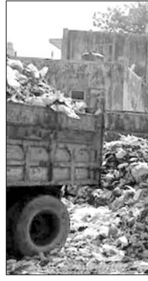
अजमेर के गंज क्षेत्र के मुख्य मार्ग पर लगा गंदगी का ढेर।

अजमेर नगर निगम व अजमेर विकास प्राधिकरण की पंचशील, हरिभाऊ उपाध्याय नगर, कोटड़ा