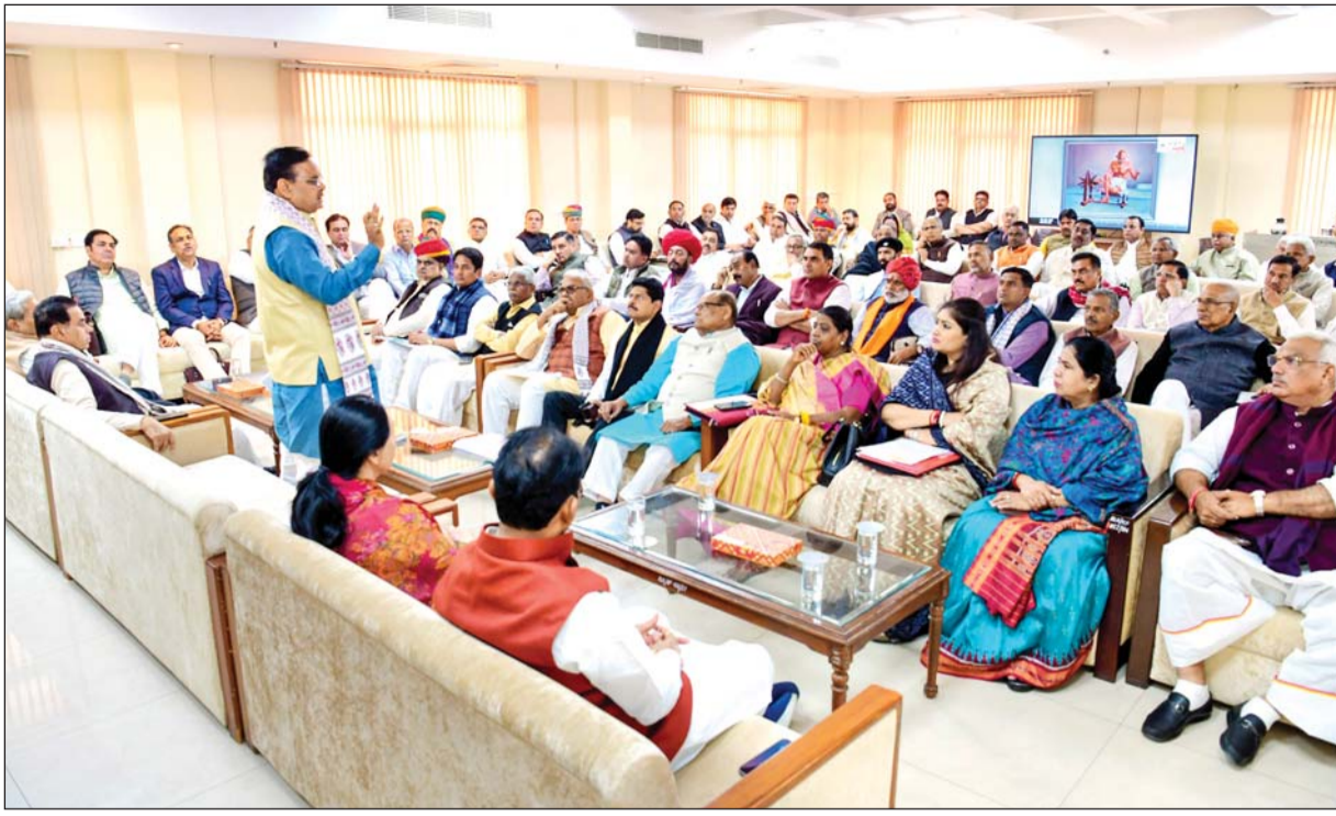
मुख्यमंत्री भजनलाल शर्मा की अध्यक्षता में विधानसभा सत्र शुरू होने से पहले भाजपा विधायक दल की बैठक हुई। बैठक में मुख्यमंत्री शर्मा ने सदन में विपक्ष के द्वारा उठाए जाने वाले मुद्दों पर सत्ता पक्ष के सदस्यों को अपडेट करने, उसके अनुरूप योजना बनाने, एकजुट होकर विपक्ष आरोपों का जवाब देने के लिये सदन में ज्यादा से ज्यादा समय मौजूद रहने के निर्देश दिए हैं।