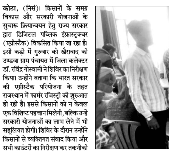
जिला कलेक्टर डॉ. रविन्द्र गोस्वामी ने किसान को पंजीयन की रसीद सौंपी।

कोटा, (निर्स)। किसानों के समय विकास और सरकारी योजनाओं के सुचारु क्रियान्वयन हेतु राज्य सरकार द्वारा डिजिटल पब्लिक इंफ्रास्ट्रक्चर (एग्रीस्टैक) विकसित किया जा रहा है। इसी कड़ी में गुर्वार को खैराबाद की उडवावा ग्राम पंचायत में जिला कलेक्टर डॉ. रविन्द्र गोस्वामी ने शिविर का निरीक्षण किया। उन्होंने बताया कि भारत सरकार की एग्रीस्टैक परियोजना के तहत राजस्थान में फार्मर रजिस्ट्री की शुरुआत हो रही है। इससे किसानों को न केवल एक विशिष्ट पहचान मिलेगी, बल्कि उन्हें सरकारी योजनाओं का लाभ लेने में भी सहायित होगा। शिविर के दौरान उन्होंने किसानों से व्यक्तिगत संवाद किया और सभी काउंटरों का निरीक्षण कर तकनीकी समस्याओं को दूर करने के लिए निर्देशित किया। उन्होंने किसानों को अपने हाथों से रजिस्ट्री आईडी पत्र सौंप कर शुभकामनाएं दीं।