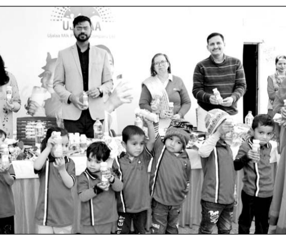
आंगनवाड़ी बच्चों के लिए गिफ्ट मिल्क कार्यक्रम शुरू किया गया।

गुर्वार को यह पहल उजाला मिल्क प्रोड्यूसर कंपनी लिमिटेड द्वारा राष्ट्रीय डेजरी विकास बोर्ड (एनडीडीबी) फाउंडेशन फॉर न्यूट्रिशन के सहयोग से शुरू की गई। कार्यक्रम का आयोजन अरंडखेड़ा स्थित बालापुरा आंगनवाड़ी केंद्र में किया गया। इस अवसर पर कोटा विकास प्राधिकरण के अतिरिक्त आयुक्त नयन गौतम ने कहा कि यह पहल बच्चों के शारीरिक और मानसिक विकास में सहायक होगी और कुपोषण को दूर करने में प्रभावी भूमिका निभाएगी। उन्होंने मंत्रित किया और पलेवॉर्ड मिल्क विमरित बच्चों को उजाला एमपीसीएल तथा एनडीडीबी फाउंडेशन को इस महत्वपूर्ण प्रयास के लिए बधाई दी। कार्यक्रम में