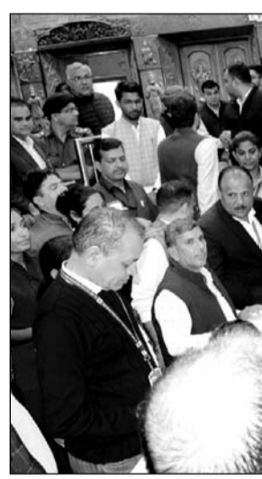
छत्तीसगढ़ के राज्यपाल रमन डेका ने सालासर बालाजी के दर्शन किये।

■ राज्यपाल डेका ने पूजा कर देश-प्रदेश में खुशहाली की कामना की