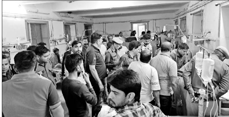
घायल युवक को अस्पताल में ले जाया गया, इस दौरान पुलिस जाप्ता तैनात रहा।

धौलपुर, (निस)। लाल बाजार धौलपुर में शनिवार रात की रात मामूली विवाद में एक युवक को गोली मार दी। जो उसके पेट में लगी। जिससे युवक गंभीर रूप से घायल हो गया। जिसे पुलिस की मदद से जिला अस्पताल धौलपुर लाया गया। जहां युवक की हालत गंभीर होने पर डॉक्टरों ने उपचार के लिए हायर सेंटर रेफर कर दिया गया। वहीं युवक को गोली मारने वाले आरोपी की तलाश में पुलिस ने रात को ही उसके छिपे होने के सम्भावित ठिकानों पर छापाकार कार्रवाई की। लेकिन आरोपी का कोई पता नहीं चला।