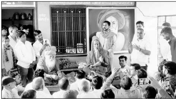
चातुर्मास आयोजन को लेकर सर्वसमाज की बैठक आयोजित हुई।