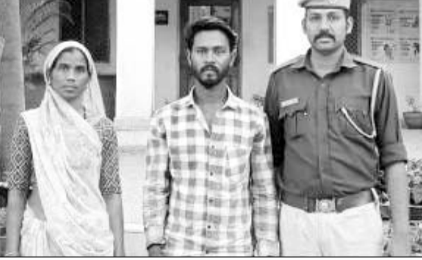
पुलिस की गिरफ्त में अपहरण कर जानलेवा हमला करने के आरोपी।