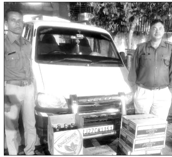
आवकरी निरोधक दल ने अवैध शराब जप्त की।

आवकरी आयुक्त के निर्देशानुसार विशेष निरोधात्मक अभियान के तहत आवकरी निरोधक दल शहर व ग्रामीण द्वारा मुखबिर की सूचना के आधार पर गश्त व दबिष के तहत एक कार से 6 कार्टन में 288 आरएमएल देशी शराब एवं 18 बीयर बोटल राज्य में विक्री योग्य बिना परमिट बरामद किया। अभियुक्त भागने में सफल रहा, फरार अभियुक्त के विरुद्ध नियमानुसार अभियोग दर्ज किया गया। इसी क्रम में आवकरी थाना उदयपुर शहर के अन्तर्गत रेलवे स्टेशन उदयपुर में रेल के साधारण श्रेणी के डिब्बे से एक प्लास्टिक बेग में रखे हुए 96 प्ले अंग्रेजी शराब सेल फॉर मध्यप्रदेश लावारिस अवस्था में बरामद किये। इस संबंध में नियमानुसार