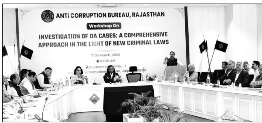
भ्रष्टाचार निरोधक ब्यूरो की ओर से गुरूवार को जयपुर स्थित राजस्थान इंटरनेशनल सेंटर में ‘इन्वेस्टिगेशन ऑफ डी ए केसेस : ए कंभ्रेंसिव एप्रोच इन दी लाइट ऑफ न्यू क्रिमिनल लॉज” विषय पर कार्यशाला का आयोजन किया गया।