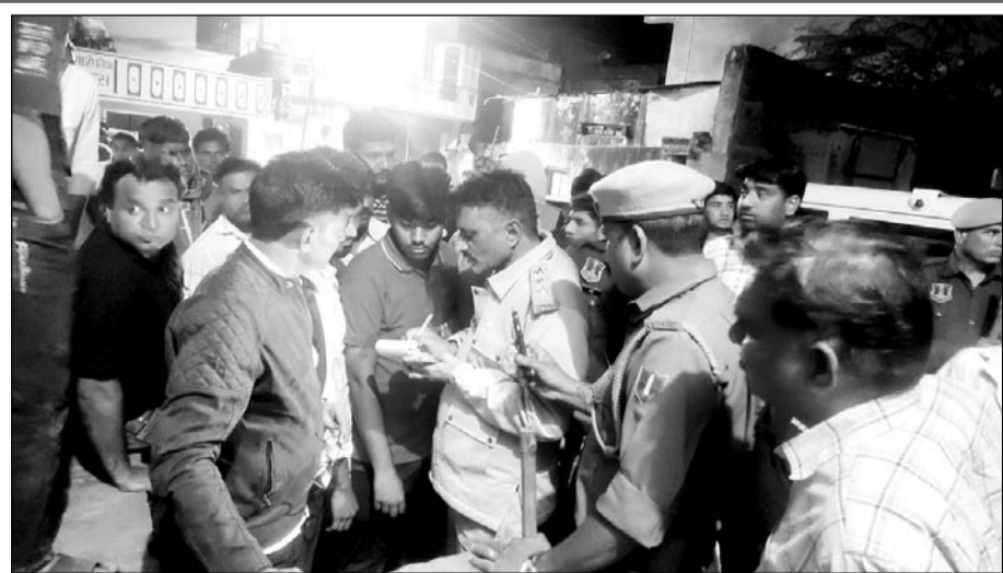
पुलिस ने मौके पर जाकर लोगों से समझाइस की।

जानकारी के मुताबिक, समुदाय विशेष के कुछ युवकों द्वारा मोहल्ले में उत्पात मचाने पर दूसरे समुदाय के लोगों ने आपत्ति जताई। इसी दौरान दोनों पक्षों में कहासुनी हुई, जो बढ़ते-बढ़ते झगड़े में बदल गई। विवाद बढ़ने पर समुदाय विशेष के 40-50 लोगों वहां पहुंचे और दूसरे पक्ष के लोगों के साथ मारपीट शुरू