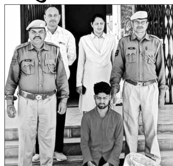
सांभर पुलिस ने चोरी के मामले में युवक को गिरफ्तार किया।