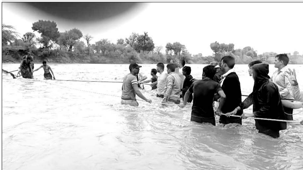
पाली जिले में एनडीआरएफ, एसडीआरएफ व ग्रामीणों की मदद से लोगों को रेस्क्यू किया।

सुमेरपुर में 367 मिमी, रानी में 349, देसूरी में 345 और बाली में 338 मिमी बारिश दर्ज