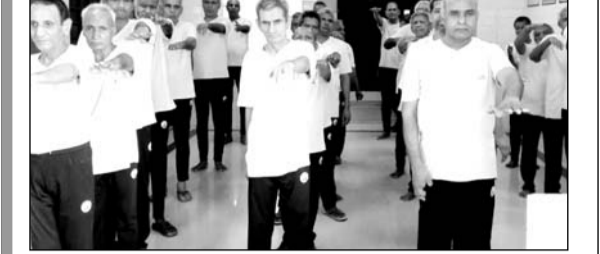
फादर्स डे पर वृद्धाश्रम में वरिष्ठजनों ने मतदान की शपथ ली।