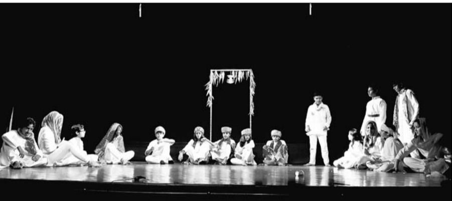
जवाहर कला केन्द्र में रविवार को रंगायन मंच पर प्रतिभागी बच्चों द्वारा तैयार 12 नाटकों का मंचन किया गया।