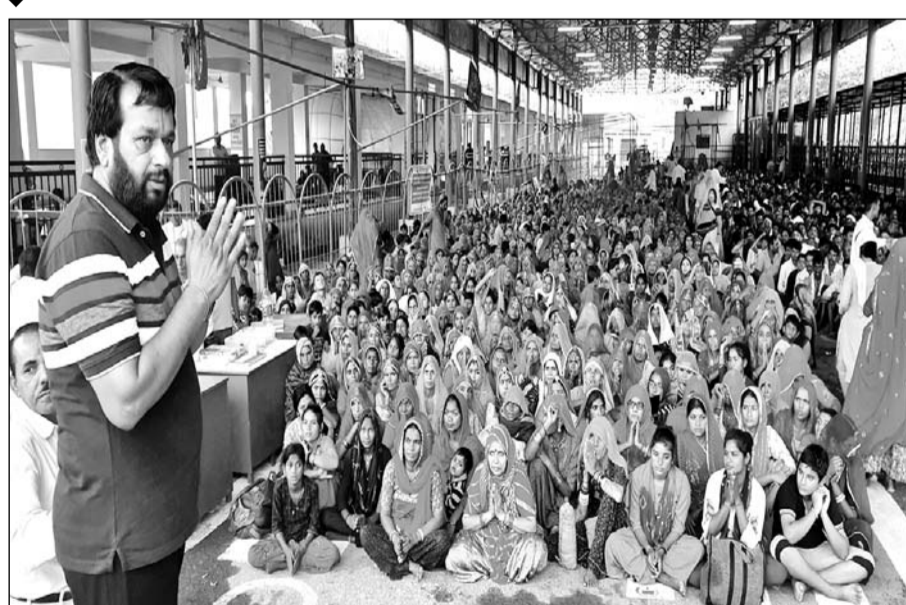
अजमेर जिले के श्री मसाणिया भैरव धाम राजगढ़ पर रविवार को श्रद्धालुओं की भीड़ उमड़ी।

ली है। सरपंच संघ के सदस्य, जनप्रतिनिधि, भैरव भक्त मण्डल के सदस्य नसीरबाद से राजगढ़ धाम तक डी.जे. ढोल नगाड़ों के साथ विशाल वाहन रैली निकालेंगे। धाम पर हजारों श्रद्धालुओं ने सर्वधर्म मनोकामनापूर्ण स्तम्भ की परिक्रमा कर चमत्कारी चिमटी लेने के पश्चात मुख्य स्थान चक्की वाले बाबा के मंदिर पर राजा रानी कल्पवृक्ष के भी परिक्रमा की।