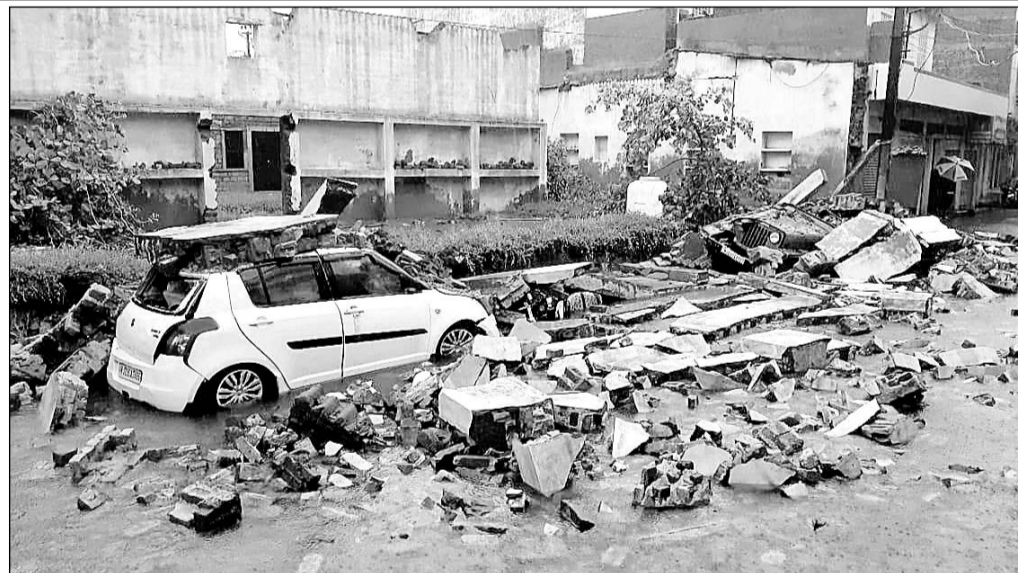
पाली शहर में जंगी बड़ा के निकट फैक्ट्री की कच्ची दीवार गिरने से कई वाहन दब गए।

जिससे पाली के हेमावास बांध में भी पानी आना शुरू हो गया। जिले में कई जगह पर सैकड़ों पेड़ व विद्युत पोल गिर गए जिससे पाली शहर में भी 18 घंटे लाइट बंद रही। रविवार शाम 6 बजे विद्युत सप्लाई की गई। पाली शहर में जंगी बड़ा के निकट एक फैक्ट्री की कच्ची दीवार गिरने से एक कार व हार पांच वाहन क्षतिग्रस्त हो गए। शहर के नगर