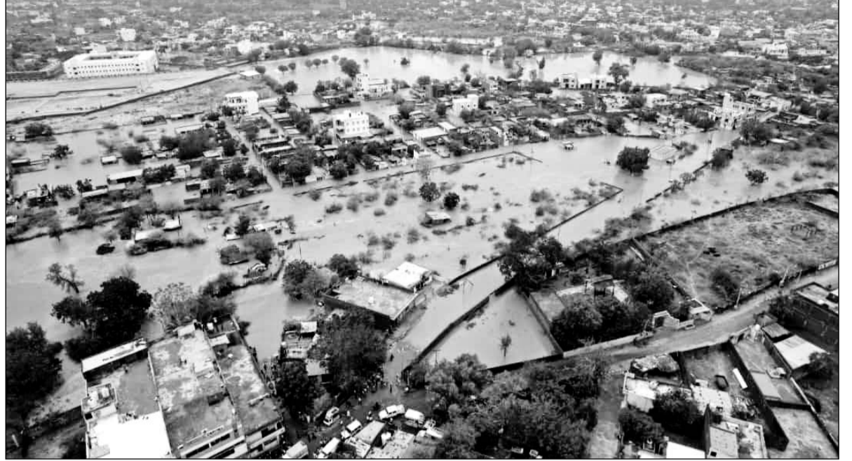
जोधपुर में हो रही बारिश के चलते शहर में हर जगह पानी भरा हुआ नजर आया।

जोधपुर, (कास)। बिपरजाय चक्रवाती तूफान के कारण जोधपुर शहर में पिछले तीन दिनों से बारिश अस्त-व्यस्त हो गयी है। कई सड़कें तालाब बन चुकी हैं। जोधपुर शहर में शुरुआत को शुरु हुई बरसात शनिवार को पूरे दिन व पूरी रात चलती रही। रविवार को भी यह क्रम जारी रहा। पिछले 36 घंटे से भी ज्यादा समय से लगातार कहीं भीमो तो कहीं तेज बारिश का दौर जारी है। लगातार कई घंटों से जारी बारिश के कारण आज कई व्यापारियों ने अपने प्रतिष्ठान बंद रखे। रविवार के अवरुद्ध के चलते सरकारी विभाग पहले से ही बंद हैं। शहर के बाजार में दुकानें बंद थीं। बाड़मेर और सिरोही जिले के कुछ हिस्सों में तबाही मचाने के बाद यह तूफान की रफ्तार जोधपुर पहुंचते-पहुंचते धीमी हो गई है। तूफान से ज्यादा बारिश ने अपना असर दिखाया है। जोधपुर शहर में पिछले 48 घंटों से रुक-रुककर हो रही बारिश के कारण प्रमुख सड़कों पर कई फीट तक पानी भर गया है।