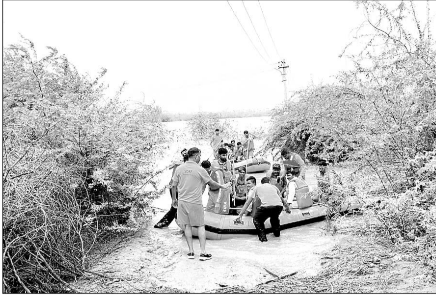
जालोर के भीनमाल में बाढ़ में फंसे लोगों को एनडीआरएफ व एसडीआरएफ की टीम ने निकाला।

जालोर, (कास)। जालोर में बीपरजाय चक्रवाती तूफान से जालोर जिले में बाढ़ के हालात बने हुये हैं। वहीं मूसलाधार बारिश से जिले के नदी-नाले पूरे उफान पर हैं। जालोर जिले से अन्य जिलों का आवागमन अवरुद्ध हो गया। जालोर में बाढ़ के हालात बनने से रेलवे व बस सेवा पूर्णता बंद है। एनडीआरएफ व एसडीआरएफकी टीम सहित सहीत पूरा प्रशासनिक अमला बाढ़ बचाव राहत कार्य में लगा हुआ है। जालोर में गत दो दिन से बीपरजाय चक्रवाती तूफान के चलते