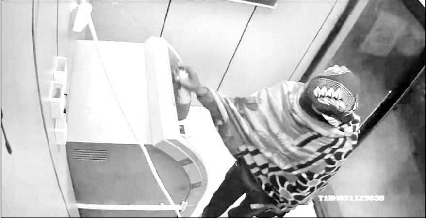
एसबीआई बैंक के एटीएम में हुई लूट की वारदात सीसीटीवी में कैद हो गई।

जानकारी के अनुसार शनिवार सुबह करीब तीन बजकर 39 मिनट पर पुलिस को एटीएम की सिक्वैरिटी कर रही कंपनी के प्रतिनिधि ने फोन पर सूचना दी कि उनके रोड नंबर तीन पर स्थित एबीआई बैंक के एटीएम के साथ बदमाशों ने छेड़छाड़ की है। पुलिस तुरंत मौके पर पहुंची। तब तक बदमाश अपना काम निपटाकर जा चुके थे। पुलिस ने एटीएम के सीसीटीवी कैमरे खंगाले तो उसमें एक नकाबपोश युवक कैमरों पर स्प्रे करता हुआ नजर आ रहा है। प्रारंभिक जानकारी के अनुसार यह वारदात रात को करीब तीन बजकर 11 मिनट के आस-पास हुई है। बदमाशों ने सबसे पहले एटीएम के कैमरों पर स्प्रे किया। इसके बाद गैस कटर से एटीएम को काटा और कैश ट्रे को अपने साथ ले गए। पुलिस ने इलाके के सीसीटीवी कैमरे खंगाले तो उसमें एक सफेद रंग की संदिग्ध कार दिखाई दे रही है। पुलिस सभी सीसीटीवी कैमरों को खंगालकर आरोपियों तक पहुंचने