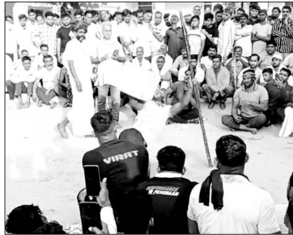
नाल दंगल में जोर अजमाइश करते पहलवान।

हेमराज चूली 102 किलो की नाल उठाकर नाल केसरी बने