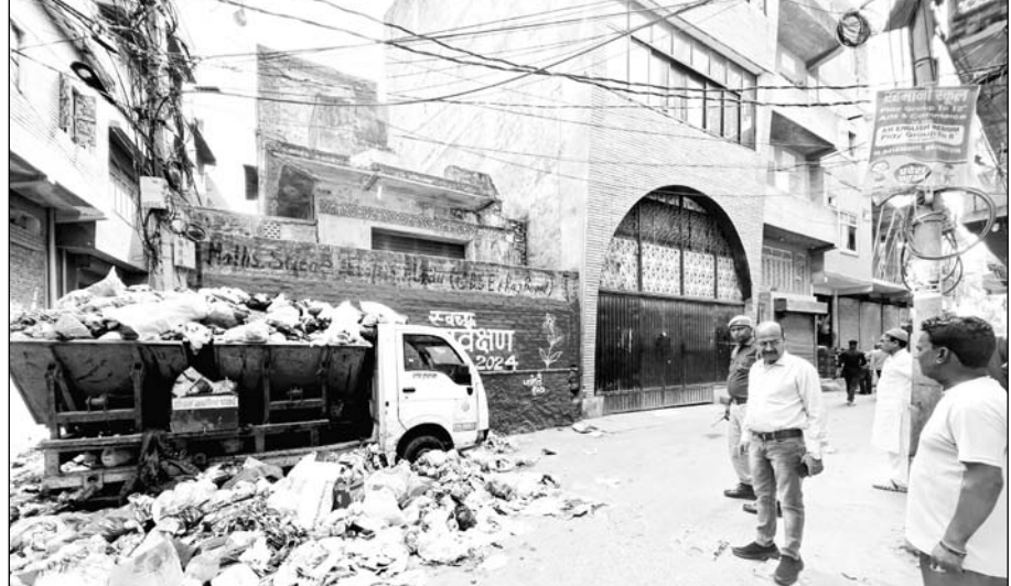
स्वच्छ सर्वेक्षण 2024 में उत्कृष्ट प्रदर्शन सुनिश्चित करने के लिए धुलंडी के दूसरे दिन निगम आयुक्त के निर्देश पर जोन उपायुक्त ने क्षेत्र में दौरा कर सफाई व्यवस्था का जायजा लिया।

जयपुर। स्वच्छ सर्वेक्षण 2024 में उत्कृष्ट प्रदर्शन सुनिश्चित करने के लिए हेरिटेज निगम के सभी अधिकारी लगातार फील्ड में सक्रिय नजर आ रहे हैं। धुलंडी के दूसरे दिन निगम आयुक्त अरुण हसीजा के निर्देश पर जोन उपायुक्त ने क्षेत्र में दौरा कर सफाई व्यवस्था का जायजा लिया। इस दौरान जिन वार्डों में पिछले कई समय से कचरा नहीं उठाने की शिकायत आ रही थी, उन वार्डों में जाकर सफाई व्यवस्था सुदृढ़ कराई। साथ ही सड़क पर कचरा फेंकने वालों के खिलाफ कार्रवाई भी की। आयुक्त अरुण हसीजा ने बताया कि स्वच्छता सर्वेक्षण को लेकर अधिकारी लगातार फील्ड निरीक्षण कर रहे हैं। सभी मुख्य स्वास्थ्य निरीक्षक और स्वास्थ्य निरीक्षक को भी वार्डों में सफाई रखने के लिए पाबंद किया है। कुछ जगहों पर सफाई होने के बाद आमजन कचरा फेंक रहे हैं। उन्हें चिन्हित कर कार्रवाई के लिए निर्देश दिए। स्वच्छता सर्वेक्षण के दौरान निगम अधिकारी सड़क पर स्वच्छता को लेकर लगातार वांच रखेंगे। उन्होंने बताया कि निरीक्षण स्वच्छ सर्वेक्षण 2024 में बेहतरीन प्रदर्शन के