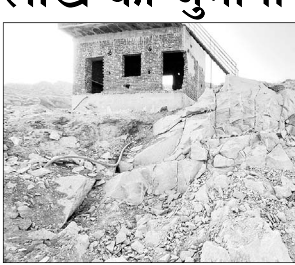
मौके पर अवैध कब्जे के तहत एक पक्का कमरा बना हुआ पाया गया।

कार्रवाई में 780 टन मैसनेरी स्टोन का अवैध उत्खनन पाया गया। वहीं 2,93,000 रुपये की पेनल्टी आरोपित की गई। वहीं अवैध कब्जे के तहत एक पक्का कमरा बना हुआ पाया गया और सरकारी भूमि पर अतिक्रमण की सूचना तहसीलदार रायपुर को दी गई। खनिज विभाग द्वारा प्रकरण बनाकर