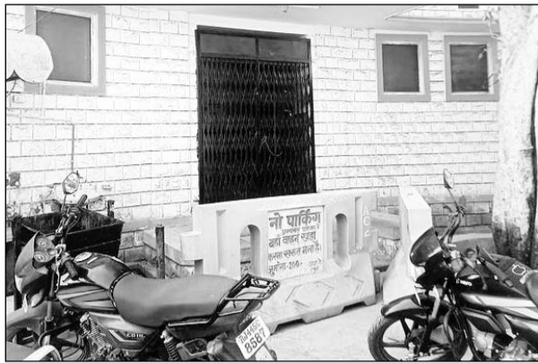
अस्पताल से इन्द्रा रसोई की तरफ जाने वाला गेट भी बंद है।

रसोई के सामने वाला प्रवेश द्वार खोला जाए वही अस्पताल में सुबह से दोनो मुख्य प्रवेश द्वार बंद होने से लोगों की भारी भीड़ व गहमागहमी अस्पताल की गैलरी में देखने को मिली। अस्पताल में भर्ती मरीजों से मिलने आने वाले परिजनों ने बताया कि अस्पताल के 2 मुख्य प्रवेश द्वार बंद कर देने से उन्हें घूम कर अस्पताल में प्रवेश करना पड़