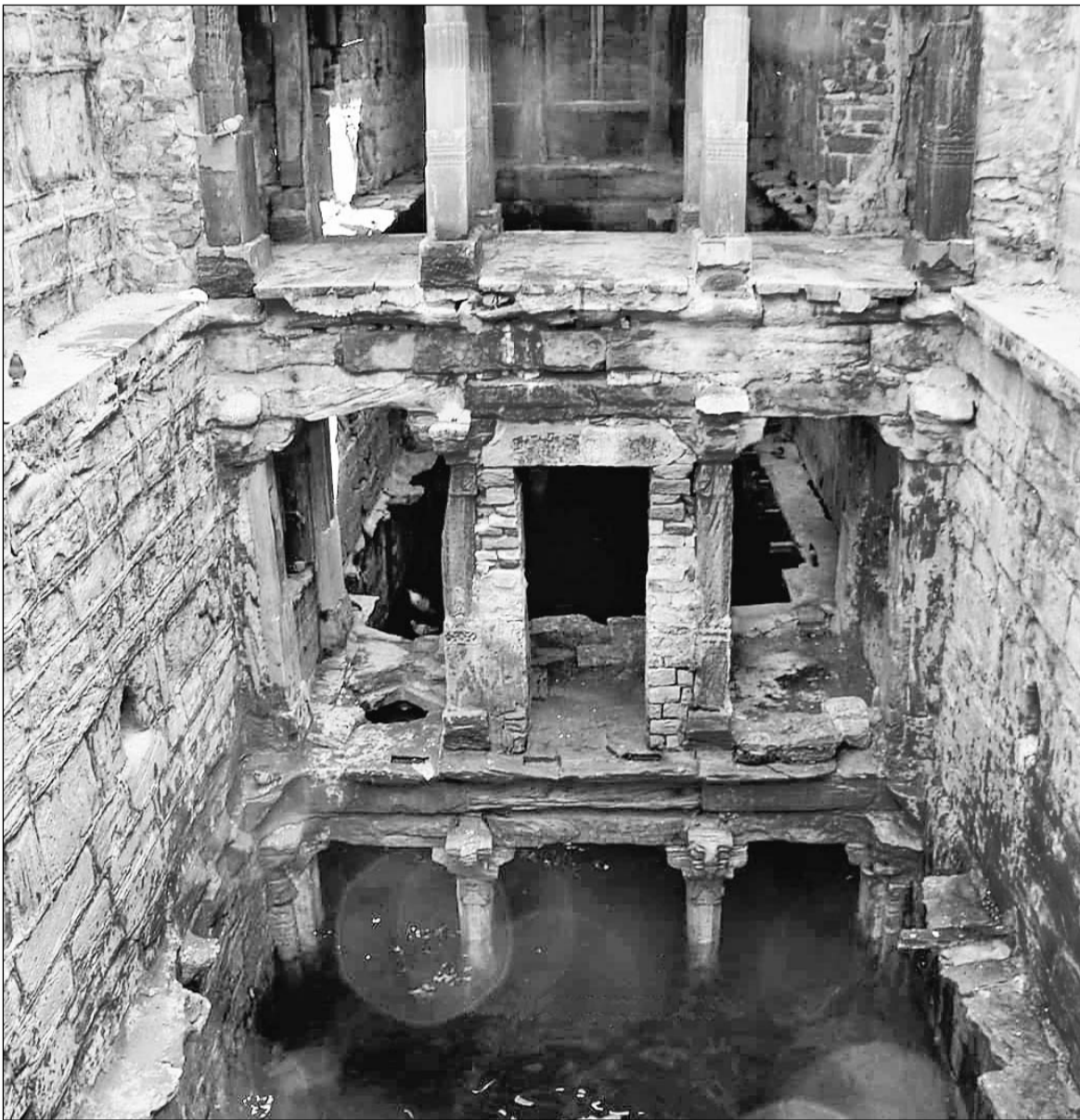
जोधपुर की 403 वर्ष पुरानी प्रसिद्ध तापी बावड़ी को फिर से संवारा जायेगा। केन्द्रीय मंत्री गजेन्द्र सिंह शेखावत ने कहा कि, "हमारी, पूरे देश में जलीय स्रोतों की धरोहरों को संवारने-संजोने की योजना है और इसकी शुरुआत जोधपुर शहर की ऐतिहासिक बावड़ी से की जा रही है।"