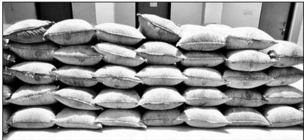
सदर थाना पुलिस ने डोडा-चूरा को जब्त किया।

इस दौरान सिद्वंबदी की तरफ से एक ट्रैलर को रोकना का इशारा किया। इस दौरान ट्रैलर चालक पुलिस को देखकर ने ट्रैलर को चित्तौड़गढ़ की तरफ भागने लगा। ट्रैलर संतुल्य प्रतीत होने से तत्काल उक्त ट्रैलर के आगे गाड़ी लगा ट्रैलर को