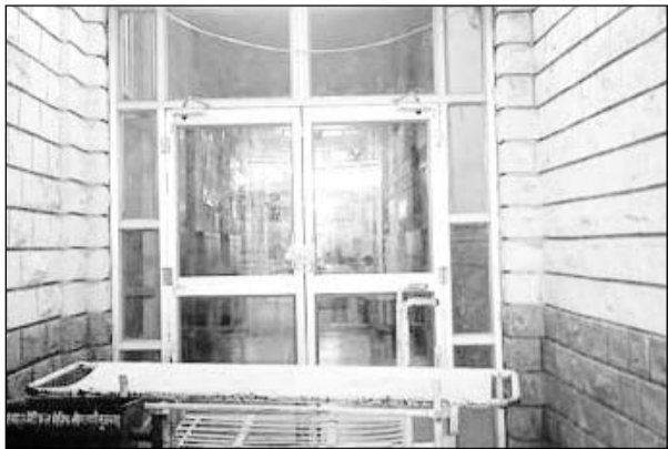
बंद किया गया अस्पताल का मुख्य प्रवेश द्वार।