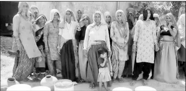
हमीरवास में पेयजल की किल्लत को लेकर महिलाएं व पुरुषों ने प्रशासन के खिलाफ विरोध जताया।

सिंचाना, (निर्स)। झुंझुनूं के सिंचाना के समीप थली ग्राम पंचायत के हमीरवास में गर्मी के मौसम में पेयजल समस्या विकराल रूप ले रही है। गांव में तीन पानी की टंकियां बनी हुई हैं। लेकिन पिछले तीन चार दिन से तीनों टंकियां पानी के अभाव में खाली पड़ी हैं। पेयजल की किल्लत को लेकर महिलाएं व पुरुषों ने प्रशासन के खिलाफ विरोध जताया। ग्रामीणों ने बताया कि पेयजल की किल्लत को लेकर पंचायत व संबंधित विभाग के अधिकारियों को कई बार अनगत करवा दिया गया। लेकिन अभी तक कोई समाधान नहीं किया गया। ग्रामीणों के पेयजल की किल्लत