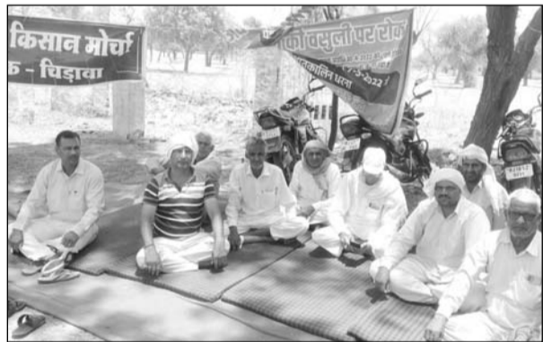
अवैध टोल वसूली बन्द करने की मांग को लेकर धरने पर बैठे लोग।

किसान नेताओं का आरोप है कि पीडब्ल्यूडी के तीन अधिकारियों ने समय सीमा बढ़ाने में टोल माफियों से मिलकर जनता को लुटने का काम किया है। किसानों ने दोषी तीनों अधिकारियों को बेनकाब कर तुरंत नौकरी से बर्खास्त करने की मांग की है। आसपास के गांवों में कल सुबह 11 बजे अवैध टोलों को हटाने के लिए संयुक्त किसान मोर्चा की ओर से जन जागरण अभियान चलाया