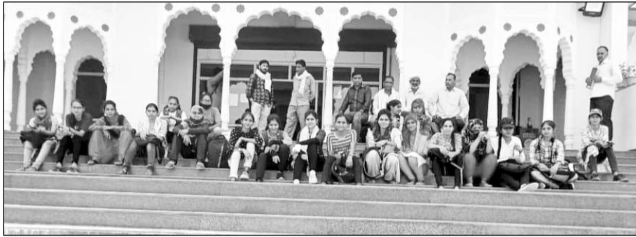
आक्रोशित छात्राओं ने शेखावाटी यूनिवर्सिटी पहुंच कर धरना प्रदर्शन किया।

छात्राओं ने बताया कि वे चिड़ावा में स्थित कॉलेज ने बीएड इंटीग्रेटेड पाठ्यक्रम-2021 में अध्ययनरत हैं। सभी का प्रैक्टिकल इस महाविद्यालय में हुआ और सभी छात्राएँ प्रैक्टिकल एजाम में उपस्थित थीं। लेकिन कॉलेज प्रशासन की ओर से लापरवाही के चलते इन्होंने प्रैक्टिकल अंक संबंधित शेखावाटी यूनिवर्सिटी को तब समय पर नहीं भेजे। जिससे यूनिवर्सिटी ने