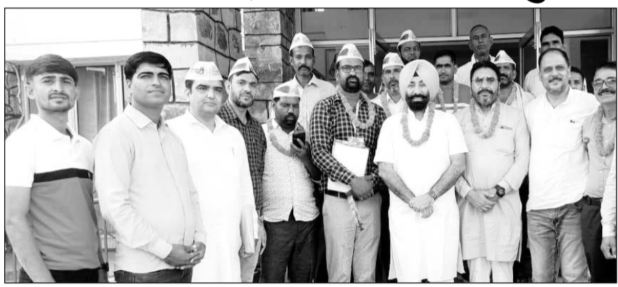
झुंझुनू में आम आदमी पार्टी का ट्रेनिंग सेशन हुआ।

झुंझुनू, 9 जुलाई। जिला मुख्यालय के सर्किट हाउस पर झुंझुनू विधानसभा के आम आदमी पार्टी के संगठन के अंतिम चरण में पदाधिकारियों को ट्रेनिंग दी गई। इस कार्यक्रम में पंजाब सरकार में पीआरटीसी चेयरमैन रंजो सिंह हड्डाना का कार्यकर्ताओं द्वारा फूलमाला पहनाकर स्वागत किया गया। हड्डाना ने कार्यकर्ताओं से आम आदमी पार्टी के जन हितैषी कार्यों को घर-घर तक पहुंचाने की गति को तेज करने का आ इ किया। उन्होंने ब्लॉक अध्यक्ष इमत्याज तगाला,