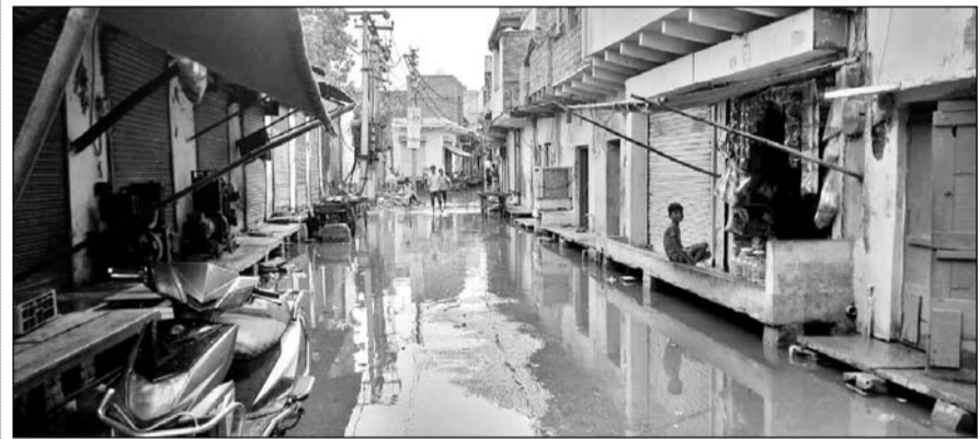
भरतपुर में बरसात होने से गलियों में पानी भर गया।

भरतपुर, (निसं)। रविवार को दोपहर में मौसम में बदलाव के साथ आसमान में घने बादलो ने डेरा ही नहीं डाला अपितु कुछ देर घनघोर बरसे भी और मौसम खुशनुमा भी हो गया लेकिन इसी के साथ शहर के अधिकांश नाले नालियों बंद होने के कारण तेज बारिश के चलते कई इलाकों में जलभराव होने से सड़कों ने दरिया का रूप ले लिया।