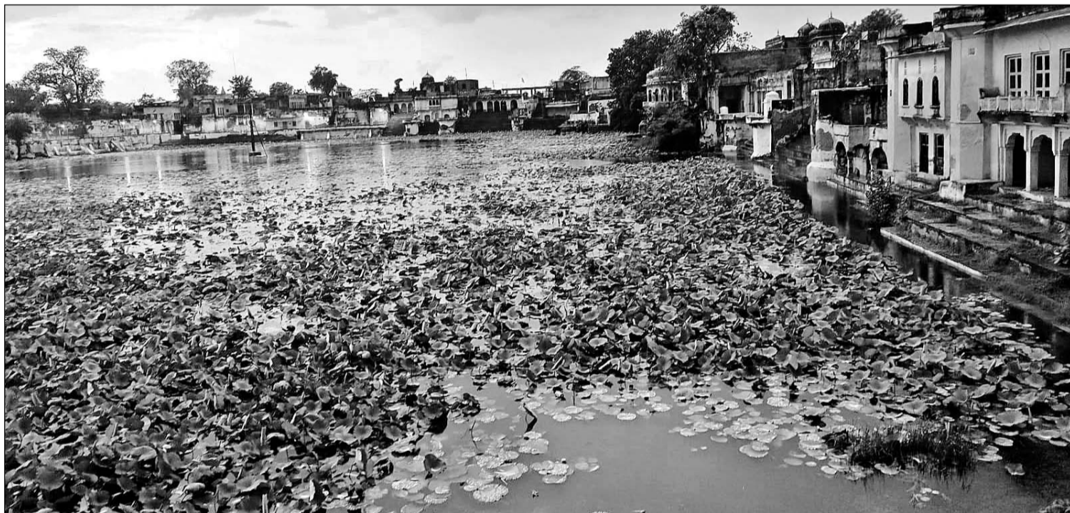
सांभर में रविवार को आई बारिश से देवयानी तीर्थ स्थल में तीन फीट पानी की आवक हुई।

सांभरझील, (निसं)। यहां देवयानी सरोवर में रविवार को शाम आई मूसलाधार बारिश से करीब 3 फीट पानी की आवक होने से सरोवर में हजारों की तादाद में मछलियों पर गहराता जल संकट फिलहाल टल गया है। करीब डेढ़ घंटे तक मूसलाधार बारिश होने से तीर्थ स्थल स्थित गोमुख से तेज पानी की जलधारा बहती देख यहां के पुजारियों के चेहरे भी खिल उठे। वहीं सांभर में रविवार को 70 मिमी बरसात हुई।