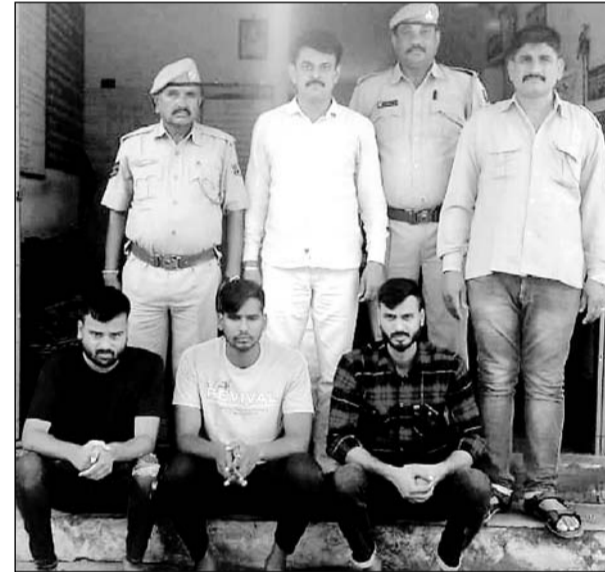
ठगी के मामले में कोतवाली पुलिस द्वारा गिरफ्तार तीन आरोपी।