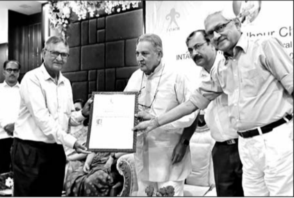
पूर्व नरेश गजसिंह ने जल संरक्षण के क्षेत्र में सम्मान पत्र प्रदान किए।