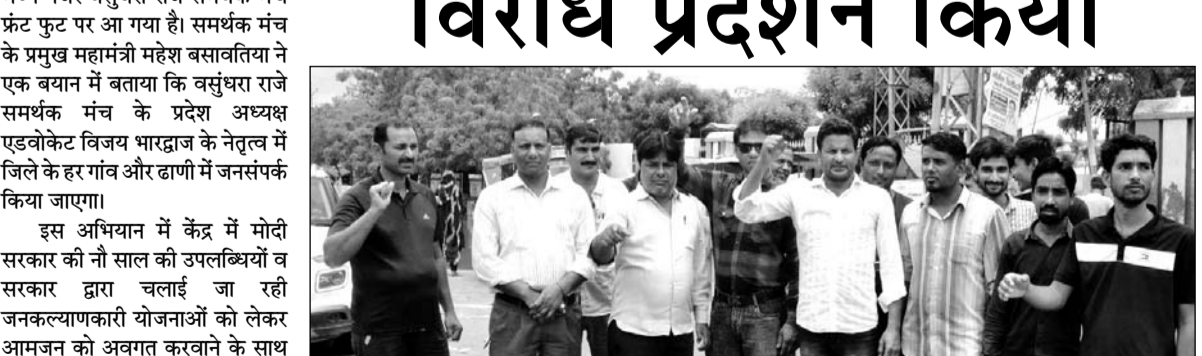
चूरू के भरतीया अस्पताल के सामने जमा पानी को लेकर आम आदमी पार्टी ने विरोध प्रदर्शन किया।