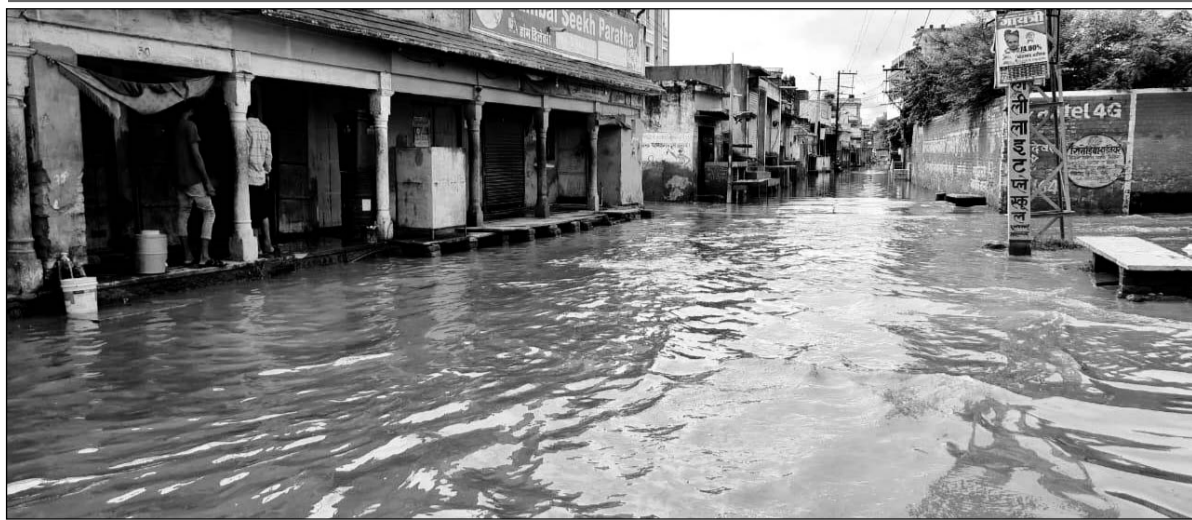
नवलगढ़ में बरसात के बाद कई जगह पर पानी भर गया।

अनेक इलाकों में जलभराव होने से लोग घरों में कैद होकर रह गए