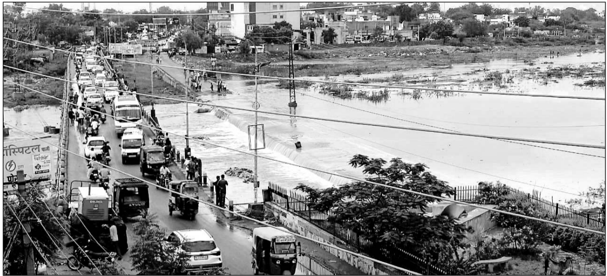
पाली की बांडी नदी में पानी आने से शहरवासी पहुंचे जिसके कारण नदी के पुल के ऊपर जाम लग गया।

पाली, (निसं)। पिछले 4 दिनों से पाली शहर में हो रही अच्छी बारिश से पाली शहर का हेमावास बांध व बानियवास बांध ओवरफ्लो हो गए हैं। रविवार को भी सुबह एक घंटे तक बारिश हुई। कई कॉलोनिनों में पानी भर गया है, जिन पर जलभराव से बचाने का जिम्मा है उनके घर के आगे भी गलियों में पानी भर है।