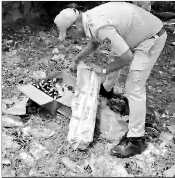
पुलिस ने अवैध शराब जब्त की।