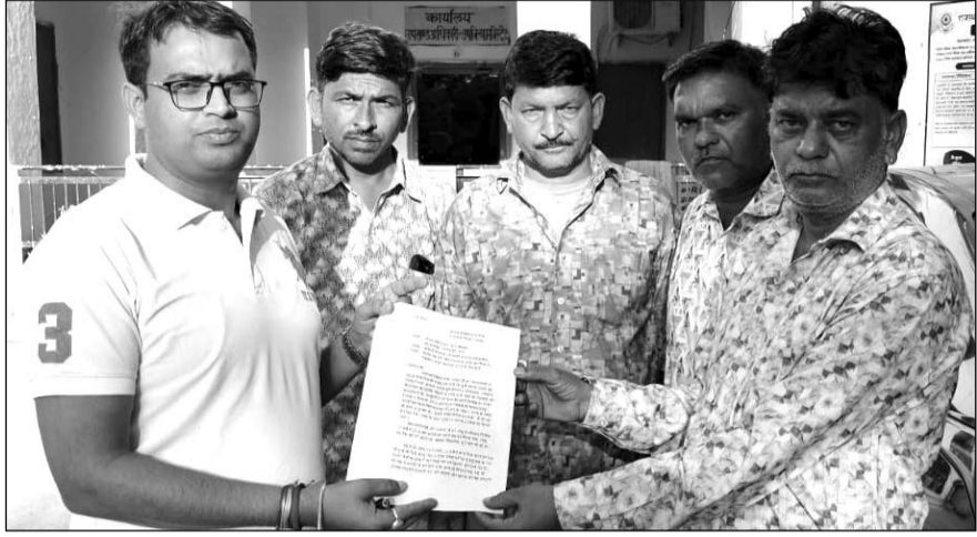
माण्डलगढ़ में समाजजनों ने एसडीएम को मुख्यमंत्री के नाम ज्ञापन दिया।