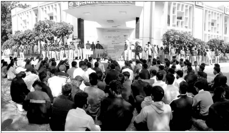
स्वामी केशवानन्द राजस्थान कृषि विश्वविद्यालय बीकानेर में फीस बढ़ोतरी के विरोध में घरने पर बैठे छात्र।

बीकानेर, (कासं)। फीस बढ़ोतरी के विरोध में कृषि छात्रों ने कुलपति सचिवालय का घेराव किया।