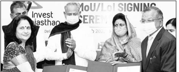
मुख्यमंत्री निवास पर वीडियो कॉन्फ्रेंस के जरिये आयोजित अक्षय ऊर्जा के क्षेत्र में निवेशकों से 3 लाख 5 हजार करोड़ के एमओयू एवं एलओआई पर हस्ताक्षर किये गये।

निवास पर वीडियो कॉन्फ्रेंस के माध्यम से आयोजित अक्षय ऊर्जा के क्षेत्र में