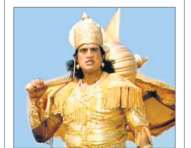
टेलीविजन पर मशहूर पौराणिक धारावाहिक "महाभारत" में "भीम" के किरदार को जीवंत करने वाले कलाकार प्रवीण कुमार का सोमवार देर रात निधन हो गया। वे 74 वर्ष के थे और लंबे समय से बीमार थे। प्रख्यात फिल्म निर्देशक वी आर पोपड़ा के निर्देशन में "महाभारत" में भीम के किरदार से प्रवीण को काफी लोकप्रियता मिली थी। बाद में उन्होंने कई फिल्मों में भी काम किया। उनके परिवार में पत्नी, पुत्री, दो भाई और एक बहन हैं। उल्लेखनीय है कि, प्रवीण कुमार अभिनेता होने के साथ एक एथलीट भी थे। विभिन्न अंतरराष्ट्रीय एथलैटिक प्रतियोगिताओं में हैमर थ्रो और डिस्कस थ्रो स्पर्धा में उन्होंने देश का प्रतिनिधित्व किया था और सन् 1966 के राष्ट्रमंडल खेलों में हैमर थ्रो में रजत पदक जीता था। इसके अलावा 1966 और 1970 के एशियाई खेलों में स्वर्ण पदक हासिल किया था।

संभावना जताई गई है कि बैंक की सुस्ती देख बदमाशों ने उसे लूटने का प्लान बनाया और वारदात को अंजाम दे दिया। यदि बैंक मुसूदे होती तो समय रहते बदमाश पुलिस की गिरफ्त में होते।