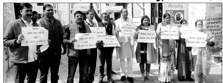
अलवर नगर परिषद के भाजपा पार्षदों ने विरोध प्रदर्शन किया।