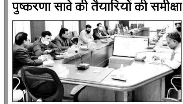
बीकानेर, (कासं)। पुष्करणा ब्राह्मण समाज के सामूहिक विवाह