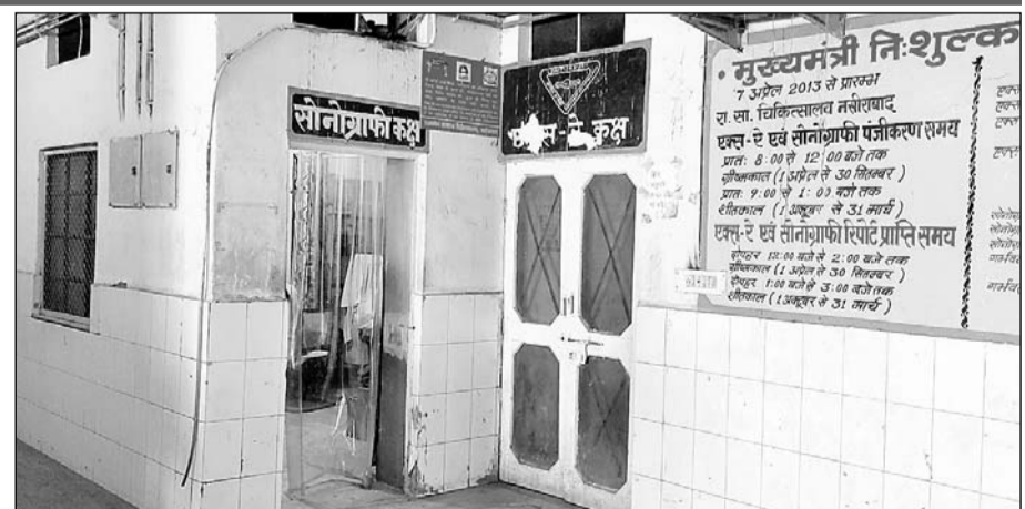
नसीराबाद अस्पताल में बंद पड़ा सोनोग्राफी कक्ष।