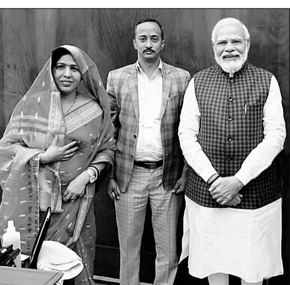
पीएम मोदी से मिली भरतपुर सांसद रंजीता कोली।

भरतपुर, (निसं)। भरतपुर सांसद रंजीता कोली ने पीएम से मुलाकात कर प्रधानमंत्री आवास योजना में हुए फर्जी डॉ. के घोटाळे व रीट परीक्षा 2021 धांधली के मामले की सीबीआई जांच कराने की मांग की। 8 फरवरी को भरतपुर सांसद रंजीता कोली ने पीएम से मुलाकात कर राजस्थान में रीट परीक्षा 2021 धांधली के मामले से भी प्रधानमंत्री को अवगत करवाया। सांसद ने कहा कि विधानसभा कार्या की पंचायत समिति कार्या, पहाड़ी में प्रधानमंत्री आवास योजना में बहुत बड़ा