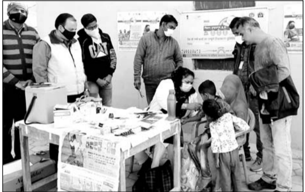
बीकानेर में मिशन इन्द्रधनुष में वंचित बच्चों को टीके लगाये।