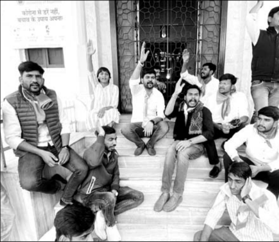
एनएसयूआई कार्यकर्ताओं ने मंगलवार को राजस्थान विवि. में कुलपति सचिवालय पर ताला जड़कर बाहर विरोध जताया।