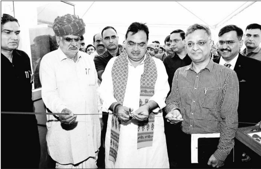
मुख्यमंत्री भजनलाल शर्मा ने गुरुवार को जयपुर में आयोजित एक आर्थिक अखबार के दो दिवसीय बिजनेस समिट का उद्घाटन किया। इस अवसर पर नगरीय विकास मंत्री झाबर सिंह खर्वा भी मौजूद थे।

जयपुर। मुख्यमंत्री भजनलाल शर्मा ने कहा कि राजस्थान में उद्योग के लिए अपार संभावनाएं हैं। राज्य सरकार उद्योगपतियों के लिए निवेश अनुकूल वातावरण तैयार करने तथा हर सेक्टर में निवेश को आकर्षित करने के लिए दूरदर्शिता के साथ काम कर रही है। उन्होंने कहा कि हमारी सरकार राज्य को आर्थिक विकास और निवेश के हब के रूप में विकसित करने के लिए प्रतिबद्ध है। शर्मा गुरुवार को जयपुर में आयोजित दो दिवसीय एक आर्थिक अखबार के बिजनेस समिट को संबोधित कर रहे थे। उन्होंने कहा कि इस समिट के आयोजन से विचारों का आदान-प्रदान कर अवसरों की पहचान की जाएगी तथा नई-नई साझेदारियां बनाई जाएंगी। उन्होंने आशा जताई कि इस दो दिवसीय समिट से प्रदेश में औद्योगिक विकास के लिए सकारात्मक सुझाव प्राप्त होंगे जिस पर अमल कर राजस्थान देश के अग्रणी प्रदेशों में शुमार हो सकेगा तथा 2047 तक विकसित भारत-विकसित राजस्थान के विजन को गति मिलेगी।