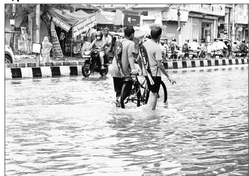
बारिश के बाद सीकर रोड मुरलीपुरा में केडिया पैलेस रोड पर पानी भर गया।

जयपुर। तेज बारिश से गुरुवार शाम जयपुर की सड़कें एक बार फिर लबालब होकर नदी की तरह बह गईं। शाम करीब 5 बजे से देर रात तक कभी तेज तो कभी मध्यम बारिश का दौर चलता रहा। टूटी सड़कों और उनमें हो रहे बड़े-बड़े खड्डों में वाहन रेंगते हुए आगे बढ़े। जलभराव के कारण सीकर रोड, कालवाड व निवारु रोड, कलेक्ट्री, पानीपेच, 22 गोदाम, अजमेर पुलिया, जयपुर परकोटे समेत अधिकांश इलाकों में आवाजाही ठप हो गयी। ट्रेफिक जाम के कारण देर रात तक सड़कों पर वाहनों का खेला लगा रहा। सड़कों पर भरे बारिश के पानी में कई दुर्घटना वाहन चालक फिसलकर भी गिरे।