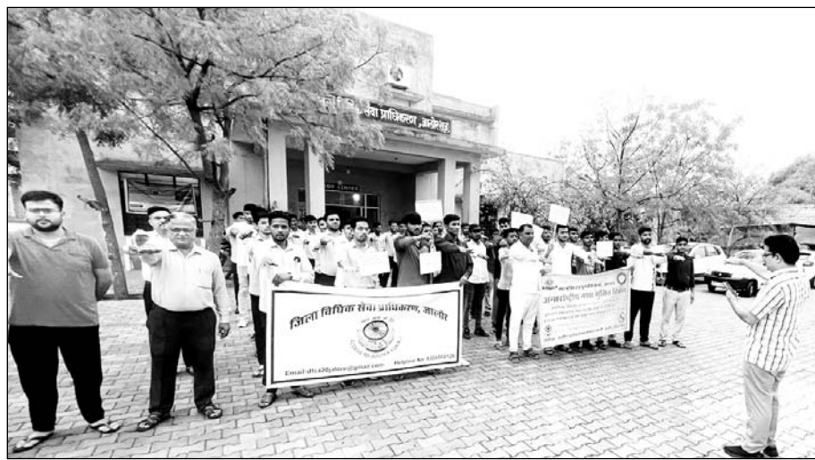
जालोर में जिला विधिक सेवा प्राधिकरण ने अन्तरराष्ट्रीय नशा मुक्ति दिवस मनाया।

जालोर, (का.सं)। राज्य प्राधिकरण जयपुर के निर्देशानुसार जिला विधिक सेवा प्राधिकरण के अध्यक्ष एवं जिला न्यायाधीश हारून के निर्देशन में अंतरराष्ट्रीय नशा मुक्ति दिवस पर जिला विधिक सेवा प्राधिकरण एवं नश मुक्ति एवं पुनर्वास केंद्र के तत्वाधान में जागरूकता कार्यक्रम का आयोजन किया गया।