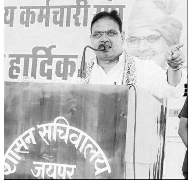
मुख्यमंत्री भजनलाल शर्मा ने गुरुवार को शासन सचिवालय में राजस्थान सचिवालय कर्मचारी संघ के शपथ ग्रहण समारोह को संबोधित किया।

शर्मा ने कहा कि सचिवालय में आधारभूत ढांचों के विकास कार्यों से अधिकारी व कर्मचारी स्वच्छ एवं सुगम कार्यस्थल पर काम कर पाएंगे। इसी क्रम में यहां बहुमंजिला मुख्य सचिव ब्लॉक, नॉर्थ ब्लॉक और साउथ ब्लॉक के निर्माण के लिए 275 करोड़ रुपये की स्वीकृतियां जारी कर दी गई हैं। 70 करोड़ की लागत से नॉर्थ ब्लॉक का निर्माण कार्य प्रगतिरत है। सचिवालय