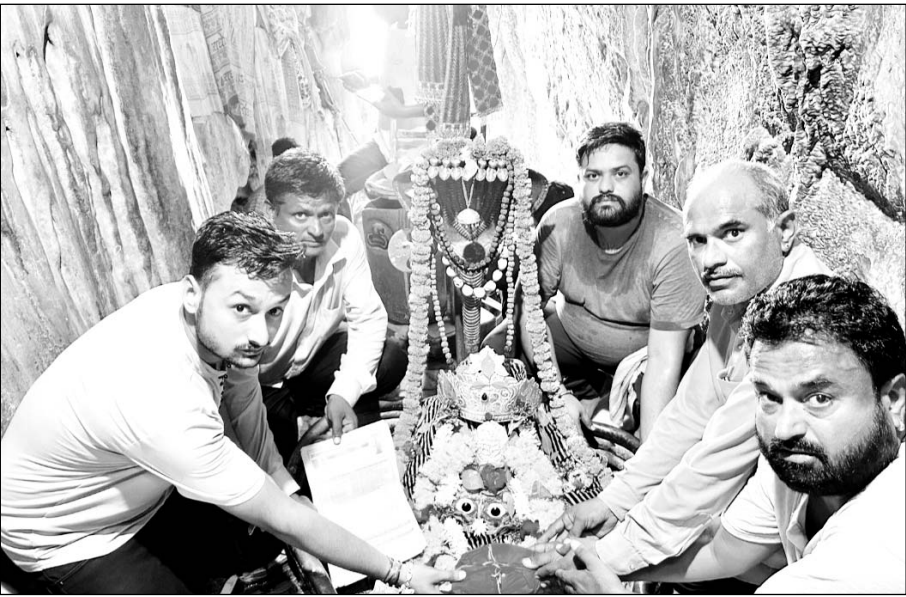
बाबा परशुराम महादेव पैदल यात्रा का प्रथम पत्रक भक्तों ने परशुराम महादेव को अर्पित किया।

जोधपुर, (कासं)। जोधाणा धर्माथ सेवा संस्थान, जोधपुर द्वारा संचालित बाबा परशुराम महादेव पैदल यात्रा का प्रथम पत्रक आज जोधपुर से पहुंचे भक्तों ने भगवान परशुराम महादेव को अर्पण कर यात्रा के लिए आमंत्रित किया। इस वर्ष यह यात्रा 28 जुलाई को जोधपुर से रवाना होगी।