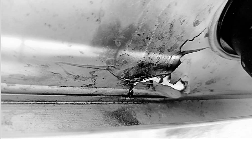
जिला मुख्यालय के उपनगर धोइंदा में घर पर लगे सोलर पैनल पर आकाशीय बिजली गिर गई।

गुरुवार को दिन के तापमान में 4 डिग्री बढ़ोतरी होने से लोगों को तेज गर्मी व भारी उमस सताने लगी लेकिन