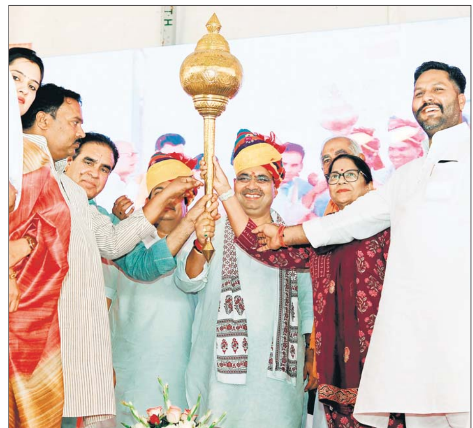
झुंझुनू में राज्य स्तरीय सामाजिक सुरक्षा पेंशन कार्यक्रम में भाजपा प्रदेश महामंत्री संतोष अहलावत व पूर्व विधायक शुभकरणा चौधरी ने मुख्यमंत्री भजनलाल शर्मा को गदा भेंट की।

राशि हस्तांतरण कार्यक्रम को संबोधित कर रहे थे। उन्होंने बटन दबाकर प्रदेश के 88 लाख से अधिक पेंशनरों के बैंक खातों में 1 हजार 37 करोड़ रूपए से अधिक की राशि हस्तांतरित की। इस अवसर पर उन्होंने कहा कि, हमारी सरकार मुख्यमंत्री वृद्धजन सम्मान पेंशन योजना, मुख्यमंत्री एकल नारी सम्मान पेंशन योजना, मुख्यमंत्री विशेष योग्यजन सम्मान पेंशन योजना, लघु एवं सीमांत वृद्धजन कृषक सम्मान पेंशन योजना के जरिए जरूरतमंदों को आर्थिक संबल प्रदान कर रही है। इस कार्यक्रम से पूर्व मुख्यमंत्री ने खेल मैदान में अंशक के पोषे का रोपण भी किया। मुख्यमंत्री ने कहा कि, राज्य (शेष अंतिम पृष्ठ पर)