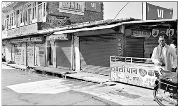
गोगामेड़ी हत्याकांड के विरोध में व्यापारियों ने बाजार बंद रखे।

दौसा, (निंस)। राजपूत करणी सेना के चीफ गोगामेड़ी मर्डर कांड के विरोध में उपजा आक्रोश बुधवार को सड़कों पर नजर आया। राजपूत समाज सहित सर्व समाज ने विभिन्न जगहों पर