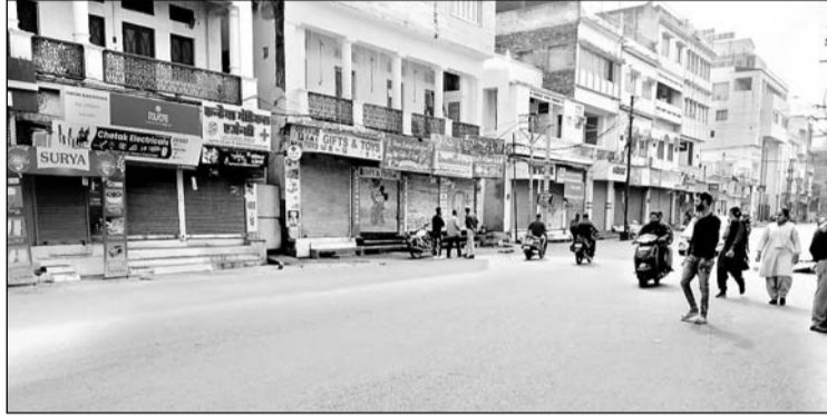
सुखदेव सिंह गोगामेड़ी की हत्या करने के विरोध में उदयपुर के बाजार बंद रहे।