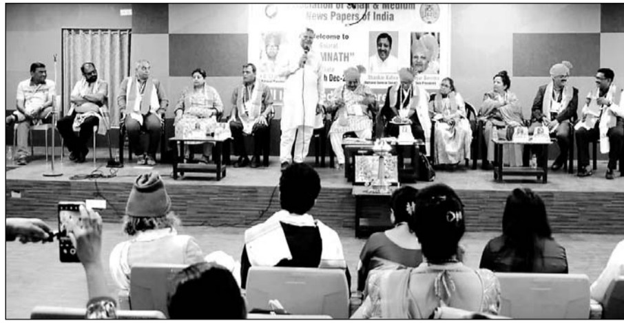
एसो. ऑफ स्मॉल एण्ड मीडियम न्यूजपेपर्स ऑफ इण्डिया की राष्ट्रीय परिषद की बैठक आयोजित हुई।

बैठक में गुजरात, राजस्थान, उत्तर प्रदेश, महाराष्ट्र, उड़ीसा, कर्नाटक, मध्यप्रदेश, उत्तराखंड आदि राज्यों की इकाइयों के अध्यक्ष व पदाधिकारी शामिल हुए और अपने अपने राज्यों से प्रकाशित होने वाले समाचार पत्र/पत्रिकाओं के सम्पर्क आने वाली समस्याओं से अवगत कराया और उनका निराकरण करवाने की मांग रखी। बैठक में सी. बी. सी., आर. एन. आई. की कार्यशैली की आलोचना करते हुए कहा गया कि इनके द्वारा आये दिये ऐसे नियम थोपे