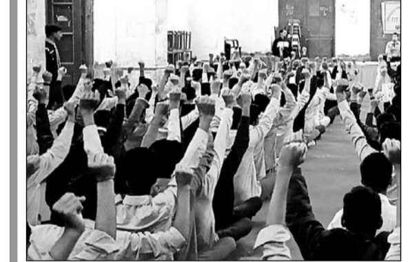
शहीद मेजर पूरण सिंह फोर्ट स्कूल में 'फिट इंडिया वीक' कार्यक्रम में विद्यार्थियों ने सामूहिक योगाभ्यास किया।