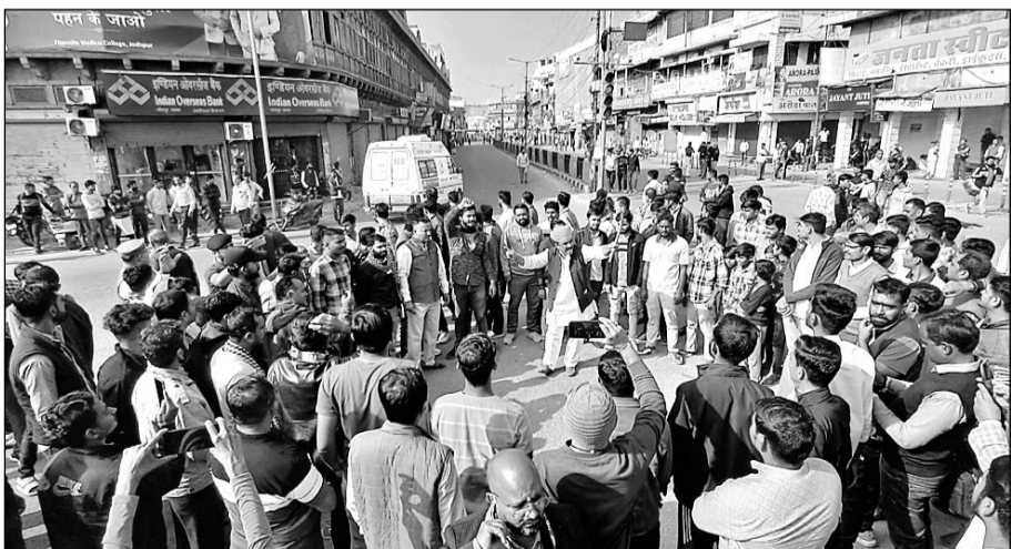
जोधपुर में राजपूत समाज और सर्वसमाज के लोगों ने प्रदर्शन किया।