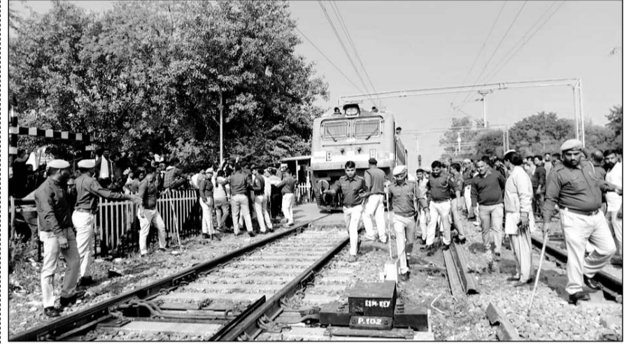
भीलवाड़ा में प्रदर्शनकारियों ने ट्रेन की पटरियों पर डेरा डाला और ट्रेन को रोक दिया।

उदयपुर/इंगूरपुर/भीड़र, (कास)। श्री राजपूत करणी सेना के राष्ट्रीय अध्यक्ष सुखदेव सिंह गोगामेड़ी की जयपुर में हुई हत्या के बाद प्रदेश में विरोध-प्रदर्शन व तनाव के बीच बुधवार को उदयपुर पूरी तरह से बंद रहा। शहर के बाजारों में दुकानों व प्रतिष्ठान स्वतः बंद रहे वहीं कुछ स्थानों पर खुली दुकानों, बैंक व कार्यालयों को विरोध कर रहे लोगों ने बंद करवाया। सुबह सेवाश्रम चौराहे पर इस विरोध-प्रदर्शन की शुरुआत हुई जो दोपहर तक कलेक्ट्री पर पहुंच गया जहां आक्रोशित लोगों ने पुलिस से हुई झड़प के बीच कलेक्ट्री के अंदर पत्थर भी फेंके हालांकि कुछ ही देर में पुलिस अधीक्षक ने लोगों को समझाकर शांत मामला शांत करवाया। शाम 4 बजे बाद शहर में स्थिति सामान्य