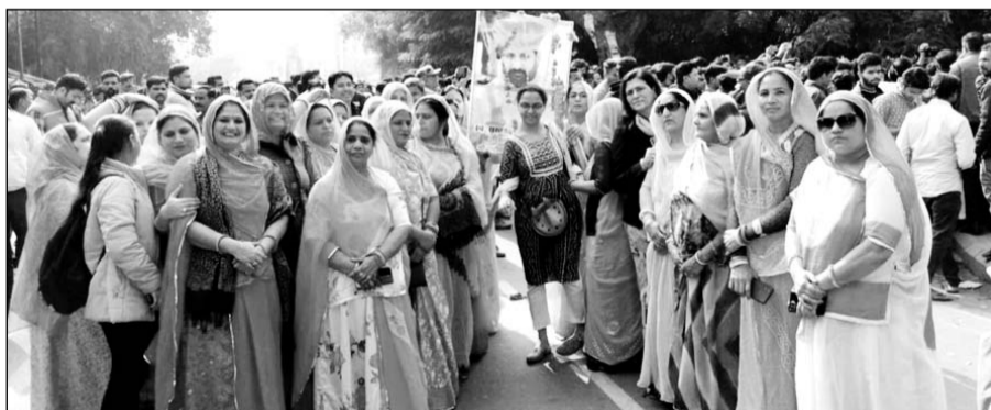
कोटा में राजपूत समाज की महिलाओं ने भी प्रदर्शन में हिस्सा लिया।

व्यक्त किया। इसके बाद बंद समर्थकों की भीड़ शहर में प्रवेश किया और सिरे बाजार और एमजीएच रोड होते हुए जालोरी गेट चौराहे पर आकर अपना आक्रोश प्रकट किया। किसी अनहोनी के डर से शहर के दुकानदारों ने अपने प्रतिष्ठान नहीं खोले। पुलिस अधिकारियों के साथ भारी मात्रा में शहर के प्रमुख सड़कों और चौराहों पर अतिरिक्त पुलिस जाब्ता तैनात किया है और नई सड़क पर आक्रोशित बंद समर्थकों के साथ भी भारी तादाद में पुलिस जाब्ता तैनात किया।