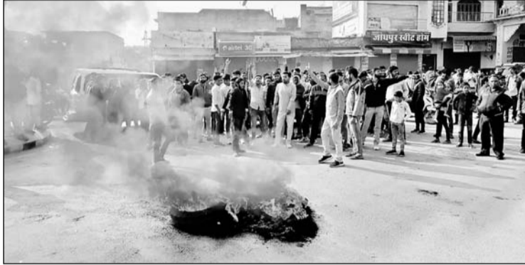
भीड़ में राजपूत समाज के लोगों ने टायर जलाकर प्रदर्शन किया।