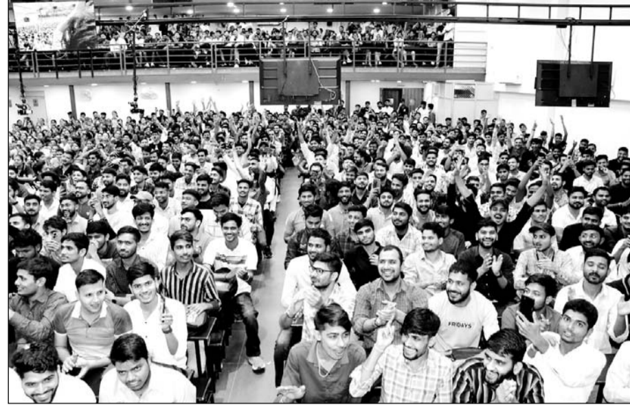
उत्कर्ष क्लासेस ने जयपुर में गोपालपुरा बायपास रोड स्थित शकुंतला भवन में राज्य के सभी प्रतियोगी परीक्षार्थियों के लिए विशेष निःशुल्क ऑफलाइन क्लास का आयोजन किया।

जोधपुर, (कासं)। उत्कर्ष क्लासेस की ओर से रविवार को जयपुर में गोपालपुरा बायपास रोड स्थित शकुंतला भवन में राज्य के सभी प्रतियोगी परीक्षार्थियों हेतु विशेष निःशुल्क ऑफलाइन क्लास का आयोजन किया गया।