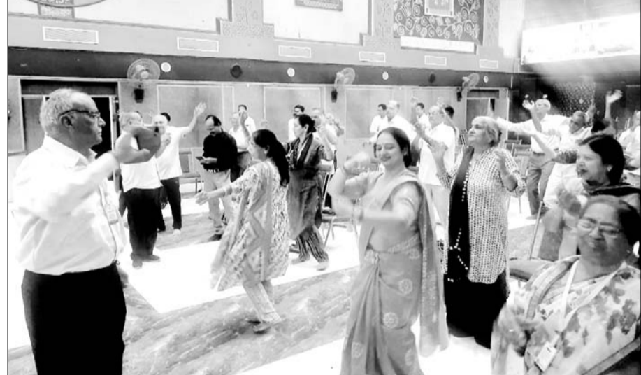
सिंधी वेलफेयर और मेडिकल सोसायटी तथा सिंधी कल्चरल सोसायटी जोधपुर के निर्देशन में एक कार्यशाला, डेमो सेशन का आयोजन सिंधु महल चौपासनी हाउसिंग बोर्ड में किया गया।

जोधपुर, (कासं)। सही आहार, सही व्यायाम और सस्वक जीवन संबंधी सूत्र के लिए सन-टू-हूमन फाउंडेशन की ओर से जोधपुर के रेलवे स्टेशन में 2 से 7 जून को होने वाले शिविर से संबंधित जानकारी सिंधी समाज को दी गई। इसके लिए सिंधी वेलफेयर और मेडिकल सोसायटी तथा सिंधी कल्चरल सोसायटी जोधपुर के सान्ध्य में एक कार्यशाला, डेमो सेशन का आयोजन सिंधु महल, चौपासनी हाउसिंग बोर्ड में किया गया।