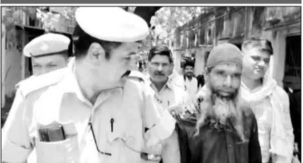
कोतवाली पुलिस मौके पर पहुंची और आरोपी को अपने साथ ले गई।

घटना के बाद बड़ी संख्या में वकील व अन्य लोग जमा हो गये