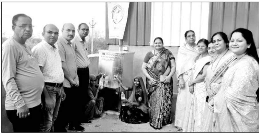
जालोर के मातृ शिशु एवं स्वास्थ्य कल्याण केंद्र में लॉयनेस क्लब ने वाटर कूलर दिया।