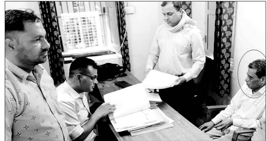
कोटपूतली में एसीबी टीम ने आरोपी संविदाकर्मी लिपिक को गिरफ्तार किया।

एसडीएम कार्यालय में संचालित एनएचएआई भूमि अवाप्ति शाखा में कार्यरत है संविदाकर्मी लिपिक