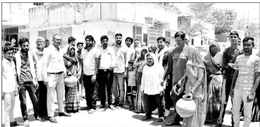
पानी की समस्या को लेकर महिलायें खाली मटके लेकर चूरू कलेक्ट्रेट पहुंची।

चंद्रप्रकाश सैनी ने बताया कि वार्ड में दो ट्यूबवेल बने हुए हैं। दोनों ही कई दिनों से खराब पड़े हैं, जिसके कारण वार्ड के घरों में पानी की सप्लाई नहीं मिल रही है। इस संबंध में जलदाय