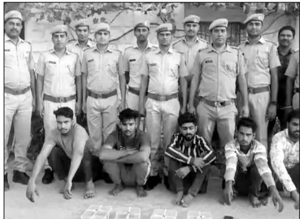
पुलिस ने डकैती की योजना बनाते पांच बदमाशों को गिरफ्तार किया।