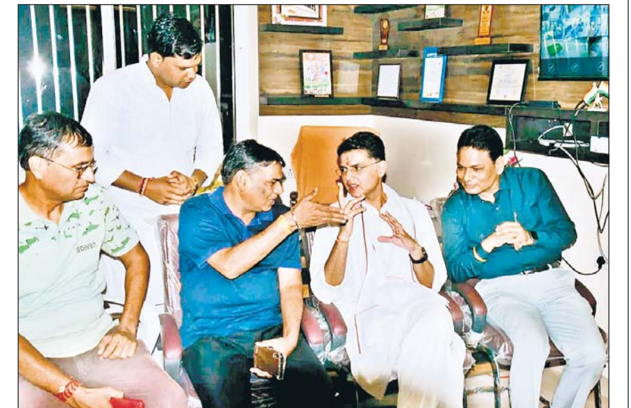
पूर्व उपमुख्यमंत्री सचिन पायलट की टोंक में सक्रियता न केवल भाजपा अपितु कांग्रेसजनों में भी बड़ी चर्चा का विषय बनी हुई है। पिछले 10-12 दिनों से पायलट टोंक विधानसभा क्षेत्र के विभिन्न क्षेत्रों के तृफानी दौर कर रहे हैं। टोंक में पायलट की सक्रियता के कारण यहां से उम्मीदवारी में इस टोंक के की फिरोक में बैठे 12 से 15 कांग्रेसजन भी सकते में आ गये हैं। इस बीच पायलट ने भाजपा खेमे में भी संधमारी कर दी है, शनिवार को पायलट की, भाजपा के पूर्व टोंक शहर मण्डल अध्यक्ष कमलेश सिंगोदिया से हुई मुलाकात के कई राजनीतिक मायने निकाले जा रहे हैं।

कन्फेडरेशन ऑफ रियल एस्टेट डेवलपर्स एसोसिएशन ऑफ इंडिया (क्रेडाई) ने मिश्र में 21 वें नैटवर्क के दौरान अपने नॉलेज पार्टनर कुशमैन एंड