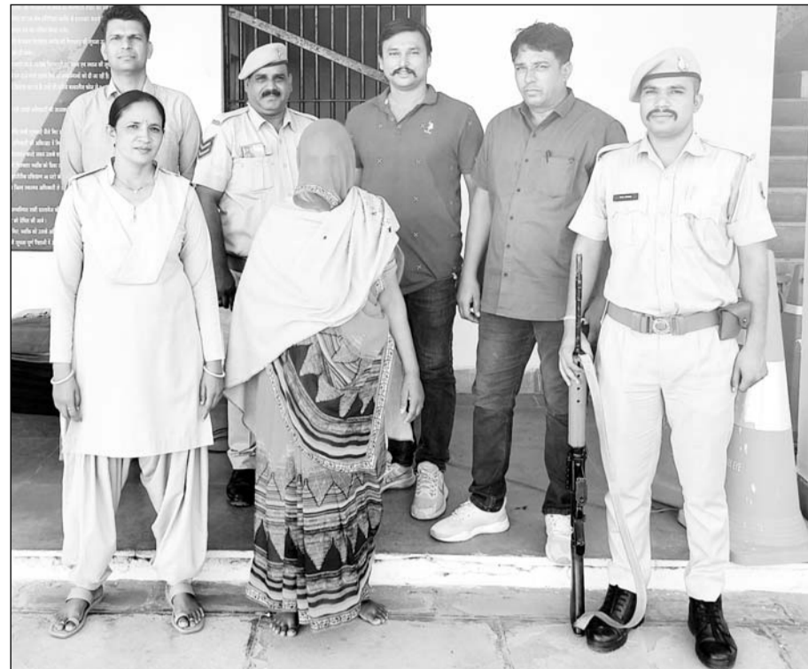
राजसमंद पुलिस ने पति की हत्या के आरोप में पत्नी को गिरफ्तार किया।

मारपीट से तंग आकर पत्नी ने ही की पति की हत्या