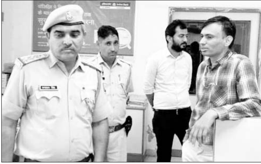
पुलिस ने वारदात के बाद मौके पर जाकर जानकारी ली।

मदनगंज-किशनगढ़, (निसं)। दिनदहाड़े बदमाश खोड़ा गणेश रोड़ स्थित इलाहाबाद बैंक में घुस गये और हथियार की नोक पर स्टॉफ को कमरे में बंद कर कैशियर से करीब चार लाख नगदी लूटकर फरार हो गये। बैंक को डायनार्माईट से उड़ाने की धमकी देने वाले बाईक सवार आरोपियों ने मैनेजर से 40 लाख रुपये की मांग की। वारदात को लेकर पुलिस ने सीसीटीवी फुटेज सहित हुलिये को जांच के दायरे में लेकर बदमाशों की खोजबीन शुरू कर दी है। इलाहाबाद बैंक में शनिवार को दोपहर करीब सवा तीन बजे दो नकाबपोश बदमाश अंदर घुस गये।