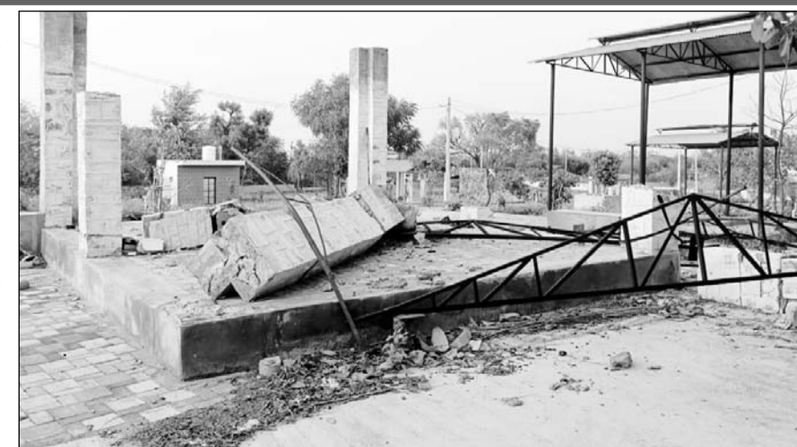
सांभर के शमशान घाट में तुफान से उड़े टीनशेड आज भी यथास्थिति में पड़े हुये हैं।