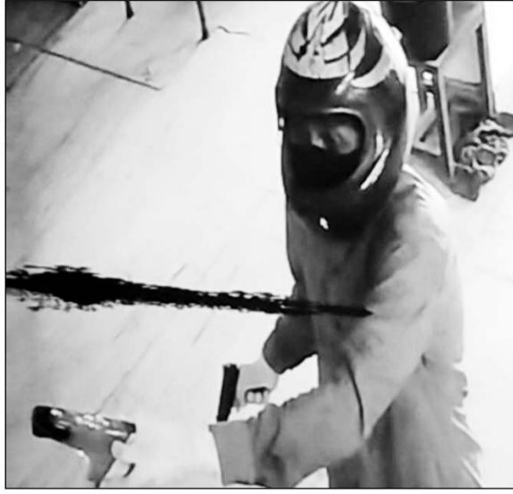
हथियार सहित बैंक में घुसे नकाबपोश बदमाश।

गन लिये लुटेरों ने बैंक को बम से उड़ाने की धमकी देकर मैनेजर से 40 लाख रुपये की मांग की