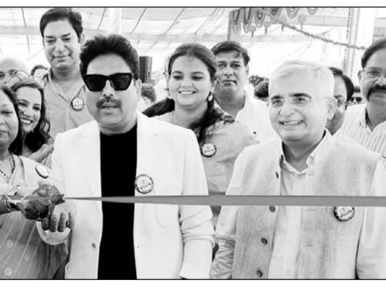
टैक्सपेयर हब का उद्घाटन करते हुए अभिनेता व हास्य कवि शैलेश लोधा।