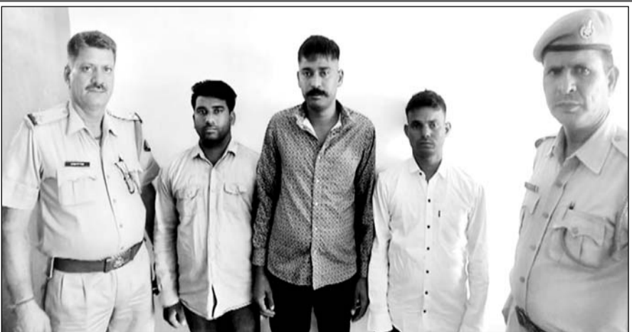
व्यापारी का अपहरण कर फिरौती वसूलने के मामले में पुलिस ने तीन आरोपियों को गिरफ्तार किया।