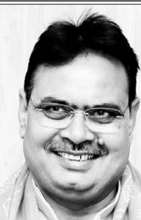
मुख्यमंत्री भजनलाल शर्मा।

मुख्यमंत्री भजनलाल शर्मा ने कहा कि डॉ. मुखर्जी ने आजादी के बाद बनी पहली सरकार में मंत्री का पद त्याग दिया था क्योंकि उस वक्त की सरकार तुष्टीकरण की नीति पर चल रही थी और जम्मू-कश्मीर की नीति पर उनके स्पष्ट विचार थे कि एक देश में दो निशाणों दो विधान नहीं होने चाहिए डॉ. मुखर्जी ने