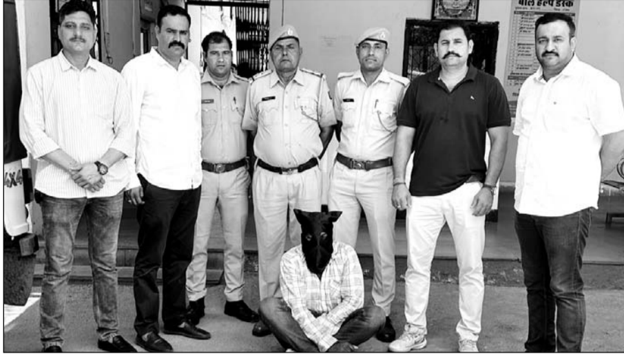
जानलेवा हमले के मामले से जुड़े एक आरोपी को पुलिस ने गिरफ्तार किया।