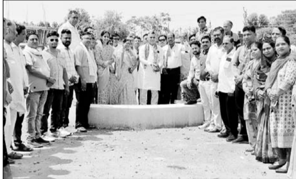
कार्यक्रम में उपस्थित जनों ने डॉ. श्यामा प्रसाद मुखर्जी के चित्र के समुच्च नमन कर उन्हें श्रद्धांजलि दी।