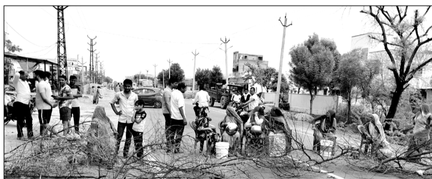
मालपुरा के अजमेर रोड पर पानी की किल्लत से परेशान महिलाओं ने जाम लगाया।

मालपुरा, (निसं) नगरपालिका शहरी क्षेत्र के अजमेर रोड आवासीय कॉलोनी में पानी की किल्लत से परेशान महिलाओं ने विभाग की लापरवाही को लेकर रविवार को मालपुरा-अजमेर सड़क मार्ग पर सीआईडी ऑफिस के सामने कंटोली झाड़ियां लगाकर जाम लगाकर प्रदर्शन किया। आवासीय कॉलोनी की महिलाओं ने बीच सड़क पर मटकियां फोड़ प्रदर्शन करते हुये मौके पर पहुंचे अधिकारियों के समक्ष अपनी पीड़ा बयां की। महिलाओं ने बताया कि पालिका शहरी क्षेत्र में लाखों रुपये की लागत से आवासीय पकान बनाकर विभाग के नियमानुसार नल कनेक्शन लेकर समय पर बिल का भुगतान करने के बावजूद भी भीषण गर्मी में पानी की समस्या से जूझना पड़ रहा है। महिलाओं ने बताया कि दूर-दराज से पानी लाकर अथवा मुंह मांगे दामों में पानी के टैंकर डलवाकर राजमार्ग के कार्य करने पर विवश होना पड़ रहा है। यहां तक कि कई आवासीय कॉलोनि