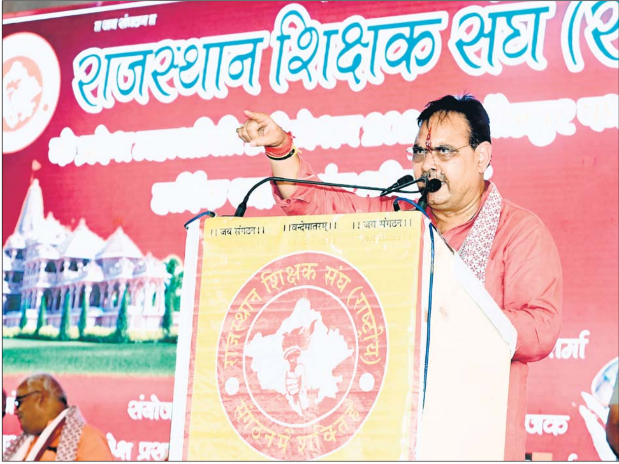
प्रदेश की भजनलाल सरकार बजट तैयार करने की कवायद में जुट गई है। इसी कड़ी में मुख्यमंत्री भजनलाल शर्मा ने रविवार को धौलपुर जिले के बाड़ी स्थित ग्राम बिजोली में राजस्थान शिक्षक संघ (राष्ट्रीय) के प्रदेश महासमिति अधिवेशन को सम्बोधित किया।