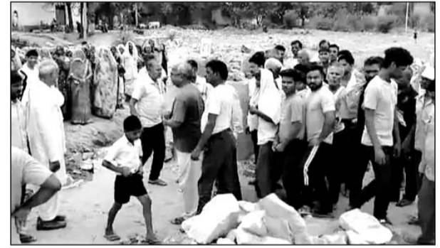
घटना के बाद मौके पर लोगों की भीड़ जमा हो गई।

सूचना पर रात को पुलिस भी मौके पर पहुंची। दूसरे दिन लोगों को पता चलने पर उनमें आक्रोश फैल गया। हिंगोदिया रोड स्थित एक भूमि पर लंबे समय से दो पक्षों में विवाद चल रहा है। इनमें एक पक्ष जमीन को अपसरी समाज की जमीन बता रहा है, जबकि दूसरा पक्ष उसके खेतदारी की जमीन बता रहा है। इसी विवाद के बीच शनिवार रात को कुछ असामाजिक तत्व यहां आए और यहां