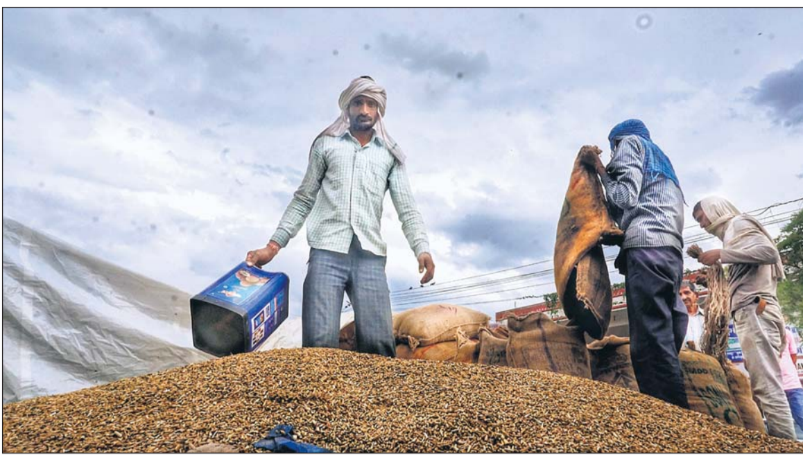
जयपुर में लगातार दूसरे दिन भी तेज बारिश हुई। बेमौसम की यह बारिश किसानों के लिए किसी बड़े सितम से कम नहीं है। सीकर रोड पर स्थित कुकरखेड़ा अनाज मंडी की यह तस्वीर अपने आप यह हाल बयां कर रही है। जो की फसल बेचने मंडी आये किसानों की मेहनत पर अंतिम क्षणों में बारिश ने पानी फेर दिया। मंडी में जगह नहीं मिलने के कारण किसानों को जाँ की बोरियां खुले में ही रखनी पड़ीं। अपनी बारी आने और खरीददार मिलने का इंतजार कर रहे किसानों की जाँ की बोरियां शुक्रवार को आई तेज बारिश में पूरी तरह से भीग गईं। फसल का सही भाव मिल सके इसके लिए कई किसानों ने सैम्पल के तौर पर काफी सारी जाँ खुले में फैला रखी थी, लेकिन ऐन मौके पर आई बारिश ने उनकी महीनों की मेहनत को पूरा चॉपट कर दिया। प्रदेश के किसानों के लिए 15 मार्च के बाद का समय बहुत विकट गुजरा है, पहले ओलों व आंधी ने खड़ी फसलों को खेतों में ही नुकसान पहुंचा दिया और अब लगातार हो रही बारिश ने रही-सही कसर को भी पूरा कर दिया है।

स्मॉल सेविंग... (प्रथम पृष्ठ का शेष) अप्रैल से 30 जून तक की तिमाही के लिए लघु बचत योजनाओं पर ब्याज की नई दरें जारी कर दी गयी है।