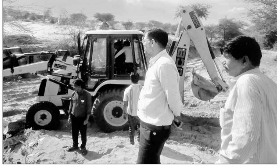
नगर पालिका की सिवायचक भूमि से अतिक्रमण हटाती हुई जेसीबी मशीन।

60-70 बीघा भूमि पर हो रहे थे अवैध अतिक्रमण