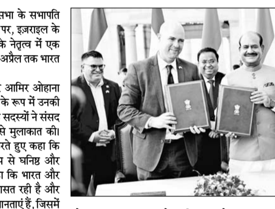
लोकसभा अध्यक्ष ओम बिरला से शुक्रवार को इज़राइल के नेसेट (संसद) के स्पीकर आमिर ओहाना के नेतृत्व में एक शिष्टमंडल ने मुलाकात की।

जयपुर, (का.सं.)। उपराष्ट्रपति और राज्य सभा के सभापति तथा लोक सभा अध्यक्ष के संयुक्त निमंत्रण पर, इज़राइल के नेसेट (संसद) के स्पीकर आमिर ओहाना के नेतृत्व में एक इजरायली संसदीय शिष्टमंडल 31 मार्च से 4 अप्रैल तक भारत का दौरा कर रहा है। इज़राइल के नेसेट (संसद) के स्पीकर आमिर ओहाना द्वारा पदभार ग्रहण किए जाने के बाद स्पीकर के रूप में उनकी यह पहली विदेश यात्रा है। आज शिष्टमंडल के सदस्यों ने संसद भवन में लोक सभा अध्यक्ष, ओम बिरला से मुलाकात की। बिरला ने भारत में शिष्टमंडल का स्वागत करते हुए कहा कि इज़राइल और भारत के बीच पारंपरिक रूप से घनिष्ठ और मैत्रीपूर्ण संबंध रहे हैं। बिरला ने यह भी कहा कि भारत और इज़राइल, दोनों की मजबूत लोकतांत्रिक विरासत रही है और साथी लोकतंत्र के रूप में दोनों देशों में कई समानताएँ हैं, जिसमें विविध संस्कृतियों का सम्मान करना, लोकतांत्रिक मूल्यों का पालन करना और लोगों को आशाओं और आकांक्षाओं के अनुसार काम करना शामिल है। बिरला ने कहा कि बदलते वैश्विक परिदृश्य में भारत और इज़राइल के बीच संबंध और अधिक महत्वपूर्ण हो गए हैं।