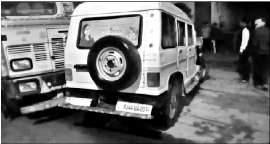
चूरू सड़क मार्ग पर अनियंत्रित ट्रक ने कार को टक्कर मार दी।

रतनगढ़, (नि.सं)। चूरू सड़क मार्ग पर अनियंत्रित ट्रक ने बारातियों से भरी एक कार को टक्कर मार दी। घटना में कार में सवार आठ बालिकाओं सहित कार ड्राइवर घायल हो गया, जिन्हें रतनगढ़ के जिला अस्पताल में भर्ती करवाया गया है, जहां पर उनका उपचार चल रहा है।