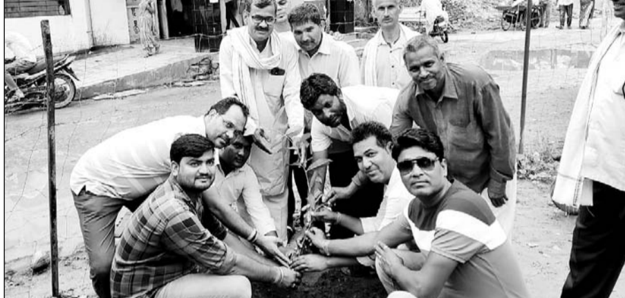
कांग्रेस कार्यकर्ताओं के अलावा जाटव समाज के युवाओं ने राजकीय जिला चिकित्सालय परिसर में पौधारोपण किया।

हिण्डौन सिटी। विधायक भरोसी लाल जाटव के 75 वें जन्मदिवस पर बुधवार को शहर में विभिन्न कार्यक्रम हुए। कांग्रेस कार्यकर्ताओं के अलावा जाटव समाज के युवाओं ने राजकीय जिला चिकित्सालय परिसर में पौधारोपण किया, वहीं रोगियों को फल वितरित