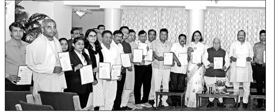
राज्यपाल कलराज मिश्र ने बुधवार को राजभवन में संस्कृति युवा संस्था की ओर से संविधान को पढ़ो और जिओ अभियान की शुरुआत करते हुए मुद्रित संविधान की उद्देशिका और मूल कर्तव्य संदेश का लोकार्पण भी किया।

जयपुर, (का.सं.)। राज्यपाल कलराज मिश्र ने कहा है कि भारतीय संविधान भारतीय संस्कृति से ओतप्रोत है। संविधान सांस्कृतिक ग्रंथ है और इसके बारे में सभी को समुचित जानकारी होनी चाहिए। उन्होंने कहा कि वह जब राज्यपाल के रूप में राजस्थान आए तब इस बात को अनुभूत किया कि संविधान की उद्देशिका और मूल कर्तव्यों के बारे में बहुत अधिक जानकारी लोगों को नहीं है। इसे महसूस करते हुए ही