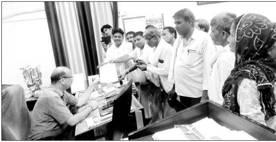
ग्रामीणों ने जिला परिषद के मुख्य कार्यकारी अधिकारी के नाम ज्ञापन दिया

बामनवास। सांचौर ग्राम पंचायत में हाल ही में हो रहे नरेगा कार्य का मस्टरोल के माध्यम से कार्य नहीं होने के बाद में फर्जी भुगतान उठा लिया। इस घट्याचार की कलाई खोलने की मांग को लेकर सांचौर ग्राम पंचायत के आरपुरा महाराजंड माधोपुरा आदि के ग्रामीणों ने एसडीएम को जिला परिषद के मुख्य कार्यकारी अधिकारी के नाम ज्ञापन दिया गया है। एसडीएम द्वारा इस प्रकरण की जांच के लिए जिला परिषद के नरेगा के अधिशासी अभियंता को जांच के लिए सात दिन में जांच कर रिपोर्ट प्रस्तुत करने के लिए भी पाबंद किया गया है। ग्रामीणों ने आरोप लगाते हुए बताया कि ग्राम पंचायत क्षेत्र में चल रहे नरेगा कार्य में हुए फर्जीबाड़े को लेकर शिकायत के बाद पहुंचे अधिकारियों द्वारा खुद की रिपोर्ट में स्पष्ट किया गया था कि यहां नरेगा का कार्य नहीं हुआ है इसके बावजूद नरेगा से श्रमिकों को भुगतान कर दिया गया है। ग्रामीणों ने ग्राम