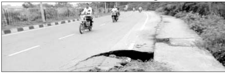
करोली में हाईवे की सड़क पर जगह-जगह हो रहे गहरे गड्ढों से हर समय हादसों का डर बना रहता है।

करोली। जिला मुख्यालय स्थित शहर के बीचो बीच होकर निकल रहे एनएच 11वीं सड़क मार्ग पर हो रहे गहरे गड्ढे और फुटपाथ पर हो रहे अवैध अतिक्रमणों को जिला मुख्यालय पर बैठे जिले के आला अधिकारी सुध नहीं ले रहे हैं जिनसे आए दिन दुर्घटनाओं का लोगों में भय व्याप्त है।