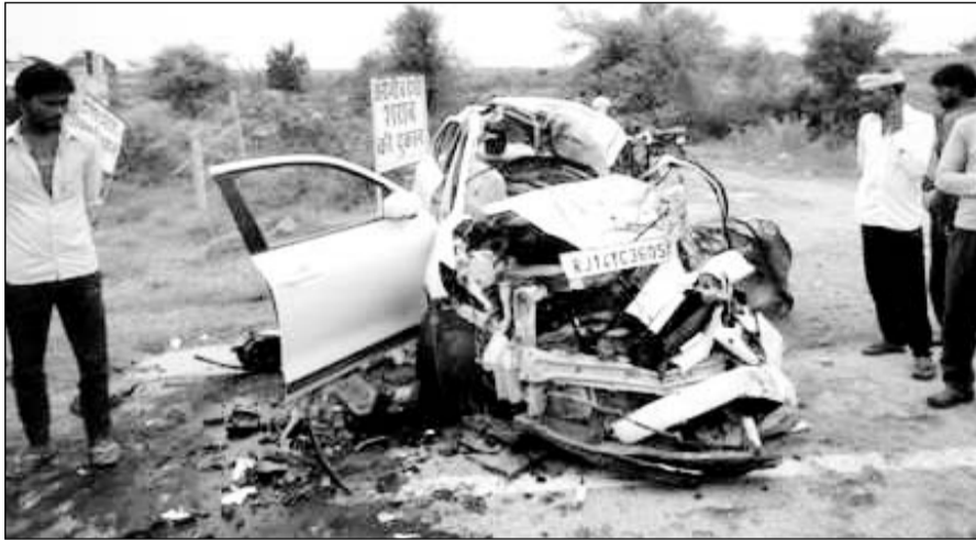
करौली के निकट मचानी गांव के पास दुर्घटना के बाद क्षतिग्रस्त कार।

करौली, (निर्स)। करौली-सरमथुरा सड़क मार्ग स्थित एनएच-23 मचानी गांव के पास एक ट्रक और कार में जोरदार भिड़ंत हो गई जिसमें कार सवार तीन युवकों की मौत हो गई, जबकि एक किशोरी घायल हो गई। मृतकों के शव करौली सामान्य चिकित्सालय लाये गये। जहां पोस्टमार्टम कर शव परिवार जनों के