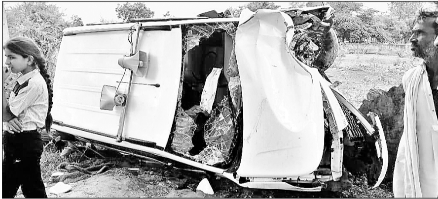
करौली के निकट मचानी गांव के पास दुर्घटना के बाद क्षतिग्रस्त कार।