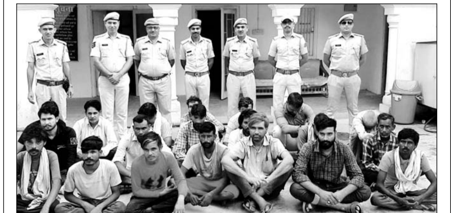
कोटपतली पुलिस की गिरफ्त में आरोपी।