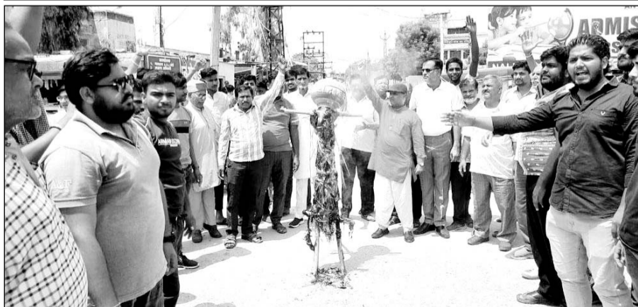
सुजानगढ़ में विहिप व बजरंग दल के कार्यकर्ताओं ने आतंकवाद का पूतला फूका।

विश्व हिंदू परिषद व बजरंग दल द्वारा आतंकवाद का पूतला फूका गया