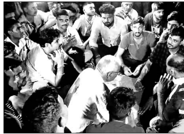
कोटपूतली में शव रखकर प्रदर्शन करते लोग।