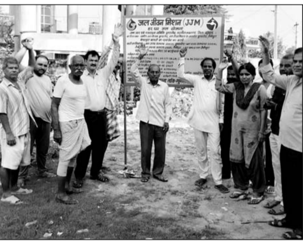
पानी की समस्या को लेकर ग्रामीणों ने नारेबाजी की।

उसके बाद से पानी की सप्लाई गड़बड़ होती है। अब बिल्कुल से बंद हो गई है। कभी मोटर जलने का बना तो कभी बिजली सप्लाई का बहाना बनाता रहता है। खुद ड्यूटी पर आता नहीं है। अपनी जगह आना आदमी से कार्य कर करता है जो पूर्ण रूप से सही नहीं होता है। जिससे के लिए कनिष्ठ अभियंता जलदाय विभाग को शिकायत कर दी।