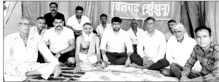
गोठड़ा में सीमेंट कंपनी के खिलाफ चल रहा धरना लगातार 177 रोज से जारी है।