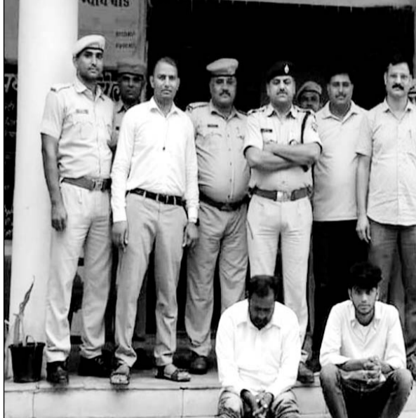
पुलिस ने आरोपी को गिरफ्तार कर पिता को हिरासत में लिया।

देसी कट्टे से गोली चलाकर युवती की हत्या कर दी और शव को गांव के ही एक कुएँ में फेंक दिया। आरोप लगा रहे हैं कि इस दौरान युवती के साथ दुष्कर्म भी किया गया तथा उसके चेहरे पर पहचान छिपाने के लिए तेजाब भी डाल दिया। हालांकि इन दोनों मामलों का खुलासा एफएसएल की रिपोर्ट आने के बाद ही हो सकेगा। आरोप है कि जब परिवार जनों को सुबह युवती घर में नहीं मिली तो परिजन थाने पहुंचे लेकिन पुलिस ने उनकी रिपोर्ट दर्ज नहीं की। 12 जुलाई को ग्रामीणों ने को जब कुएँ में शव पड़ा होने की जानकारी मिली तो इसकी सूचना नांदौती थाना पुलिस को दी गई। पुलिस ने युवती के शव को बाहर निकलवा कर हिंडौन के जिला अस्पताल पोस्टमार्टम के लिए पहुंचाया। मामले की जानकारी जब राज्यसभा सांसद डॉक्टर किरोड़ी लाल मीणा को लगी तो वह हिंडौन पहुंच गए तथा भाजपा कार्यकर्ताओं के साथ मोर्चरी के बाहर धरने पर बैठ गए। सांसद किरोड़ी मीणा ने आरोप लगाया कि दलित युवती को बदमाशों ने अपहरण कर सामूहिक दुष्कर्म किया तथा गोलू मारकर हत्या करने के बाद उस पर एएसड फेंक दिया और शव को कुएँ में डाल दिया। उन्होंने पुलिस पर पीछित परिवार की सुनवाई नहीं करने के भी आरोप लगाए। मामले