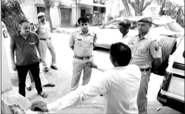
पुलिस ने मौके पर जाकर जांच की।