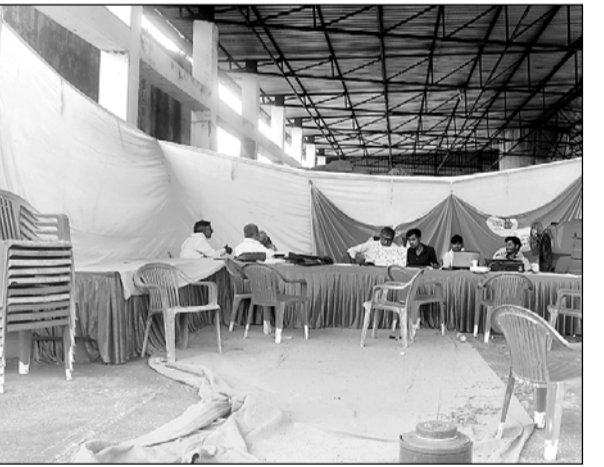
किशनगढ़ बास अनाज मंडी में लग रहे महंगाई राहत कैम्प में लोगों का इंतजार करते कर्मचारी।

■ 'ऐप नहीं चलने के कारण किसानों को ऑनलाइन गिरदावरी जमावंदी की नकल नहीं मिल पा रही है'