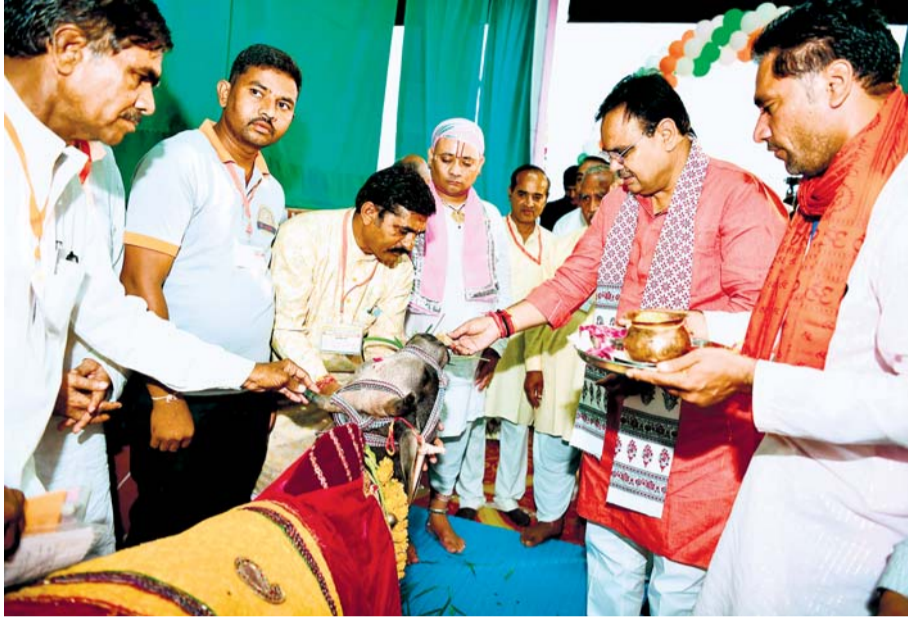
मुख्यमंत्री भजनलाल शर्मा ने शाहपुरा स्थित कोटड़ी में श्री सुरभि गौ-चिकित्सालय का उद्घाटन करने के बाद गौ-वंश की पूजा भी की। उनके साथ गोपालन मंत्री जोराराम कुमावत भी मौजूद थे।

मुख्यमंत्री ने कहा कि बजट में शाहपुरा जिले के विकास का पूरा ध्यान रखा गया है। उन्होंने कहा कि विभिन्न