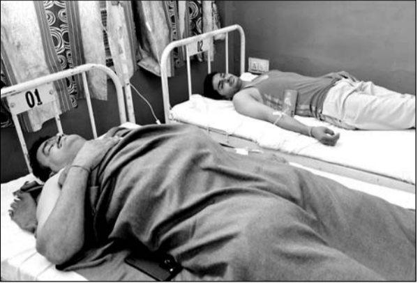
घायलों को उपचार के लिये अस्पताल में भर्ती कराया।