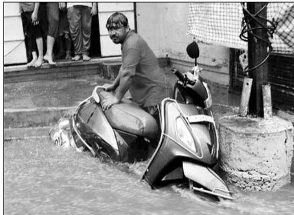
शहर में पानी में बहने से वाहनों को बचाने की जुगत करते क्षेत्रवासी।

डूंगरपुर, (नि.सं.)। विपरजाय तूफान के बाद बुधवार को प्रातः तक तो जमकर तपने के कारण आम जन परेशान था, लेकिन अचानक लगभग दो बजे काले घने बादल उमड़ कर आये और हवा के साथ तेज बारिश का दौर इस कदर शुरू हुआ कि देखते ही देखते भीतरी एवं बाहरी शहर की गलियां पानी से लबालब हो गईं। एक घण्टे की बारिश ने शहर को जमकर भीगेगा।