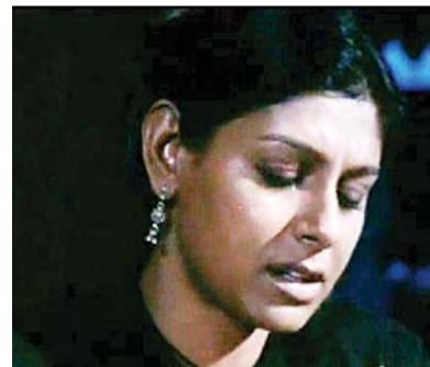
The presence of long and dangling jhumkas on both their ears are hard to miss as well.

Koutouleas claims that the cultivation of coffee by these farmers pose the major problem.