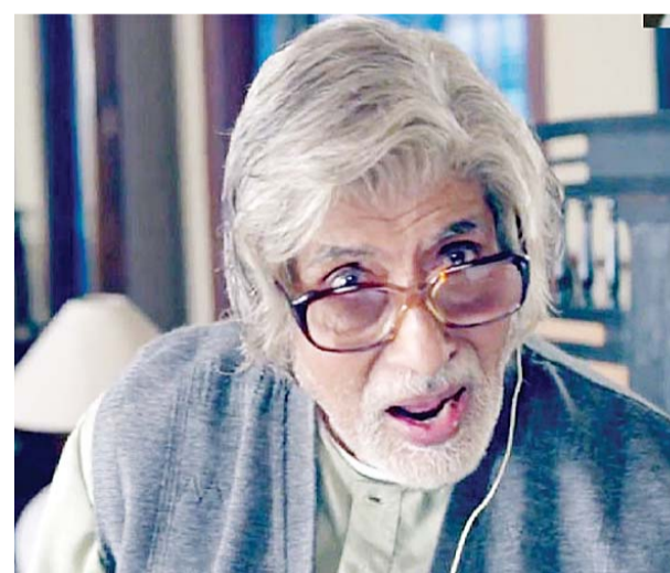
Amitabh Bachchan's Bhaskor Banerjee is a loud and domineering person, with an extra helping of hypochondria and attention-seeking shenanigans.

Soumitra Chatterjee's Shashanka Palit, on the other hand, is an opinionated but a much more reversed person. He introspects and thinks, something that we do not see Mr Banerjee doing a lot. This side of him does start getting on your nerve when you see his passive-aggressive side rear its ugly head during his fights with his daughter. Honestly, I do appreciate Bhaskor Banerjee's fighting style more - at least he puts all his card on the table