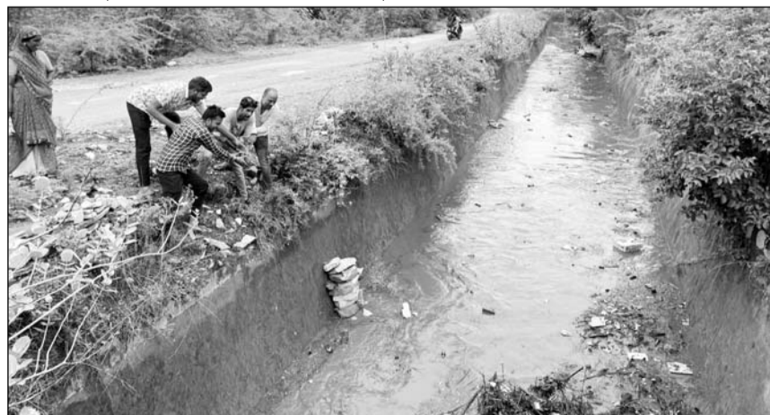
खारी फीडर के डिप्टी गांव में पहुंचने पर ग्रामीणों ने स्वागत किया।

पिछले 40 साल में यह दूसरा अवसर है कि जून महिने में नंदसमंद बांध छलका है। उसके बाद नंदसमंद के 2.5-2.5 फीट के चार-चार गेट खोलकर पानी बनास नदी में छोड़ा गया। इधर, खारी फिडर क्षतिग्रस्त होने के कारण पहले उसे दुरुस्त किया गया। जिसके बाद बुधवार सुबह नंदसमंद से खारी फीडर में पानी छोड़ा गया। फीडर का पानी 14 घंटे में करीब 32 किमी की दूरी तय कर शाम सात बजे के करीब पानी राजसमंद