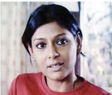
While Deepika Padukone can be seen sporting the smeared kajal look only once in Piku, Nandita Das' Megha is almost never seen without the smudged kohl eye make up in the movie Podokhhep.

Paring palazzos with long kurtis or a stole with a pair of jeans were not really a ground-breaking new revelations in the world of fashion at this point in time, but Piku's wardrobe did add a flair to this common practice and inspired many women to give this style another 'go' - especially on their way to work. At the same time, Piku's casual wears -