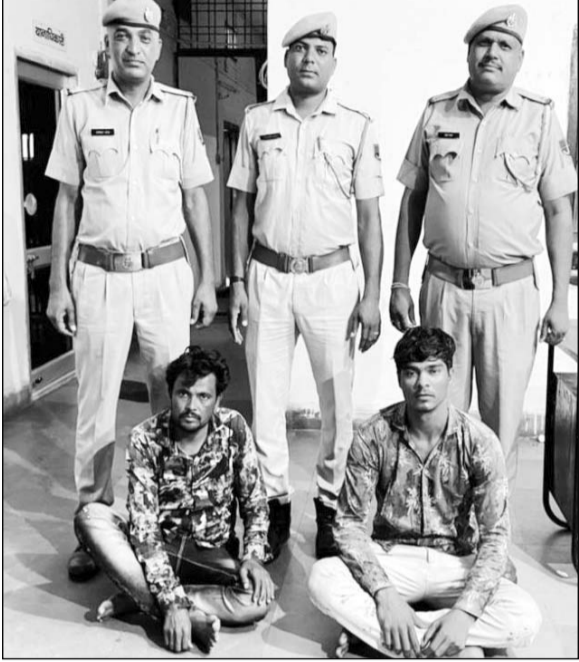
प्रताप नगर थाना पुलिस ने मामले में दो जनों को गिरफ्तार किया।