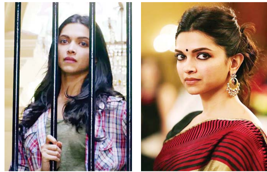
Piku's casual wears - like a loose shirt over a tee - were something regular people could very closely relate to.

And yes, Megha is almost never seen without the smudged kohl eye make up in the movie. While Nandita Das' ethnic take on modern clothes may not have made headlines in fashion magazines of its time, it did reflect (and resonate with) the style culture of real women in the early 2000s. And I have a feeling that it, in some or the other, rubbed off on director Shoojit Sirkar's mood board when he was first sat down to conceptualise Piku and how his heroine would look.