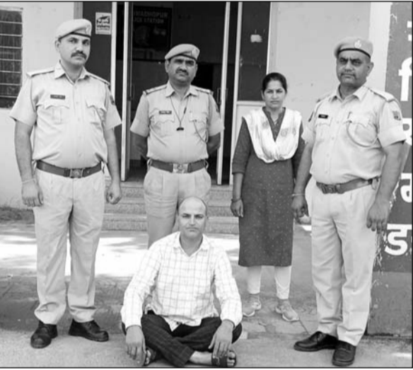
पुलिस ने फरार अपराधी को गिरफ्तार करने में सफलता हासिल की।

जुलाई 2008 को केंद्रीय कारागृह जयपुर से श्रीमधोपुर कोर्ट में पेशी के लिए लाया गया था इसी दौरान चालानी गार्ड को आरोपी चकमा देकर मौके से फरार हो गया था।