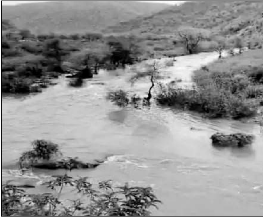
बरसात से नटनी का बारा सहित जयसमंद में पानी आने लगा।

तक आने वाली नहरों से अतिक्रमण को हटवाया जिससे पानी की आवक होने लगी है। बुधवार सुबह अलवर के सरिस्का क्षेत्र में अच्छी बारिश हुई। इसके कारण रुपारेल नदी में पानी आया। बालेटा क्षेत्र में सिलोबेरी बांध में पानी की आवक हुआ पानी काफी तेज बहाव से आया।