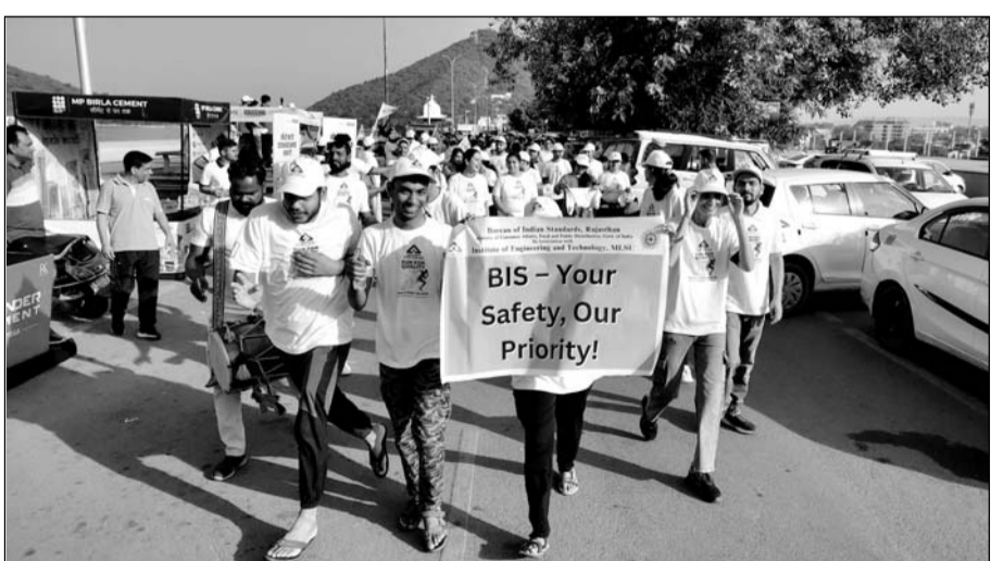
उदयपुर की फतेहसागर झील पर “रन फॉर क्वालिटी” का आयोजन हुआ।।