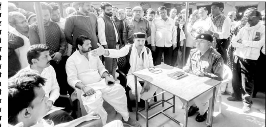
पांच मकानों में चोरी होने के बाद ग्रामीणों ने एस.डी.एम. को ज्ञापन दिया।