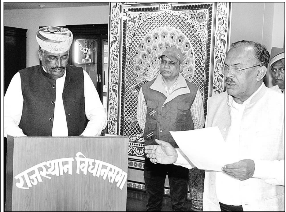
विधानसभा अध्यक्ष वासुदेव देवनानी ने उपचुनाव में निर्वाचित हुए सात नव निर्वाचित विधानसभा सदस्यों को शपथ दिलाई।

जयपुरा विधानसभा अध्यक्ष वासुदेव देवनानी ने मंगलवार को विधानसभा उपचुनाव में निर्वाचित हुए सात विधायकों को अपने कक्ष में विधानसभा सदस्य पद की शपथ दिलायी। सभी विधायकों ने हिंदी भाषा में विधानसभा सदस्य पद की शपथ ग्रहण की। इस अवसर पर देवनानी ने सभी नव निर्वाचित विधायकों को बधाई एवं