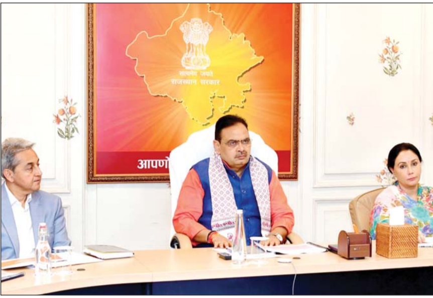
मुख्यमंत्री भजनलाल शर्मा ने महिला एवं बाल विकास विभाग की समीक्षा बैठक को संबोधित किया और अधिकारियों को आंगनबाड़ी केन्द्रों का सघन निरीक्षण करने और आवश्यक व्यवस्थाएं दुरुस्त करने के लिए निर्देश दिए।

मुख्यमंत्री ने शिक्षा सेतु योजना की समीक्षा की व अधिकारियों से कहा कि बीच में ही पढ़ाई छोड़ने वाली लड़कियों को शिक्षा की मुख्य धारा से जोड़ने वाले व्यक्तियों एवं संस्थाओं को प्रोत्साहित एवं पुरस्कृत किया जाए। मुख्यमंत्री ने कहा कि बालिकाओं को समुचित शिक्षा और सम्बल प्रदान करने के लिए ‘लाडो प्रोत्साहन योजना’ अहम है, जिसके तहत हमारी सरकार बेटों के जन्म से लेकर स्नातक शिक्षा पूरी करने तक एक लाख रुपये की राशि दे रही है। उन्होंने बताया, राज्य सरकार शीघ्र ही इसके अन्तर्गत 1 साथ 1 लाख लाभार्थियों को खातों में प्रति लाभार्थी 2500 रुपये की किस्त हस्तांतरित करेगी। उन्होंने यह भी बताया कि राज्य