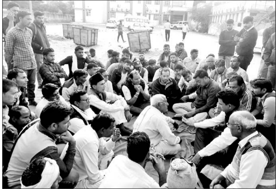
मुआवजे की मांग को लेकर ग्रामीणों ने धरना दिया।