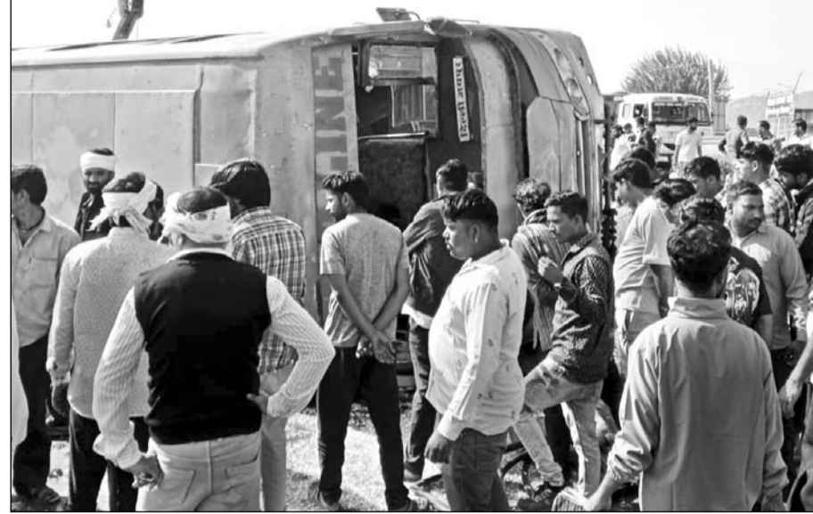
हादसे के बाद घायलों को अस्पताल ले जाकर उपचार कराया।