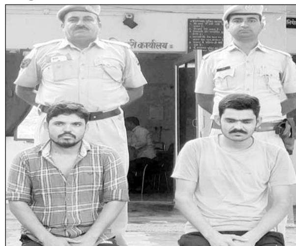
पुलिस की गिरफ्त में दुष्कर्म के आरोपी।