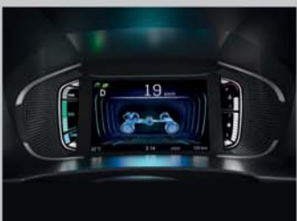
DIGITAL MULTI-INFORMATION DISPLAY

NEXA Safety Shield DUAL FRONT AIRBAGS ABS WITH EBD PEDESTRIAN PROTECTION COMPLIANCE COMPLIANT WITH - FULL FRONTAL IMPACT FRONTAL OFFSET IMPACT SIDE IMPACT