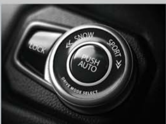
DRIVE MODE SELECTOR