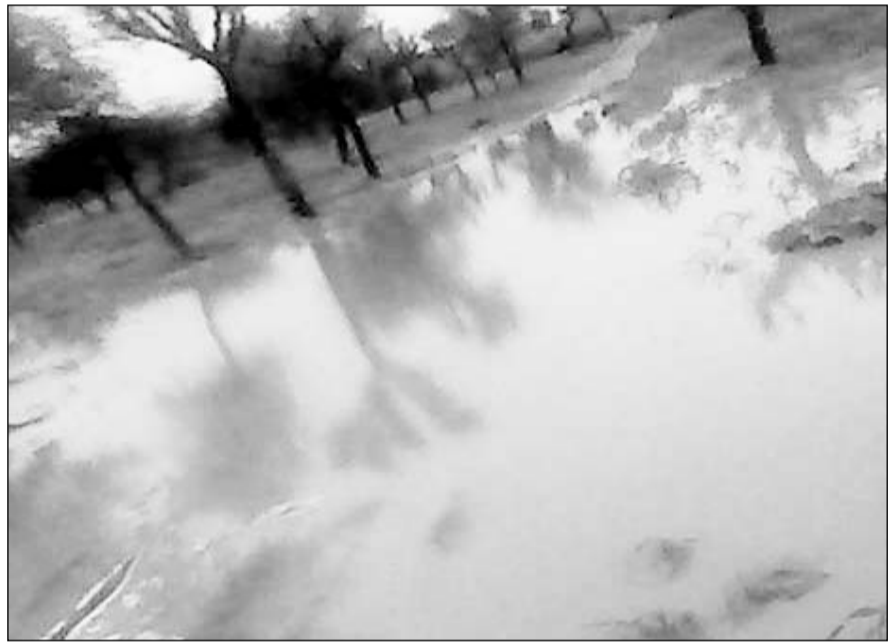
सादुलपुर में मूसलाधार वर्षा के चलते खेतों में भरा पानी।

सादुलपुर, (निसं)। सादुलपुर उपखंड के शहरी एवं ग्रामीण क्षेत्र में मानसून का दौर सक्रिय होने के चलते शनिवार को भाकरा के आसपास गाँवों में तेज मूसलाधार वर्षा हुई। शनिवार अलसुबह मौसम घनघोर घटाएँ छाई रही, बादलों की आवाजाही के बिच