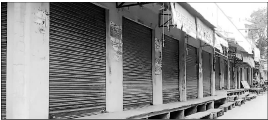
मांडल थाना क्षेत्र में तनाव की स्थिति के दौरान बाजार बंद रहे।

भीलवाड़ा, (निसं)। मांडल थाना क्षेत्र में भगवान की सवारी के दौरान डीजे साउंड बंद करने को लेकर दो समुदायों में विवाद हो गया और दोनों समुदाय के लोग आमने-सामने हो गए, जिससे तनाव की स्थिति बन गई। पुलिस ने कानून व्यवस्था कायम रखने के लिए अतिरिक्त सुरक्षा बल तैनात किया गया है। भीलवाड़ा के मांडल कस्बे में एकादशमी से पूर्व दशमी को परंपरागत तरीके से शोषणहाय धाम बड़ा मंदिर से भगवान चारभुजा नाथ का बेवाण निकलता है, जो की भजन कीर्तन के साथ निधत्त मार्ग से होते हुए पुनः बड़ा मंदिर पहुंचता है। कस्बे में हसन हुसैन के ताजिया भी निकलने वाले थे। वहीं,