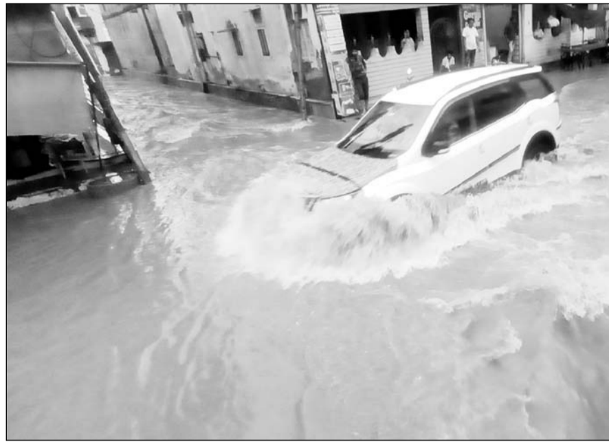
श्रीमाधोपुर में हुई मूसलाधार बारिश से निचले इलाकों व दुकानों में पानी भर गया।

श्रीमाधोपुर, (निसं)। कस्बे में 3 घंटे तक लगातार मूसलाधार बारिश सहित सुबह 8 बजे से लेकर 5 बजे तक साढ़े 3 इंच (85 एमएम) वर्षा दर्ज हुई। श्रीमाधोपुर खंडेला बाजार में घना नाला बहने से आमजन रुक सा गया जो करीब 2 घंटे तक आवागमन