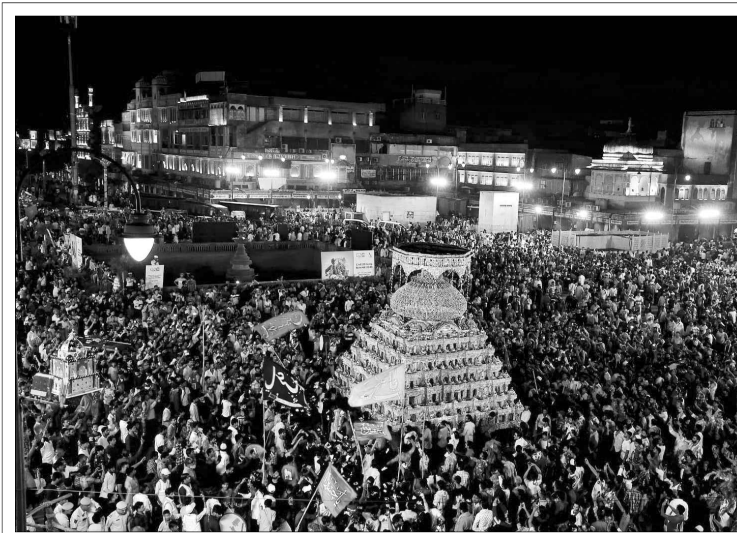
हजरत मुहम्मद साहब के नवासे इमाम हुसैन की शहादत की याद में शनिवार को मोहर्रम का योमे आशूरा मनाया गया। लोगों ने रोजे रखे, इबादत की, गरीबों को खाना खिलाया। उधर सभी मौहल्लों के ताजियों का बड़ी चौपड़ पर प्रदर्शन किया गया और उसके बाद शाम को इनको कारबला में सुपुर्दे खाक किया गया। हजरत इमाम हुसैन का जुलूस निकाला गया। इससे पहले मजलिस हुई और उसके बाद जुलूस पन्नीगरान, बांदी का नासिक, चार दरवाजा होता हुआ करबला पहुंचा। इस अवसर पर शहर की तमाम अंजुमनों ने जंजीरी मातम किया और इमाम हुसैन को खिराज अकीदत पेश की।