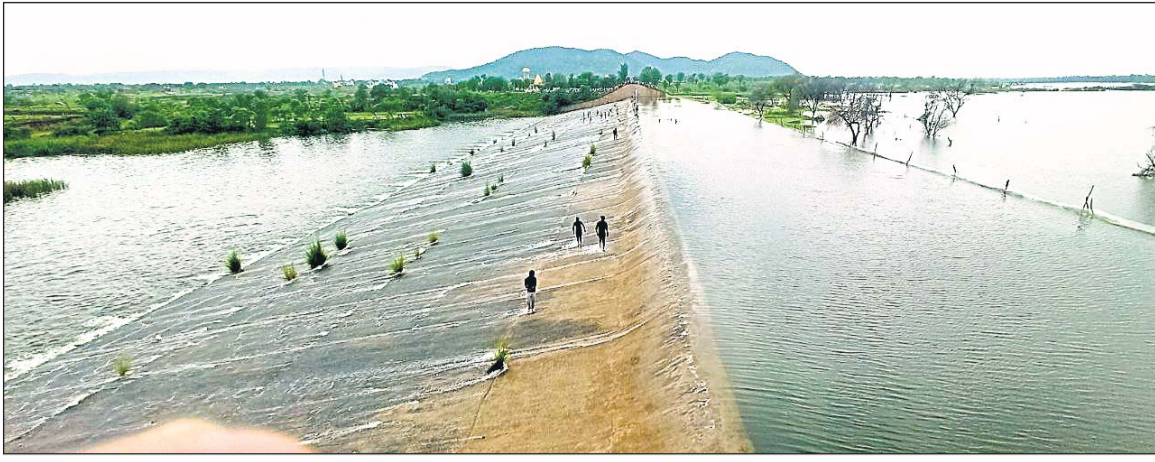
करीब दो दशक बाद जयपुर के कानोता बांध पर पानी की चादर चली।