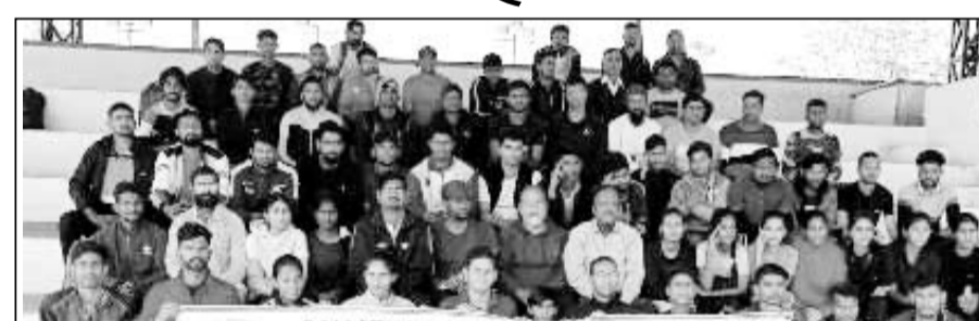
करोली में संचालित निःशब्द विद्यालय के बच्चों ने प्रतियोगिताओं में भाग लिया।