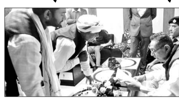
पर्यटन मंत्री विश्वेन्द्र सिंह (दाएं से पहले) ने जनसुनवाई कर समस्याओं के निराकरण के मौके पर दिये निर्देश