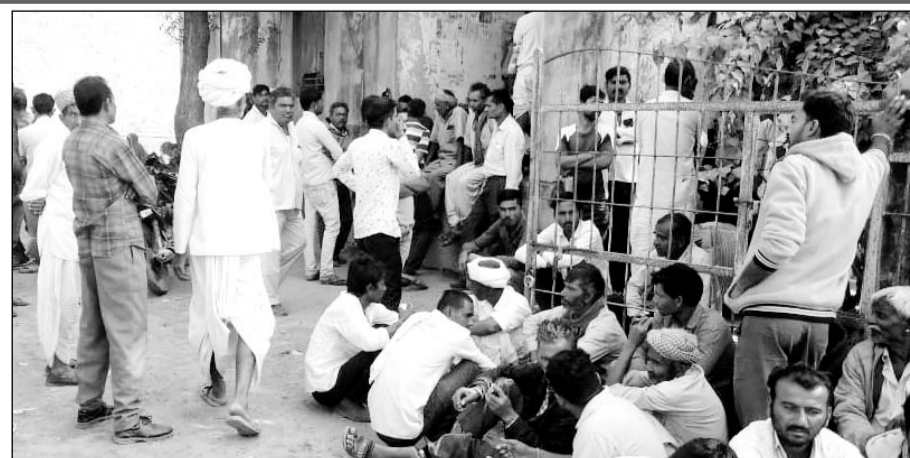
रेवदर में यूरिया खाद लेने के लिए किसानों की लम्बी कतार देखने को मिली।

रेवदर, (नि.सं.) रेवदर यूरिया खाद लेने के लिए किसानों ने सोमवार को कृषि क्रय विक्रय सोसायटी पर सुबह से किसानों की भीड़ उमड़ने लगी व कुछ ही समय में सैकड़ों की संख्या में किसानों का जमावड़ा लग गया। किसानों के द्वारा पूरे दिन भूखे-प्यासे यूरिया खाद के लिए कतार में लगे दिखे। एक बार तो देखते ही लगता था कि भले ही कितनी भी तकलीफ क्यों न सहनी पड़े पर यूरिया खाद लेकर ही जायेंगे पर शाम तक जिनकी भी यूरिया खाद मिला वे भी संतुष्ट नहीं दिखे आखिर यूरिया खाद वितरण को लेकर जानकारी के अनुसार एक किसान को दो कट्टे का वितरण किया जा रहा था। पर किसानों का कहना है कि सीजन की फसल को लेकर अन्य यूरिया के कट्टों के लिए अन्य कृषि विक्रेता के दुकानों पर जाकर दुग्ने दामों में यूरिया खाद