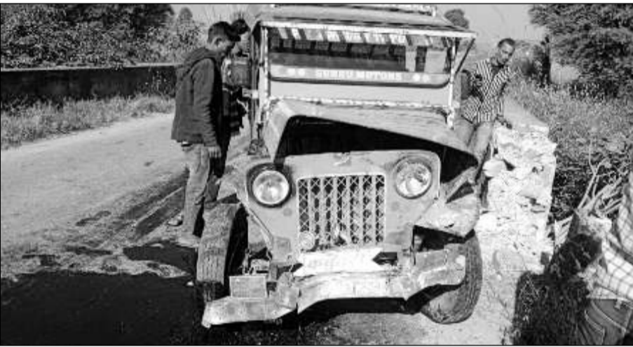
हादसे के बाद जीप क्षतिग्रस्त हो गई।

सपोटरा थाना पुलिस से मिली जानकारी के अनुसार सोमवार को प्रातः चौडक्या कला गांव से कुछ लोग एक जीप में सवार होकर टोडाभीम के पास एक तीये की बैठक में शामिल होने के लिए जा रहे थे जो जैसी ही कुडगांव सपोटरा सड़क मार्ग स्थित रत्नापुर पुलिस में जा पहुँची तो अनियंत्रित हो