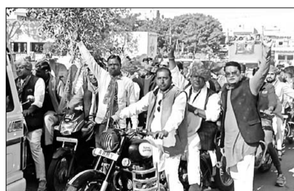
गंगापुर शहर में जनआक्रोश यात्रा के दौरान काफी भीड़ नजर आई।

गंगापुर शहर हृदय स्थल बालाजी चौक पर रात्रि चौपाल आयोजित की गई। भाजपा जन आक्रोश यात्रा पिछले 9 दिनों में 434 किलोमीटर लंबा सफर तय कर, 116 नुककड सभा एवं ग्रामीण रात्रि चौपाल, 153 स्वागत, 81 हजार लोगों से जनसंपर्क कर गंगापुर शहर में पहुंची। यात्रा रथ का प्रातः काल 9 बजे विधिवत पूजन कर सीताराम जी मंदिर पुरानी अनजान मंडी से प्रारंभ होकर उदई मोड, सालौती मोड, सैनिक नगर, न्यू टुक यूनिटन, इंदगाह मोड सभापति निवास, नसिया कॉलोनी, सुरसागर, बजरिया, व्यापार मंडल होते हुए बालाजी चौक पहुंची जहां पर विशाल रात्रि चौपाल आयोजित हुई। नसिया कॉलोनी में भाजपा कार्यकर्ताओं द्वारा