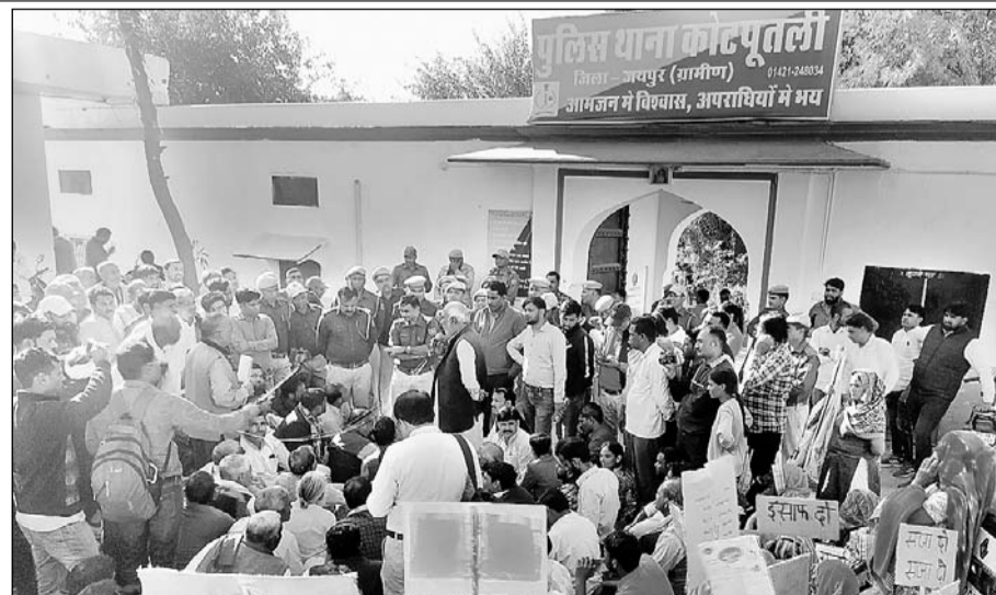
कोटपूतली में पुलिस थाने का घेराव कर अधिकारियों को खरी-खोटी सुनाते लोग।