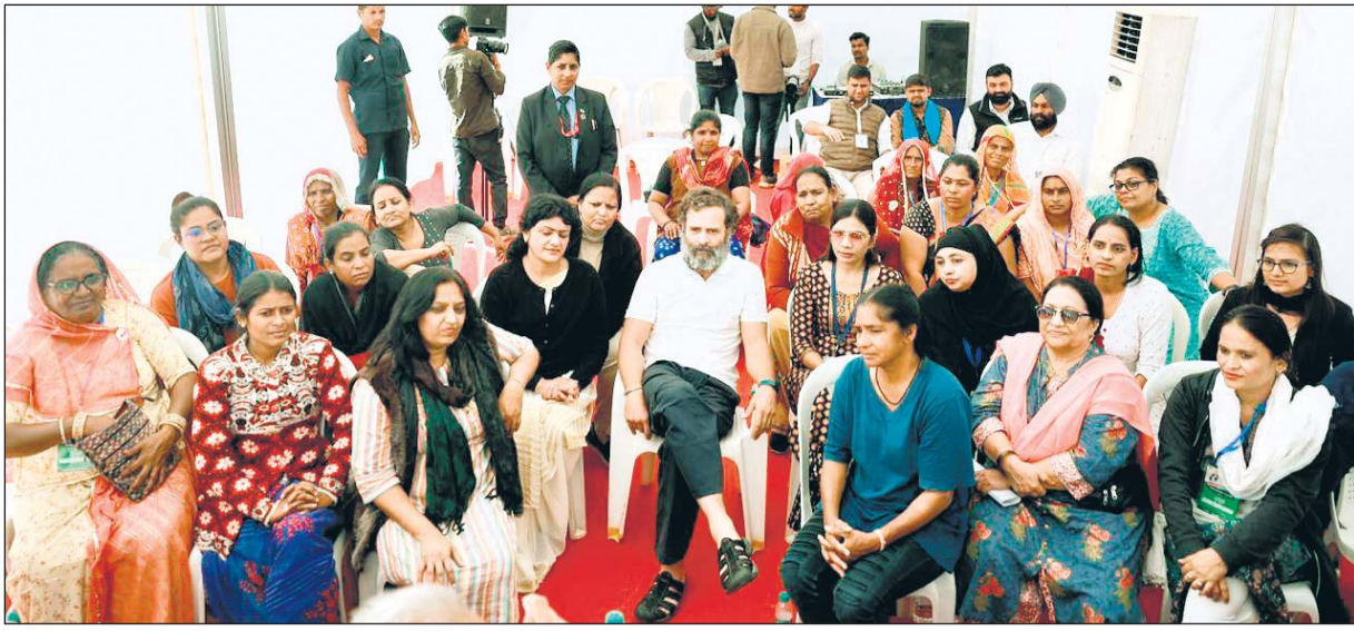
भारत जोड़ो यात्रा में सोमवार का दिन पूर्णतः महिलाओं को समर्पित रहा। यात्रा के दौरान सवाईमाधोपुर के खिजूरी गाँव में राहुल गांधी स्थानीय महिलाओं एवं महिला कांग्रेस कार्यकर्ताओं के साथ सहजता से बातचीत करते नजर आये। इस बीच कुछ मौके ऐसे भी आये जब उन्होंने महिला कार्यकर्ताओं के साथ हसी-ठिठोली भी की।