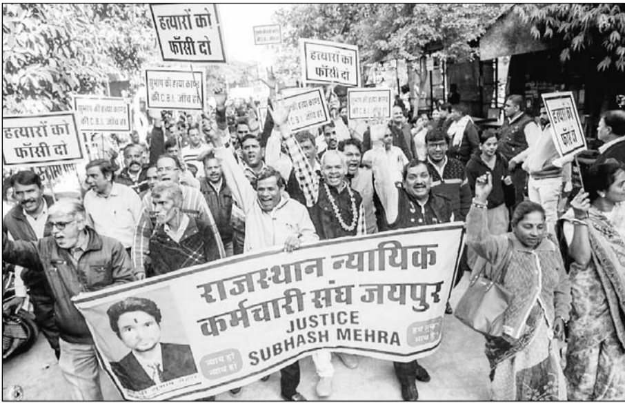
न्यायिक अधिकारी के घर कोर्ट कर्मचारी की जलने से हुई मौत की जांच सीबीआई से कराने की मांग को लेकर न्यायिक कर्मचारी संघ ने सोमवार को रैली निकाली।