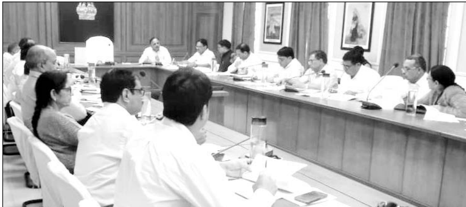
जिला निष्पादन समिति साक्षरता की बैठक आयोजित की गई।