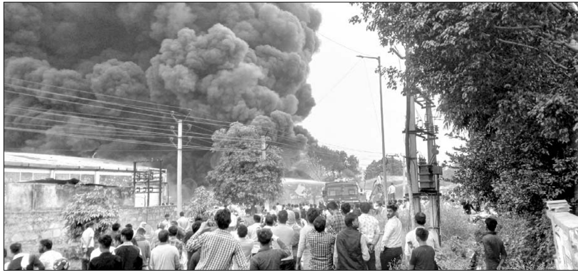
बहरोड़ के रीको इंडस्ट्रीज एरिया फेस-2 में स्थित प्लास्टिक के पाइप बनाने वाली फैक्टरी के प्लांट में भीषण आग लग गई।

■ फैक्टरी की दीवार के पास ही ग्रीन लैम कंपनी के प्लैट्स भी हैं, करीब 40 प्लैट को खाली करवाया