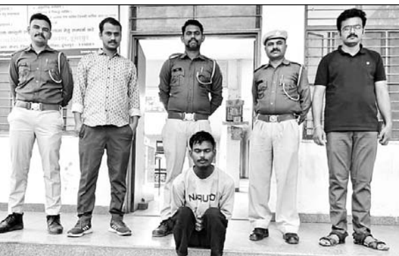
दोस्त की चाकू मारकर हत्या करने वाले आरोपी को गिरफ्तार किया।

डूंगरपुर, (निसं)। जिले क गामड़ी आहड़ा गांव में दीपावली के पर्व पर दो दोस्तों में मामूली विवाद पर हत्या करने के मामले में अभियुक्त को गिरफ्तार किया है। वहीं एक नाबालिग को निरुद्ध किया। हत्या में प्रयुक्त चाकू को भी बरामद कर लिया है।