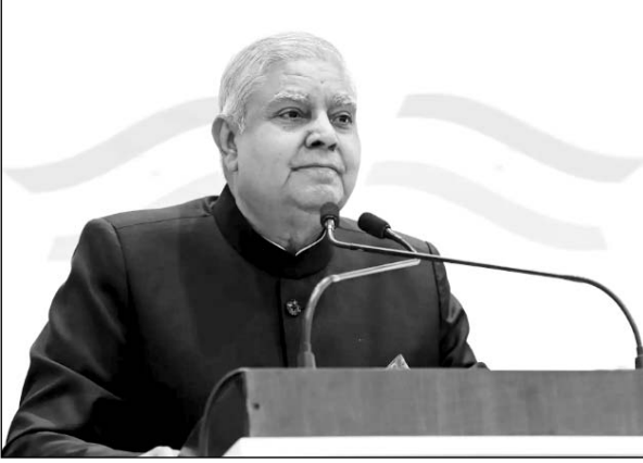
उप राष्ट्रपति जगदीप धनखड़