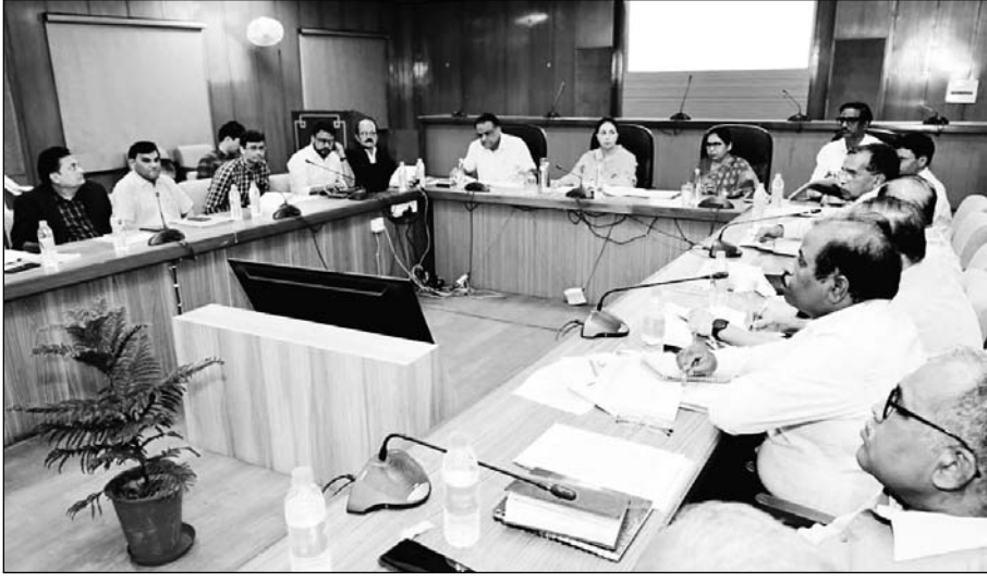
उपमुख्यमंत्री दिया कुमारी ने मंगलवार को निर्माण भवन में आयोजित सार्वजनिक निर्माण विभाग की समीक्षा बैठक को संबोधित किया।

रिपोर्ट प्रस्तुत करेंगे। उपमुख्यमंत्री ने बजट घोषणाओं, एनएचआई, आरएसआरडीसी, आरएसएचए, सीआरआईएफ सहित विभिन्न प्रोजेक्ट्स की गति बढ़ाने और