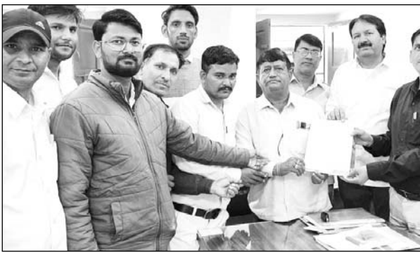
गृहमंत्री एवं सूचना एवं जनसंपर्क मंत्री भजनलाल शर्मा के नाम जिला कलेक्टर को अपनी मांगों का ज्ञापन सौंपा

के साथ ऐसी घटनाएं सामने आ रही हैं जो बड़ी चिंता का विषय हैं। देश के संविधान में चौथा स्तंभ कहे जाने वाले मीडिया पर आज लगातार हमले हो रहे हैं, जिससे पत्रकार आज