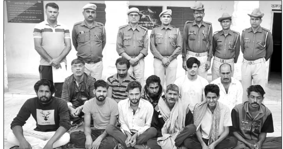
पुलिस थानों की 39 टीमों ने दबिश देकर बदमाशों को पकड़ा।

डीडवाना, (निसं)। लंबे समय से फरार चल रहे बदमाशों के खिलाफ मंगलवार को डीडवाना पुलिस ने बड़ी कार्रवाई की।