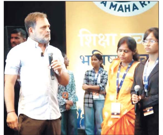
कांग्रेस के वरिष्ठ नेता राहुल गांधी ने कोटा के दशहरा मैदान से पेपर लोक मामले में छात्रों से संवाद अभियान की शुरुआत की है।

मध्यम से इसकी जानकारी दी। जारी सलाह के अनुसार, भारतीय नागरिक और सैन्य विमानों के लिए पाकिस्तानी हवाई क्षेत्र का उपयोग प्रतिबंधित रहेगा। नया प्रतिबंध 16 जून को शाम से प्रभावी होकर 24 जुलाई की सुबह तक लागू रहेगा।