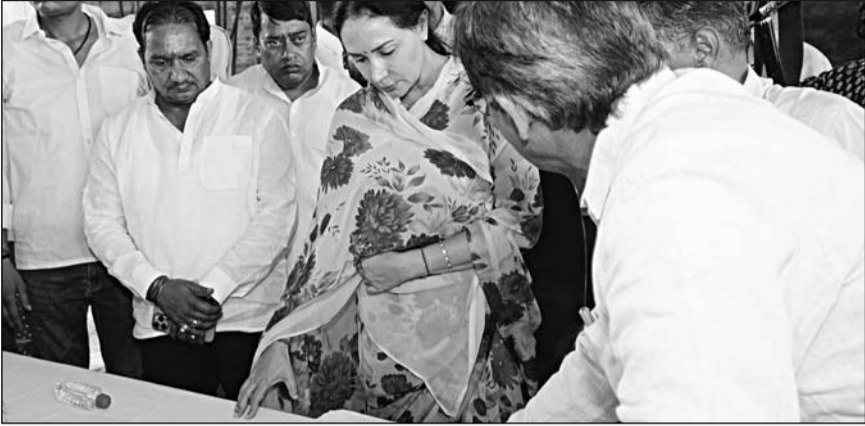
उपमुख्यमंत्री दिया कुमारी ने हॉस्पिटल का निरीक्षण कर निर्माण कार्य की प्रगति का जायजा लिया।

जयपुर। उपमुख्यमंत्री दिया कुमारी ने बुधवार को 'प्रगति पथ यात्रा' कार्यक्रम के अंतर्गत विद्याधर नगर विधानसभा क्षेत्र में निर्माणाधीन सैटेलाइट हॉस्पिटल का निरीक्षण कर निर्माण कार्य की प्रगति का जायजा लिया। इस दौरान उन्होंने संबंधित अधिकारियों को निर्माण कार्य में