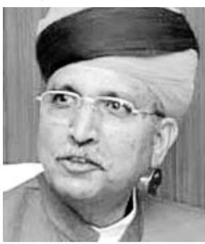
भाजपा प्रत्याशी अर्जुनराम मेघवाल।