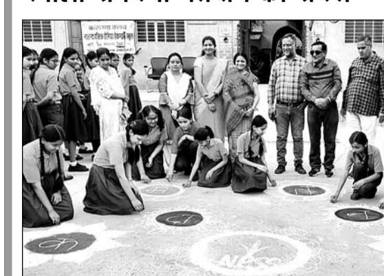
बच्चों ने सजाई रंगोली, अभिभावकों को लिखी मतदान करने की पाती।