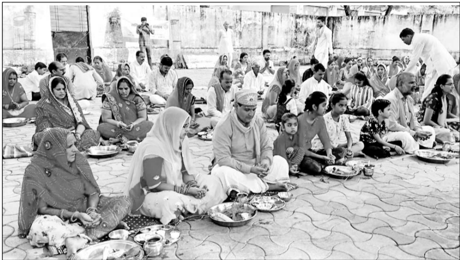
राजसमंद में केदारेश्वर महादेव परिसर हाथीनाडा में पार्थिव शिवलिंग का पूजन व अभिषेक किया।