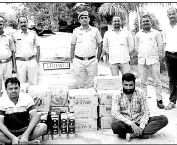
साबला पुलिस ने शराब के साथ दो आरोपियों को गिरफ्तार किया।