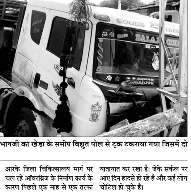
राजसमंद-भीलवाडा फोरलेन वीरभानजी का खेडा के समीप विद्युत पोल से टकराया गया जिसमें दो जने घायल हा गये।

राजसमंद, (कास)। जिला मुख्यालय के राजसमंद-भीलवाडा फोरलेन पर भीलवाडा की ओर से तेज गति से आ रहा ट्रक बेकाबू होकर वीरभानजी का खेडा के समीप स्थित विद्युत पोल से जा टकराया। हादसे में ट्रक की टक्कर से विद्युत पोल क्षतिग्रस्त हो गया। मगर गनीमत यह रही कि बिजली के तार नहीं टूटे और पोल झुककर उठर गया जिससे बड़ा हादसा नहीं होते टल गया। हादसे