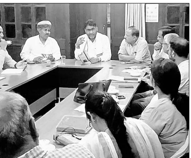
उदयपुर में लम्पी की रोकथाम के लिए सकिट हाउस में मंत्री रामलाल जाट ने अधिकारियों की बैठक ली।

जिला प्रभारी मंत्री एवं राजस्व मंत्री रामलाल जाट न अधिकारियों को पंचायत समिति की बैठकों और ग्राम सभाओं में प्रभावी रूप से समस्त जनप्रतिनिधियों, सरपंचों, उप सरपंचों, वार्ड पंचों, किसानों, समाजसेवियों एवं स्वयं सेवी संस्थाओं को लम्पी रोग के प्रति जागरूक करने के निर्देश दिए। मंत्री जाट ने इससे सम्बंधित पम्पलेट प्रकाशित कर जिलेभर में वितरित करने हेतु निर्देशित किया। इस अवसर पर मंत्री रामलाल जाट ने कहा कि हमें इस रोग की रोकथाम के लिए भी कोरोना के अनुभवों से सीख लेनी चाहिए। उन्होंने बीमार पशुओं को