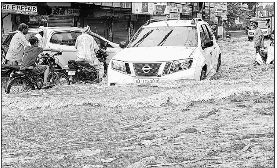
बारिश के बाद दर्जनों दुकानों और शहर के निचले इलाकों में पानी भर गया।