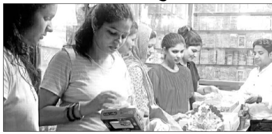
पावटा कस्बे के बाजार में राखी खरीदती महिलाएं।

पावटा, (निसं)। रक्षाबंधन पर्व के लिए राखी की दुकानें सज गई हैं। त्योहार के लिए सजे बाजार में आई राखियों आकर्षण का केंद्र बनी हुई हैं।