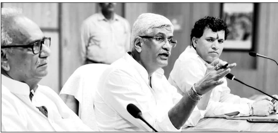
जोधपुर के डीआरडीए हॉल में मंत्रियों ने लंपी स्कीन बीमारी को लेकर जानकारी ली।

रविवार को बैठक के बाद मीडिया के साथ अनौपचारिक बातचीत में केन्द्रीय मंत्री शेखावत ने कहा कि गुजरात के रास्ते से आकर पिछले दो महीने में पश्चिमी राजस्थान के लगभग सभी जिलों में लंपी वायरस कहर बरपा है। हजारों गायों की मौत हो चुकी है। यदि पश्चिमी राजस्थान का आंकड़ा उठाकर देखें तो लगभग एक लाख से ज्यादा पशुघन इससे संक्रमित