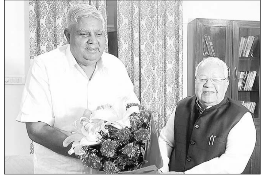
राज्यपाल कलराज मिश्र ने रविवार को नव निर्वाचित उप राष्ट्रपति जगदीप धनखड़ से व्यक्तित्व मुलाकात कर बधाई और शुभकामना दी। उन्होंने उम्मीद जताई कि उप राष्ट्रपति के रूप में धनखड़ का कार्यकाल संवैधानिक परंपरा और मूल्यों को और दृढ़ता प्रदान करेगा।

जयपुर, (का.सं.)। मुख्यमंत्री अशोक गहलोत ने नई दिल्ली के राष्ट्रपति भवन में आयोजित नीति आयोग की शासी परिषद की सातवीं बैठक में केन्द्र सरकार से पूर्वी राजस्थान नहर परियोजना को राष्ट्रीय परियोजना घोषित करने सहित विभिन्न केन्द्र प्रवर्तित योजनाओं में केन्द्र की आर्थिक सहायता बढ़ाने की मांग की है।