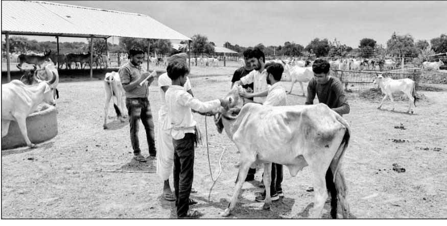
सांचौर के निकट गोधाम पथमेड़ा में गुजरात से आई चिकित्सा टीम ने गायों का टीकाकरण किया।

सांचौर, (निस)। सांचौर क्षेत्र में स्थित गोधाम पथमेड़ा जहां पर लंपी बीमारी की वजह से गौवंश खतरे में है। क्षेत्र में स्थाई इलाज के अभाव में पांच सौ से अधिक गौवंश की मौत हो गई है एवं गौशालाओं के समक्ष गायों को इस महामारी से बचाने की चुनौती पैदा हो गई है। पालडी स्थित गौशाला में सबसे अधिक इस महामारी से गौवंश शिकार हुआ है जिसमें करीब 350 के करीब गाय इस महामारी की चपेट में आ चुकी है। चिकित्सा विभाग की टीम लगातार प्रयास करके स्वस्थ गौवंश का टीकाकरण कर रही है।