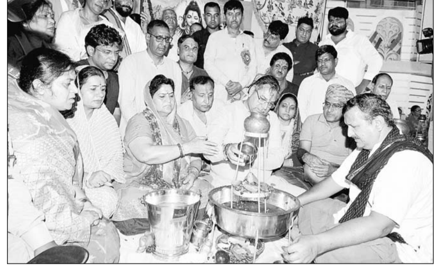
जयपुर में रॉयल हवेली, स्टेच्यु सर्किल पर श्री शिव महापुराण कथा समिति की ओर से महारुद्राभिषेक कार्यक्रम में भाजपा प्रदेशाध्यक्ष डॉ. सतीश पूनिया ने महारुद्राभिषेक किया। साथ ही 251 जोड़ों ने भी सामूहिक महारुद्राभिषेक किया। आजादी के 75वें अमृत महोत्सव के उपलक्ष्य में कार्यक्रम में मौजूद सभी शिव भक्तों ने हाथों में तिरंगा लेकर हर घर तिरंगा अभियान को बड़े स्तर पर करने का संकल्प लिया।