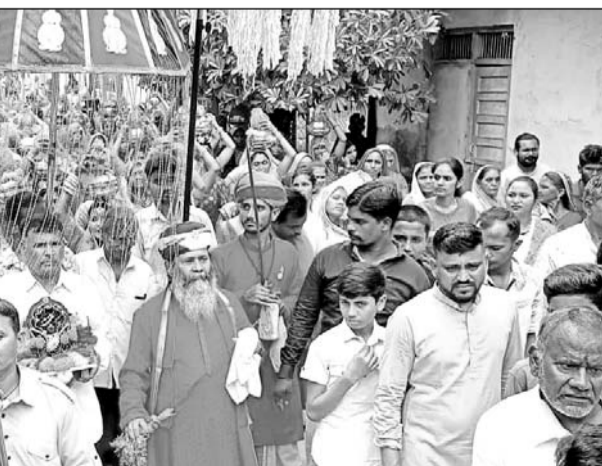
राजपुर में कल्लाजी जन्मोत्सव पर शोभायात्रा निकाली।