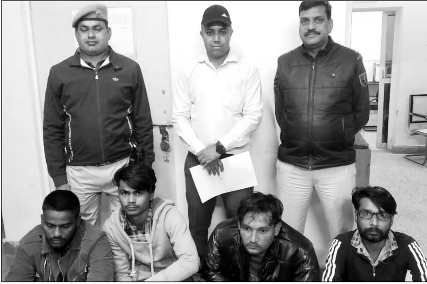
पुलिस ने ब्रांडेड कंपनियों के नकली शैंपू बनाने के मामले में चार आरोपियों को गिरफ्तार किया।

अजमेर, (कासं)। पुलिस सदर थाना कोतवाली ने गुरुवार को बड़ी कार्रवाई करते हुए अजमेर में ब्रांडेड कंपनियों के नकली शैंपू बनाने के मामले में चार आरोपियों को गिरफ्तार किया है। पकड़े गए युवक आगरा (उत्तर प्रदेश) के रहने वाले हैं और खाईलैंड मार्केट स्थित एक होटल में नकली शैंपू तैयार कर रहे थे। पुलिस को इस कार्रवाई से दरगाह इलाके और आसपास के भीड़भाड़ वाले बाजारों में नकली शैंपू बेचने का कालाधंधा उजागर हुआ है।