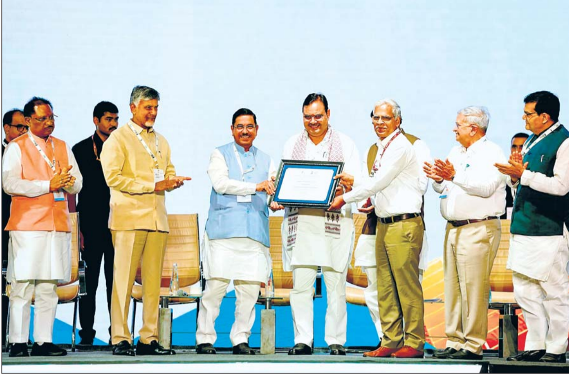
गुजरात के गांधी नगर में आयोजित चौथे ग्लोबल रिन्युएबल एनर्जी इन्वेस्टर्स मीट में राजस्थान के मुख्यमंत्री भजनलाल को अवॉर्ड प्रदान किया गया। रिन्युएबल एनर्जी के कुल उत्पादन में राजस्थान को देश भर में दूसरा स्थान मिला है।