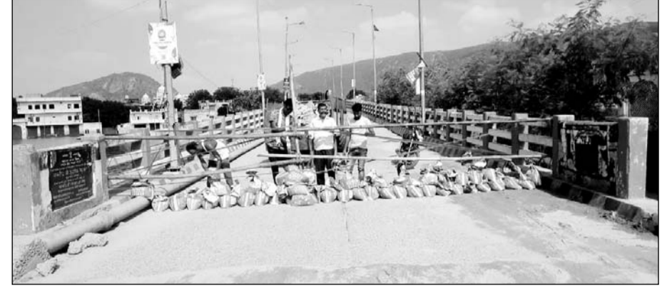
पुष्कर पालिका के कर्मचारियों ने पुल को बंद कर दिया।

पुष्कर, (निसं)। पुष्कर सरोवर के पीछे बनी पुलिया के क्षतिग्रस्त होने के कारण इस पर आवागमन बंद कर दिया है। सरोवर के पीछे ब्रह्मा मंदिर और अन्य मार्गों तक परिक्रमा होते हुए रास्ते को बंद कर दिया गया है। पुष्कर पालिका ने बेरिकेटिंग लगाकर रास्ते को बंद कर दिया है। रामपुल के