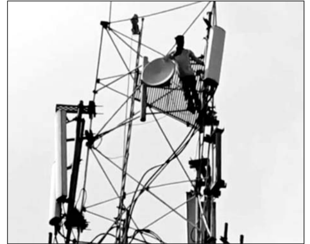
कोतवाली थाना क्षेत्र में एक युवक मोबाइल टावर पर चढ़ गया।

भीलवाड़ा, (निसं)। शहर के कोतवाली थाना क्षेत्र में एक युवक मोबाइल टावर पर चढ़ गया। युवक अपनी पत्नी के छोड़कर नाते चले जाने और समुद्र द्वारा सामाजिक फैसला नहीं करने की लोकाचारा नाराज था।