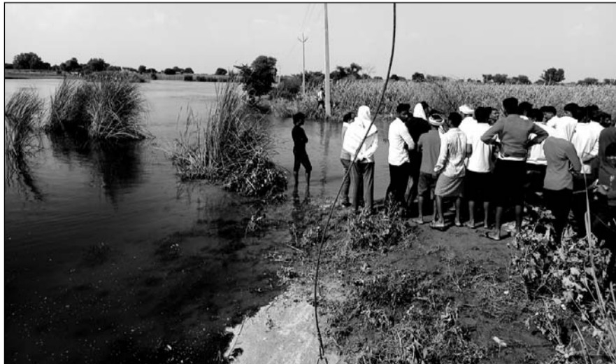
पुलिस ने एसडीआरएफ टीम के साथ पानी में डूबे किशोर की तलाश शुरू की।

किशोर डूबने लगा तो, उसके भाई व अन्य दोस्तों ने बचाने का भी प्रयास किया