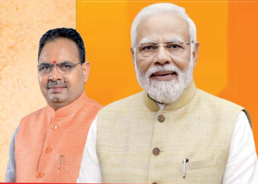
श्री भजनलाल शर्मा माननीय मुख्यमंत्री

युवाओं को नौकरी, विकास पथ पर गतिमान आपणों अग्रणी राजस्थान