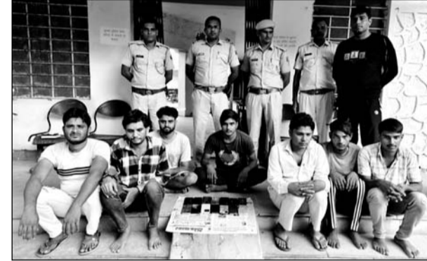
पुलिस ने सायबर ठगी के आरोप में सात जनों को गिरफ्तार किया।

जानकारी के अनुसार जिला डींग में सोशल मीडिया पर पैन्सिल पैकिंग का जांब दिलाते, रेलवे में 30 हजार रुपये मासिक वेतन पर जांब दिलाते, सस्ते दामों में ट्रैक्टर-गाड़ी व हार्डवेयर का सामान बेचने का विज्ञापन डालकर तथा जे.जे. कम्प्यूटेशन एप पर गिफ्ट देने के नाम पर लोगों को निशाना बनाने, भोले-भाले लोगों से सैक्स चेट व वीडियो कॉल कर उनका न्यूड वीडियो बनाकर उसे वायरल करने की धमकी देकर ठगी करने के आरोप में जुरहरा थाना पुलिस ने स्पेशल टीम की मदद से सायबर ठगी के आरोप में 7 आरोपियों को गिरफ्तार करते हुए तीन किशोरों को भी निरुद्ध किया है। वहीं पुलिस ने आरोपियों के कब्जे से 14 एण्ड्रॉइड मोबाइल फोन व 20 फर्जी