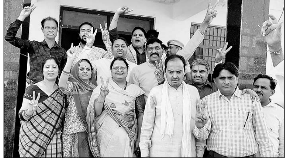
उपचुनाव में जीत के बाद भाजपा पार्षद खुश नजर आए।

क्रॉस वोटिंग के चलते कांग्रेस की डूबी नैया