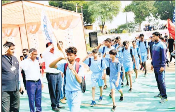
चाकसू में जिला स्तरीय खो-खो खेलकूद प्रतियोगिता का शुभारंभ हुआ।