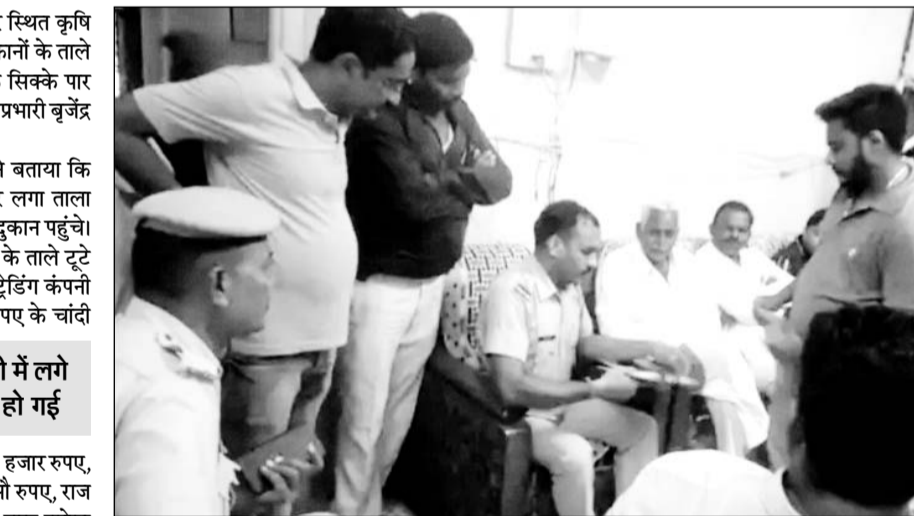
कैलाश नगर स्थित कृषि उपज मंडी यार्ड में पुलिस ने मौका मुआयना किया।