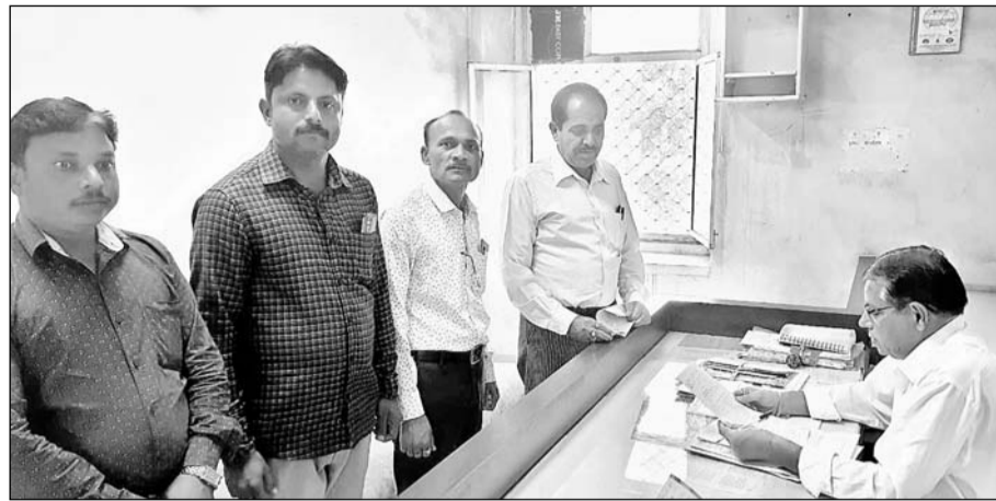
भारतीय ट्रेड यूनियन केंद्र सीटू के प्रतिनिधियों ने कलेक्टर को ज्ञापन सौंपा।

■ श्रमिकों को अन्य स्थान पर काम करने के लिए मजबूर किया जा रहा है