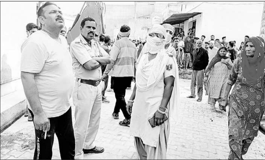
वार्ड 20 मोहल्ला नरडियान में अवैध अतिक्रमण हटाने के दौरान महिलाओं ने विरोध किया।

जैसे ही प्रशासनिक अधिकारी नायब तहसीलदार ने पालिका टीम के सहयोग से पीला पंजा चलाने की तैयारी प्रारंभ करनी चाही तो मौके पर उपस्थित अवैध अतिक्रमणकारी ने प्रशासन से