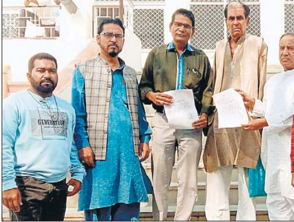
राजस्थान उर्दू अकादमी ने कला एवं संस्कृति मंत्री के नाम जिला कलेक्टर को ज्ञापन दिया।

अकादमी की एक चुनी हुई टीम ही हर मुशायरे में रहती है, टॉक को हर बार उर्दू अकादमी के कार्यक्रमों से वंचित रखा गया है, क्या उर्दू पर टॉक का कोई नही