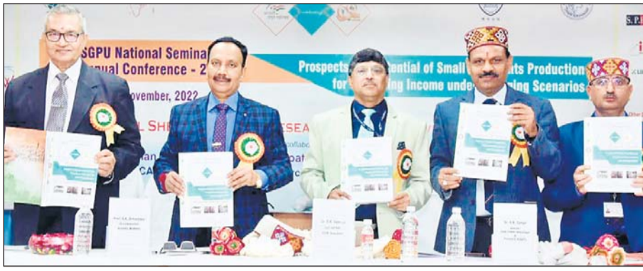
केन्द्रीय भेड़ एवं ऊन अनुसंधान संस्थान अठिकानगर में तीन दिवसीय राष्ट्रीय सेमिनार का शुभारम्भ हुआ।

राजस्थान उर्दू अकादमी ने कला एवं संस्कृति मंत्री के नाम जिला कलेक्टर को ज्ञापन दिया। अकादमी की एक चुनी हुई टीम ही हर मुशायरे आयोजित किए गए, जिसमें हमेशा टॉक और टॉक के शायर व आदीबों की अन्देखी की गई है। राजस्थान उर्दू