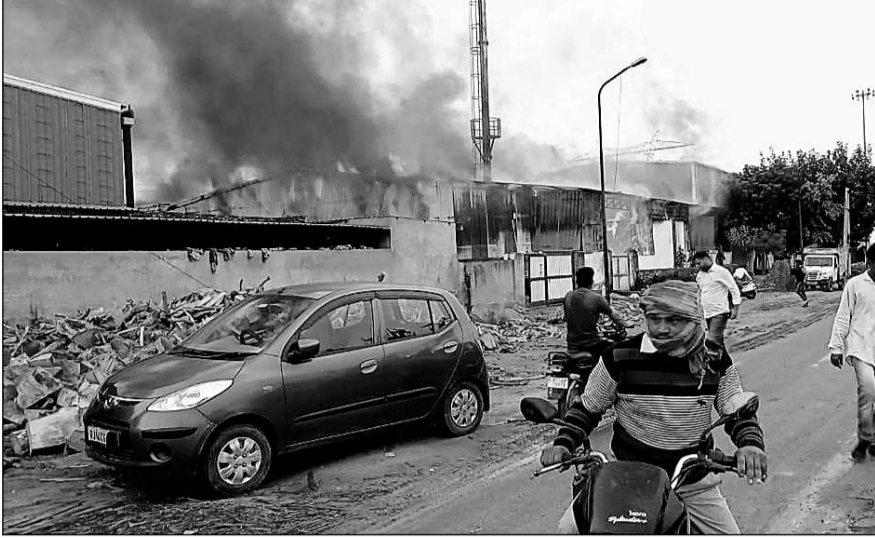
हवा चलने की वजह से धू-धू कर जलने लगी प्लाईवुड फैक्ट्री।

सूचना पर दमकल की 8 गाड़ियां मौके पर पहुंची तथा आग पर पानी डालकर काबू पाने का प्रयास किया लेकिन आग इतनी फैल चुकी थी जिस पर काबू पाना कोई आसान काम नहीं था। बताया जा रहा है कि गोविंद प्लाईवुड फैक्ट्री में शाम करीबन 5 बजे अचानक शॉर्ट सर्किट से आग लग गई थी जिसके बाद आग की लपटें देख मौके पर लोगों की भीड़ लग गई। हवा चलने की वजह से आग की तीव्रता इतनी तेज थी कि कुछ ही देर में आग ने विकल रूप धारण कर लिया और फैक्ट्री धूँ-धूँ कर जल उठी। दूर दूर तक तक आग की लपटें दिखाई दे रही थी।