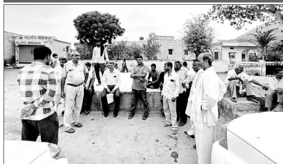
पुलिस ने परिजनों की मौजूदगी में पोस्टमार्टम की कार्रवाई की।

सड़क पर लड़ रहे सांडों ने बाइक को टक्कर मार दी थी