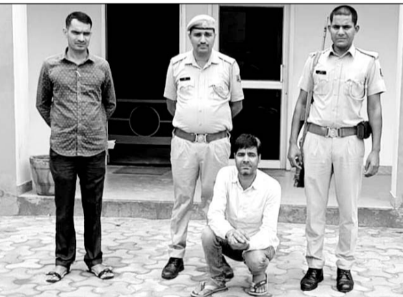
राजगढ़ पुलिस ने फरार एक हजार रूपये के इनामी को गिरफ्तार किया।