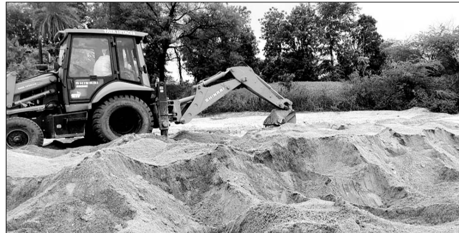
जेसीबी मशीन से लगभग 650 टन खनिज बजरी को खुर्द-बुर्द किया गया।