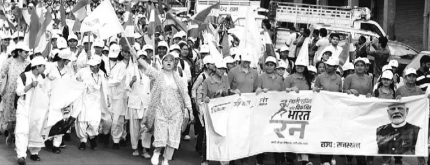
जयपुर में शुकुवार को 'नारी शक्ति फॉर विकसित भारत रन' का आयोजन किया गया।

जयपुर। महिला सशक्तिकरण और 'विकसित भारत' के संकल्प को जन-जन तक पहुंचाने के उद्देश्य से शुकुवार को जयपुर में 'नारी शक्ति फॉर विकसित भारत रन' का आयोजन किया गया। भारत सरकार के युवा कार्यक्रम एवं खेल मंत्रालय के तत्वावधान में 'माय भारत' द्वारा आयोजित इस कार्यक्रम में शहर की सैकड़ों महिलाओं ने उत्साहपूर्वक भाग लिया।