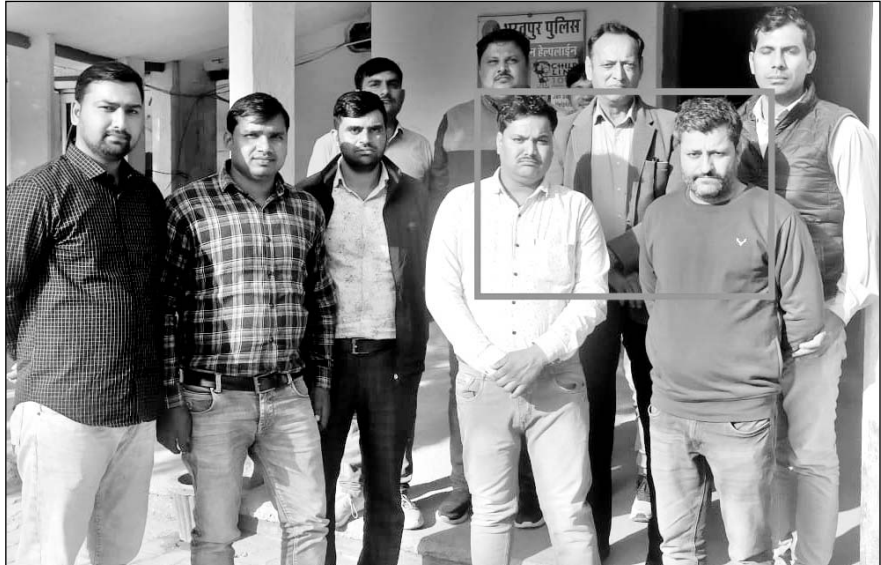
एसीबी भरतपुर की टीम ने पहाड़ी सीएचसी के डॉक्टर व दलाल को गिरफ्तार किया।